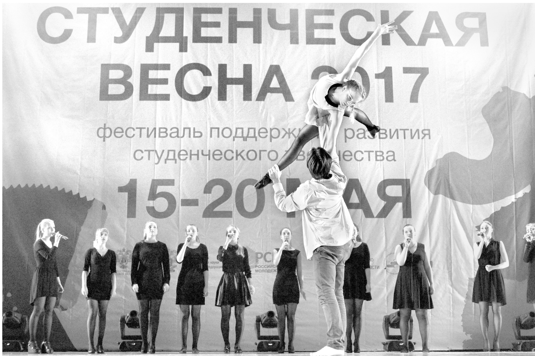
«Танцевальное направление» было массовым и зрелищным

– Мне больше всего запомнились конкурсанты из Казани. Замечу вот что: хочется больше свежих идей, свежее взгляда на хореографию. А между тем музыка в номерах странная. У ююри плейлист современной. Студвесне я ставлю оценку 4. Почему? Потому что, если поставлю 5, не к чему будет стре-