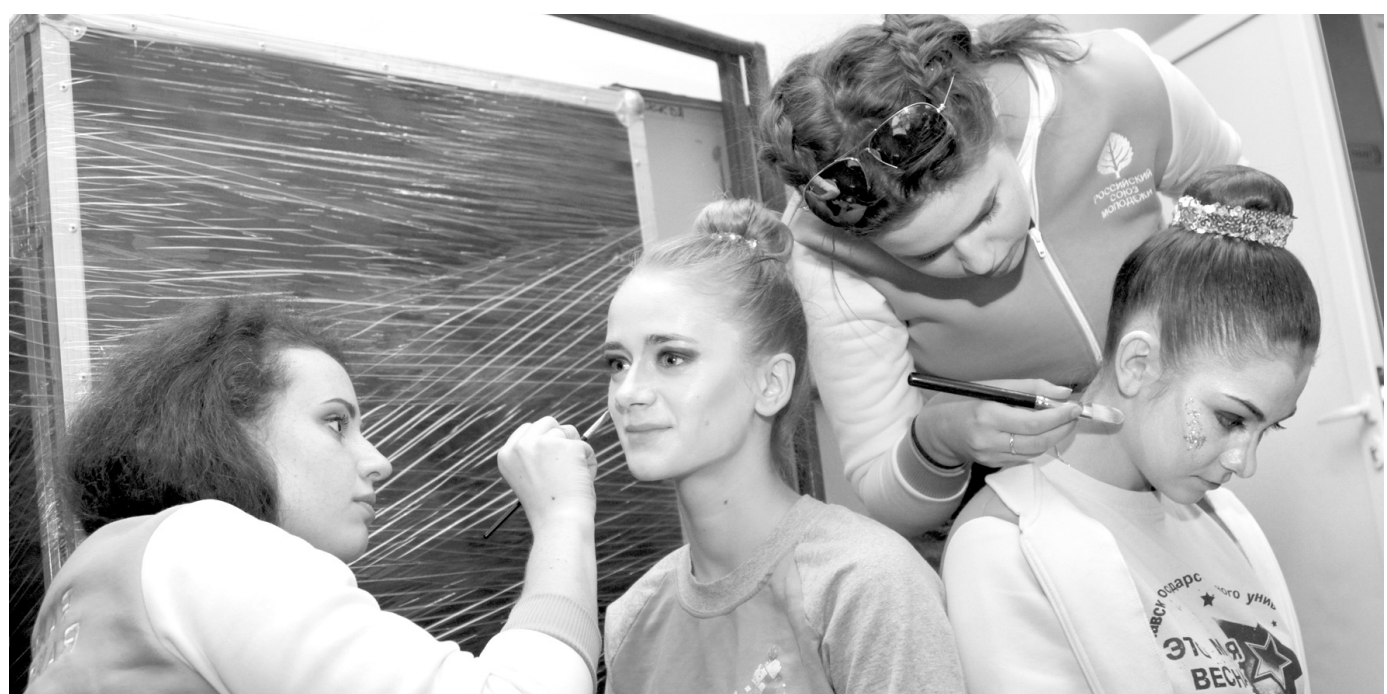
Закулисье цирка: конкурсанты помогали друг другу загримироваться