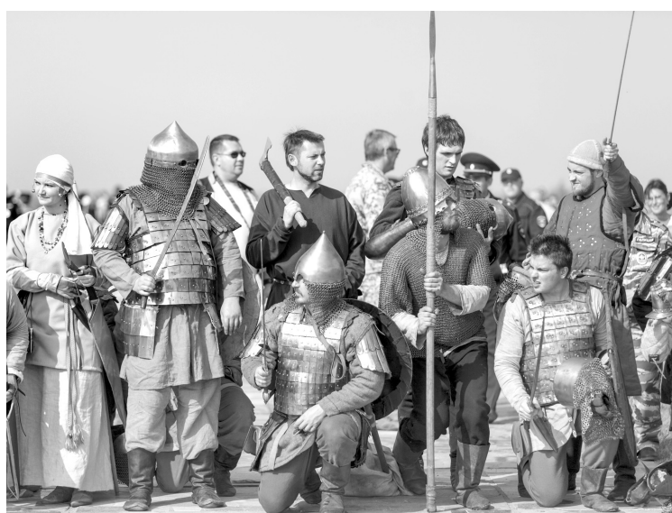
Возможно, такую картину увидят посетители комплекса «Древний град». Вот только когда он будет построен?