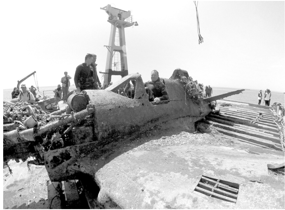
Туляк Константин Зайкин забрался в кабину истребителя

Врачи-специалисты ответят на все вопросы и обращения участников акции.