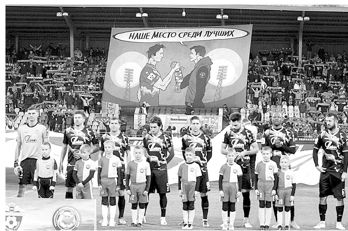
Болельщики постарались мотивировать «Арсенал» помощью баннера