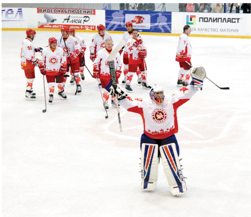
Губернатор после матча поблагодарил зрителей