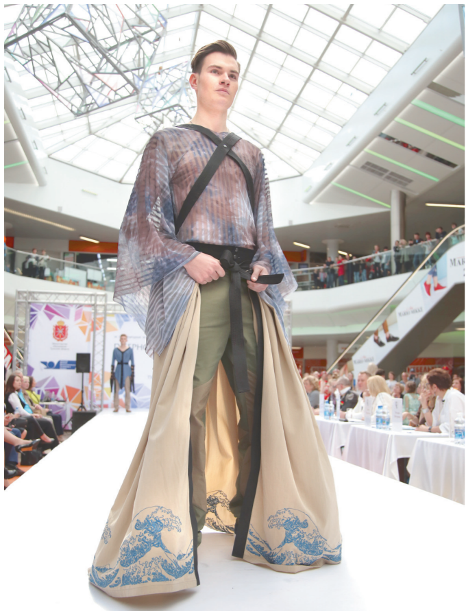
На подиуме есть место эксперименту

площадка для коммерческого продвижения перспективных работ, возможность налаживания делового сотрудничества модельеров с промышленниками.