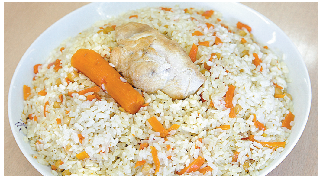
Блюдо одно, а вкус разный