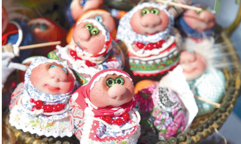
У каждой игрушки – свое лицо

известных мультяшек – в том числе «Ёжика в тумане».