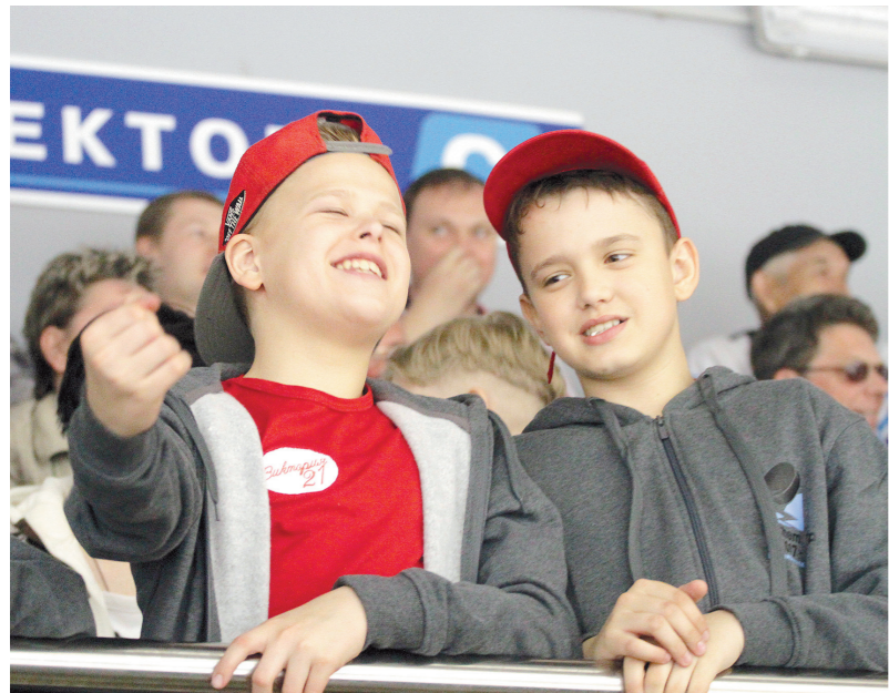
На трибунах болели от души