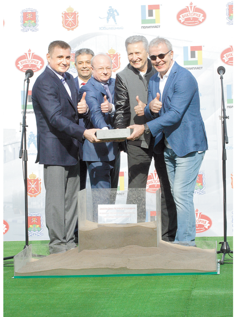
С легкой руки хоккейных мастеров

Символический первый камень в основание новой арены заложили в тот же день. Финансировать строительство будет компания «Полипласт», завершить работу предполагается за год.