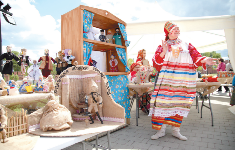
На «Тульском заиграе» хватает красок

Занятно было наблюдать, как современные мальчишки с упоением бьются на мешках, набитых тряпками, а девочки позируют на выставке тульских резных наличников – точно так же, как и их бабушки века назад, выглядывают в окошко.