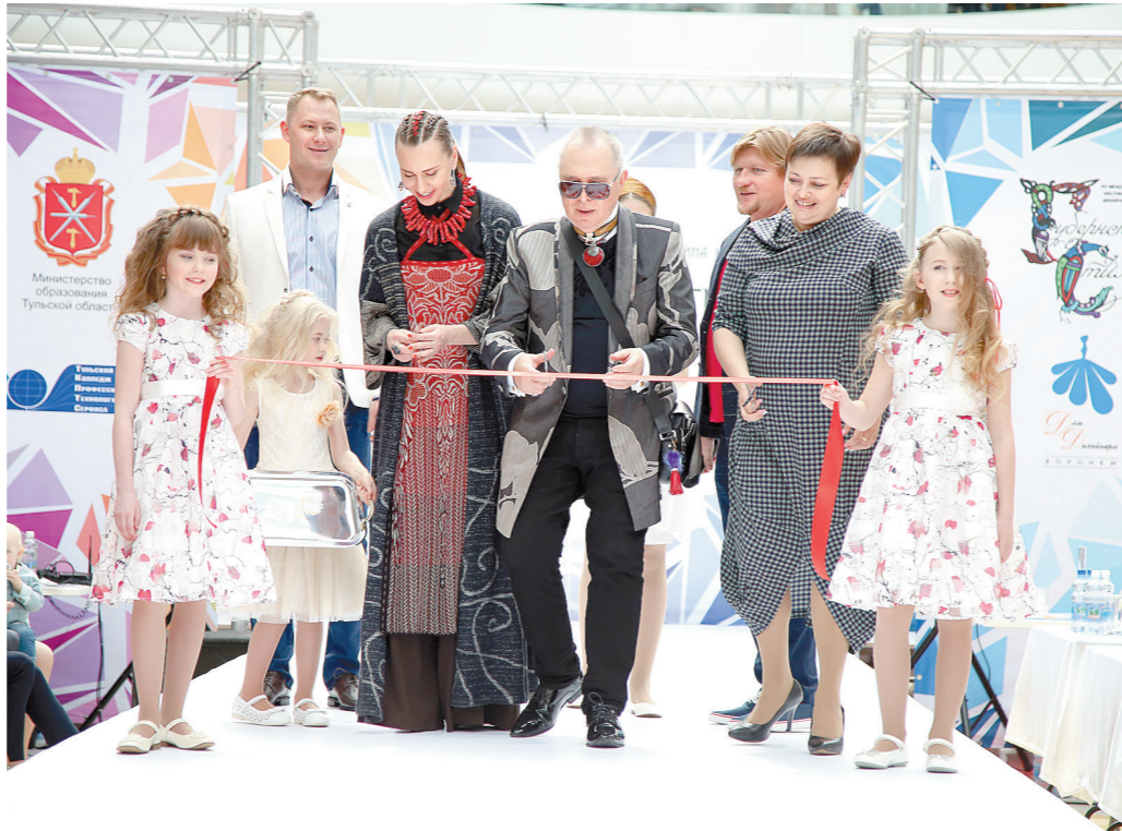
Вячеслав Зайцев открыл фестиваль