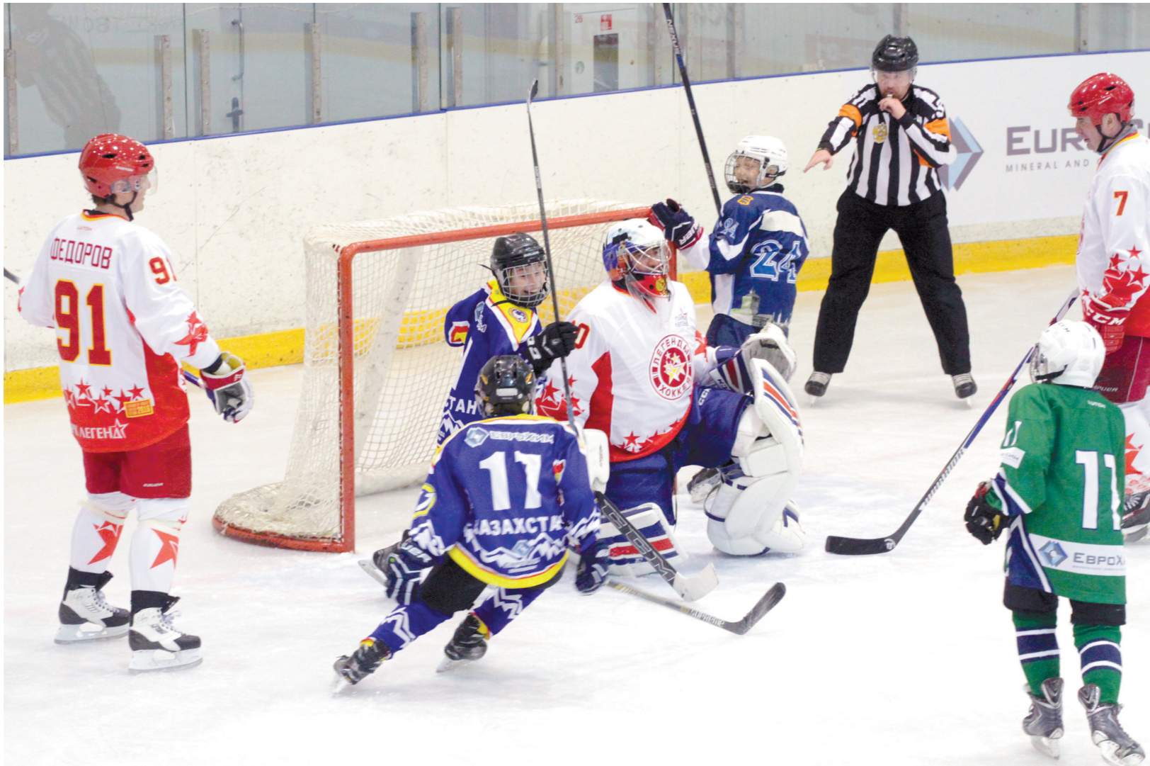
Забросить звездной команде – счастье для ребят

И все же главный подарок ребята получили уже после церемонии награждения: сборная турнира сыграла со сборной легенд отечественного хоккея. Помимо уже названных блестящих игроков, на лед вышли Алексей Касатонов, Ирек Гимаев, Александр Кожеников, Валерий Каменский, Алексей Жамнов, Игорь Болдин, Виталий