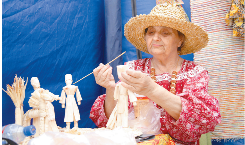
Кисть художника творит чудеса

Кульминацией мероприятия стал флешмоб по изготовлению игрушки «Тульская свадебная парочка», в завершение которого в небо взмыла трехметровая кукла – символ семейного счастья и благополучия.