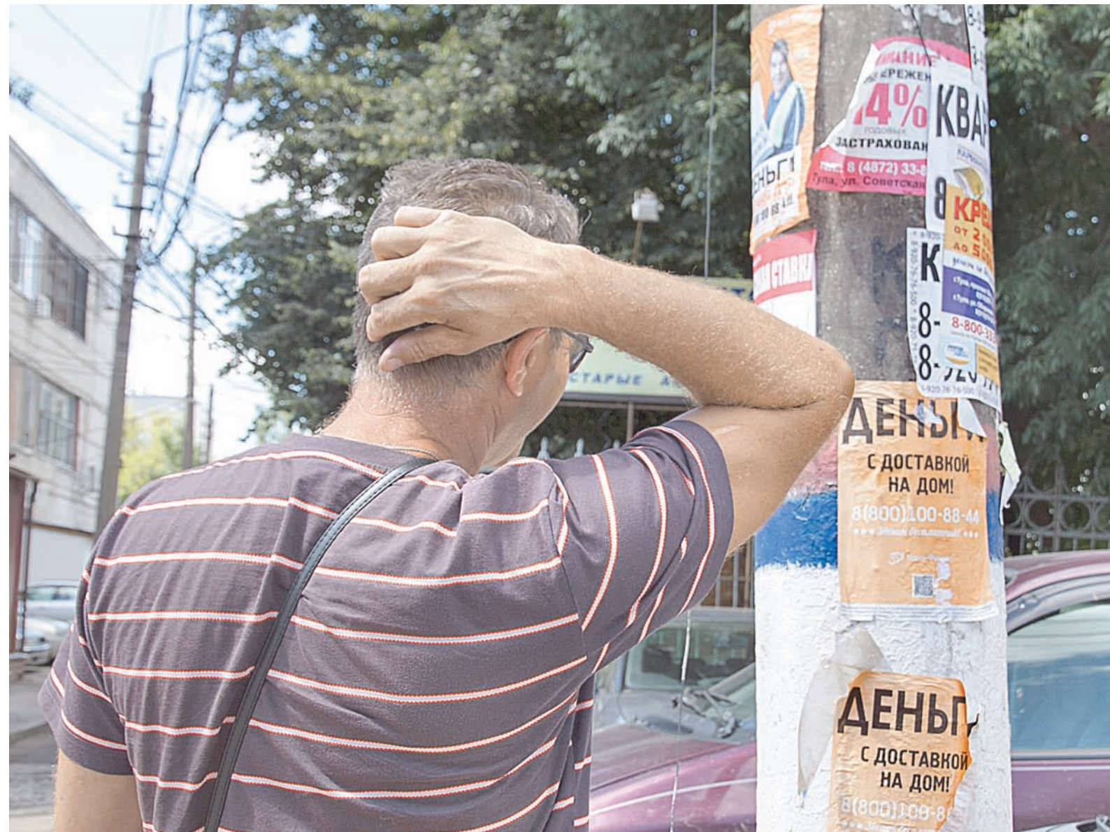
Собираясь одалживаться, вспомните главную формулу займа: берешь чужие и на время, отдаешь свои и навсегда

– Дело в том, что с 29 марта этого года все МФО разделены на компании микрофинансовые (МФК) и микрокредитные (МКК). Обратите внимание, что МКК не могут привлекать деньги населения, а только средства своих участников – учредителей и имеют право выдавать займы не более 500 тысяч рублей. К микрофинансовым компаниям предъявляются более серьезные требования: уставный капитал у них должен быть не менее 70 миллионов рублей, они могут выдавать займы до 1 миллиона рублей и привлекать деньги