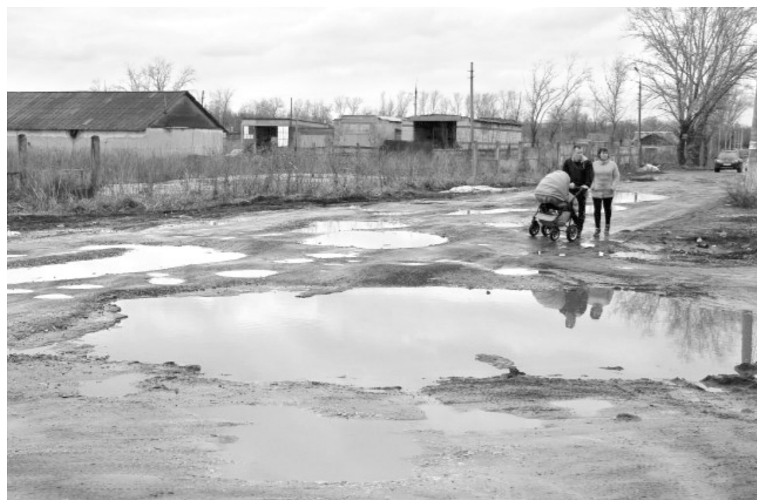
Дорога до ремонта

Глава региона держит на особом контроле обращения граждан, в том числе и касающиеся дорог. Алексей Дюмин обратил внимание властей Донского на проблему улицы Калинина, и местные чиновники нашли возможность привести в подобающее состояние обозначенный участок. Теперь дорога отсыпана щебнем, а на следующий год запланировано ее асфальтирование в рамках проекта «Народный бюджет».