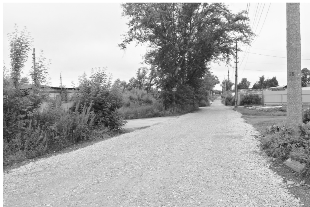
Дорога после ремонта