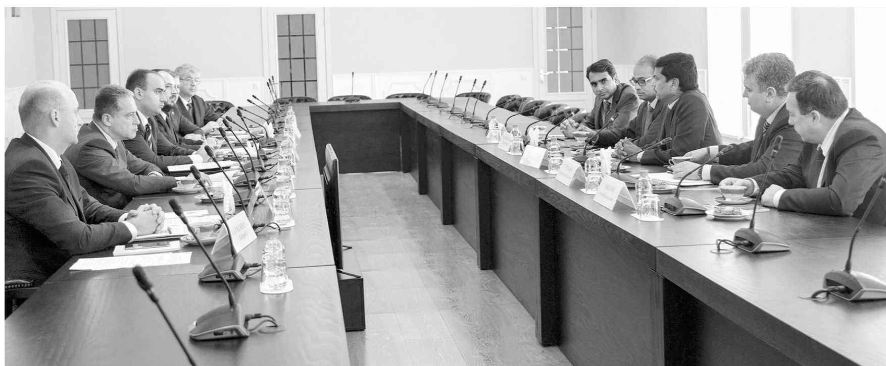
Руководители компании обсудили перспективы проекта с представителями правительства области

Заместитель министра промышленности и торговли России Сергей Цыб в рамках диалога с индийскими гостями отметил, что развитие фармацевтики и возрождение выпуска в нашей стране современных медикаментов также поддерживаются государством. Участие в этом процессе компаний мирового уровня, к каковым относится и «Хетеро Лабс Лимитед», придает ему мощный инновационный импульс.