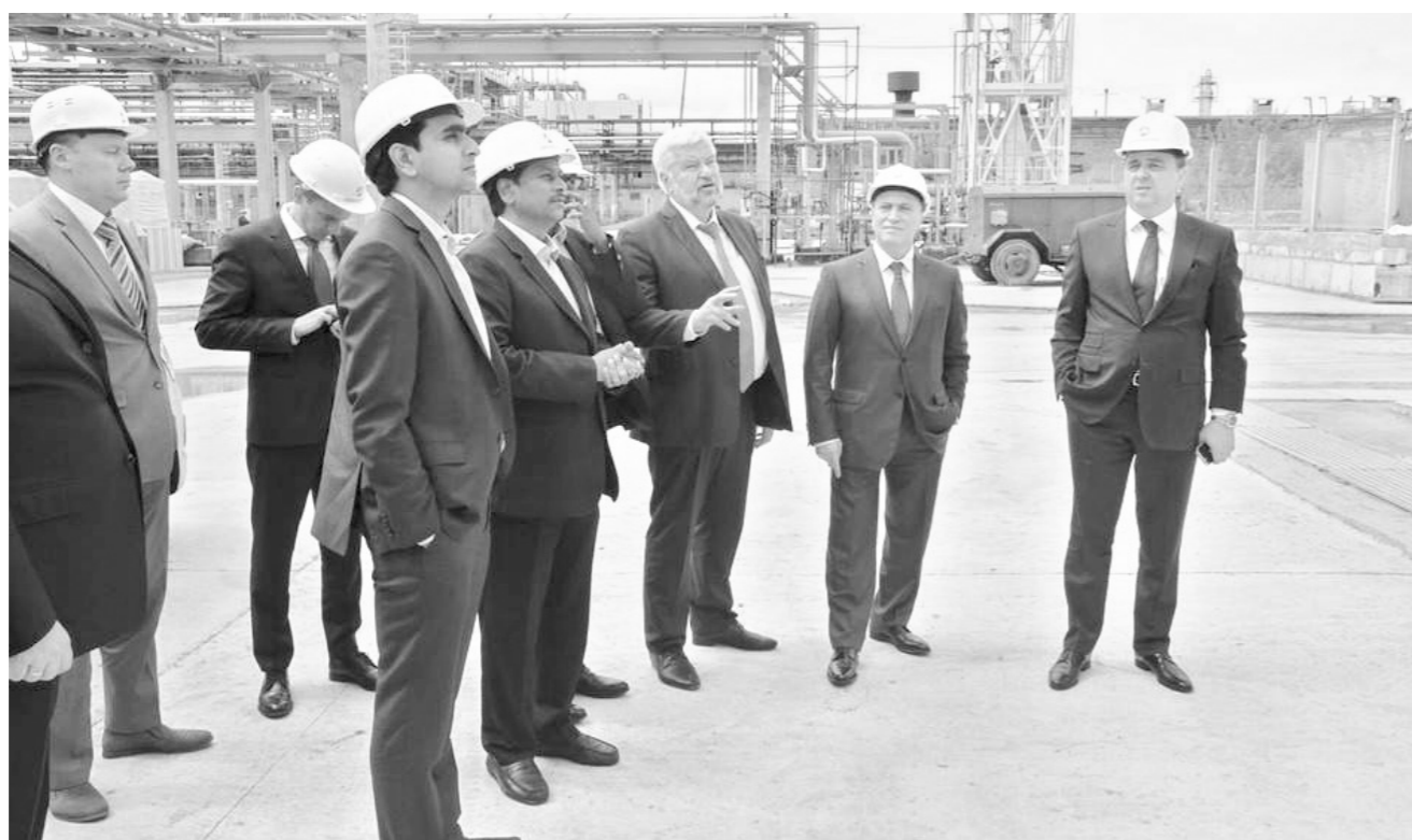
Индийская делегация познакомилась с производственными проектами «Щекиноазота»