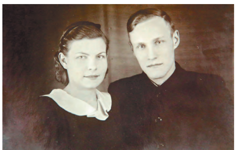
Будущие супруги познакомились в студенческие годы

Кстати, у ветерана также имеется обширный материал для методического пособия к уроку памяти. Глава региона отметил важность этой разработки и поручил министру образования воспользоваться уникальными документами на уроках в школах и Суворовском училище.