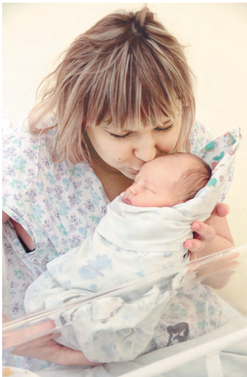
С 2010 года в Тульской области появилось на свет более 106 тысяч детей

В настоящее время в Министерстве финансов Российской Федерации находится на рассмотрении проект постановления правительства Тульской области, устанавливающий дополнительную меру социальной