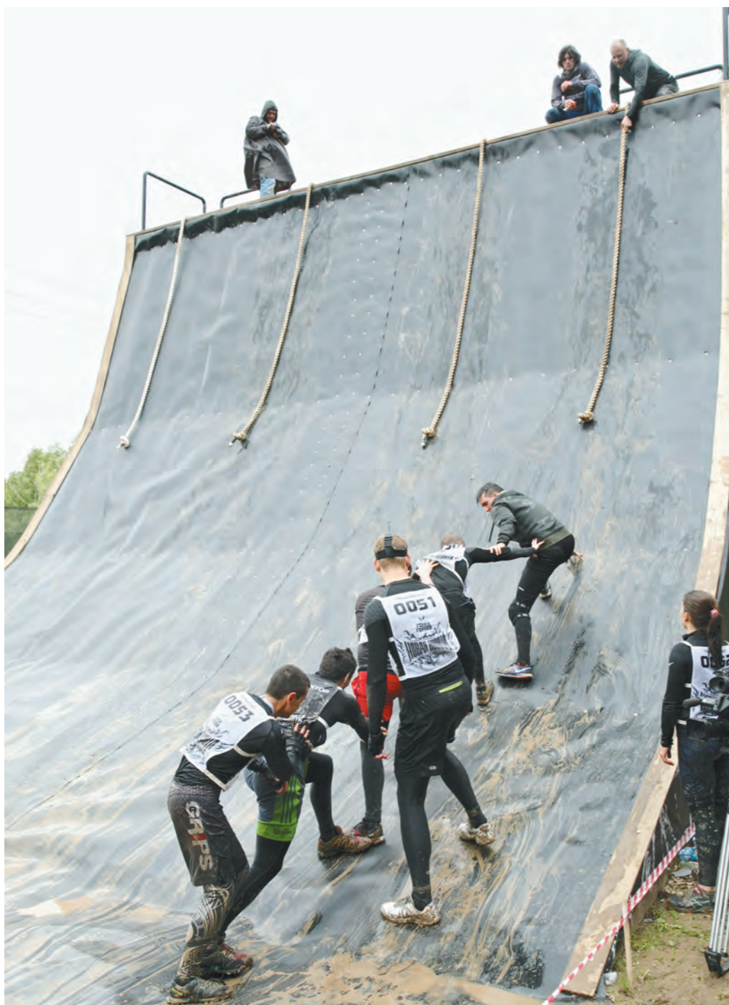
«Эверест» сдается находчивым