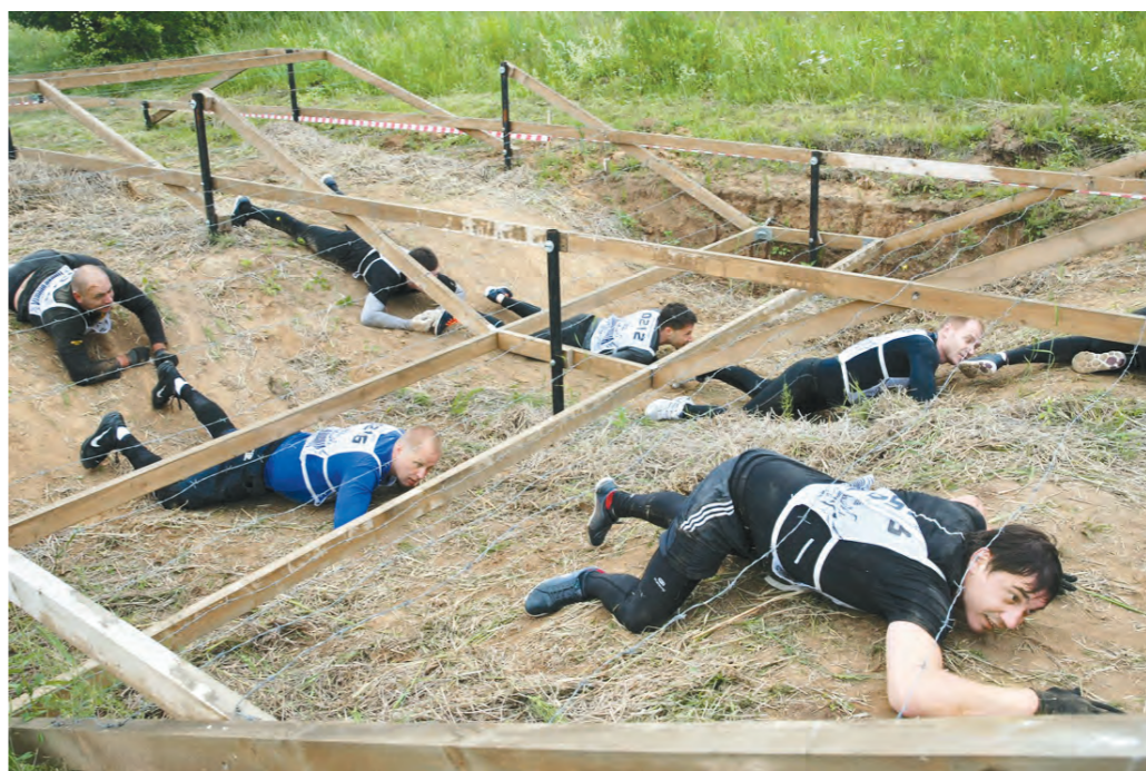
Ползком к победе!

Но вообще-то сравнивать их не стоит, хотя бы потому, что трасса в Алабине – праматерь всех остальных в российских регионах. Сначала соревнования проходили исключительно там, а сейчас везде – от Казани до Камчатки.