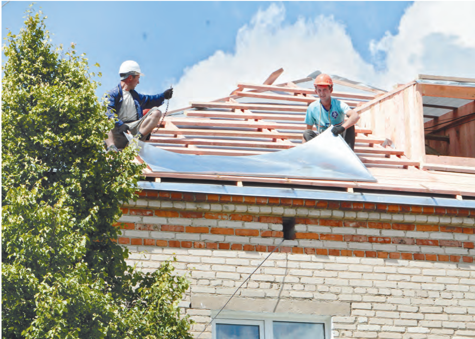
В доме на улице Центральной крышу заменят полностью