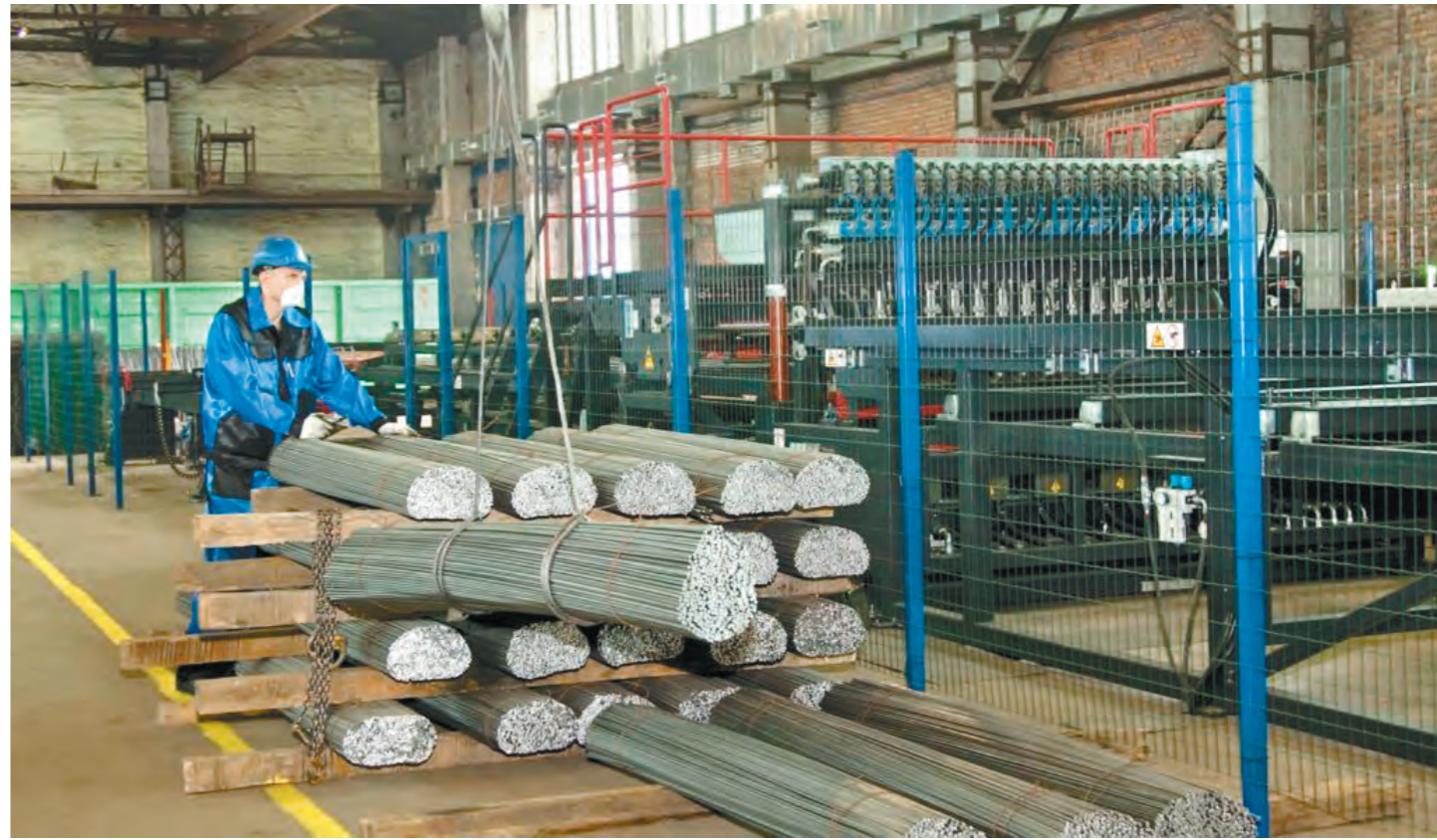
Под Суворовом будут выпускать строительную арматуру