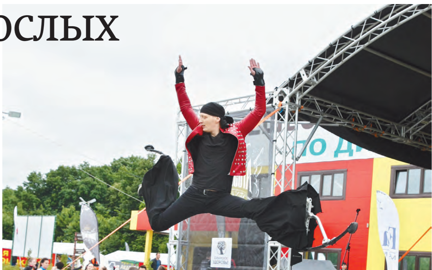
Участников и гостей развлекали джамперы