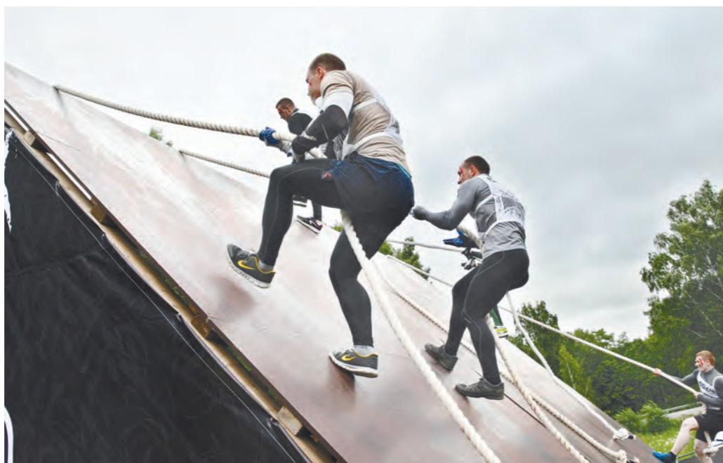
Испытание первое: пройти, где не ступала нога человека