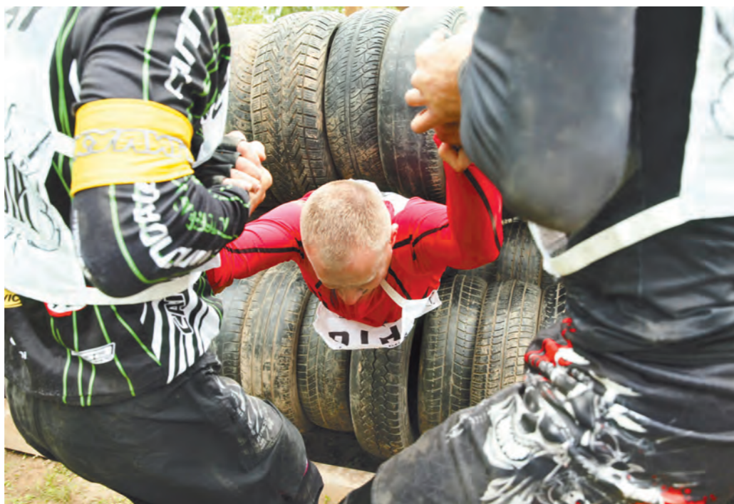
На препятствии «Рожденный заново» особенно нужна помощь команды