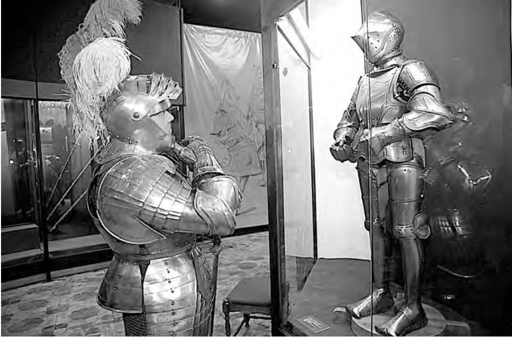
Элита эпохи Ренессанса увлеченно играла в античность, образ идеального государя – воина, рыцаря – был исключительно важен