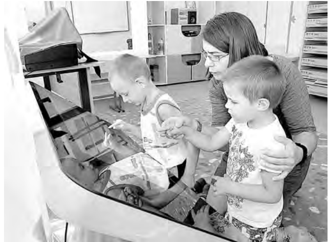
В центре имеется самое современное развивающее оборудование

Бывает так, что родственники особенных деток опускают руки: не может ребенок самостоятельно поест, умыться или одеться – ну и ладно, оденем, умоем, накормим с ложечки. Не способен научиться считать или выучить буквы – и пусть растет неучем. Родители подчас даже не знают, как правильно играть с таким малышом. И не играют. А это в корне неправильно, просто таким ребятишкам, чтобы закрепить навык или информацию, надо повторить не раз и не два, а, возможно, раз пятьдесят, но