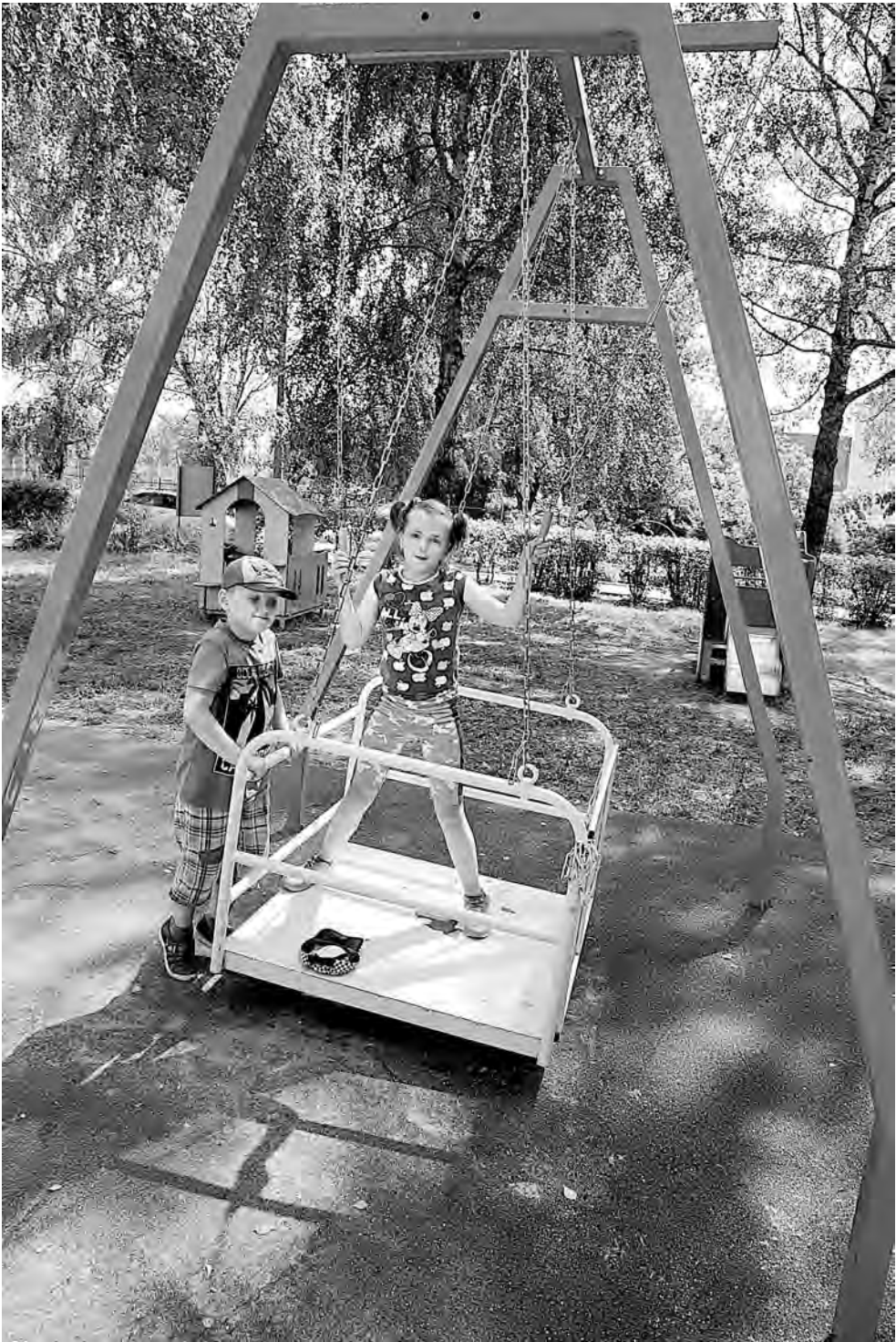
Благодаря фонду «Перспектива» на площадке появились качели и карусели для детей-инвалидов

В результате помощи получают не только несовершеннолетние, но и их родители. Некоторые признаются, что за последние лет пять впервые смогли, оставив ребенка в надежных руках на несколько часов, побывать у врача, заняться решением других давно накопившихся проблем. Да просто хоть немного отдохнуть. Кстати,