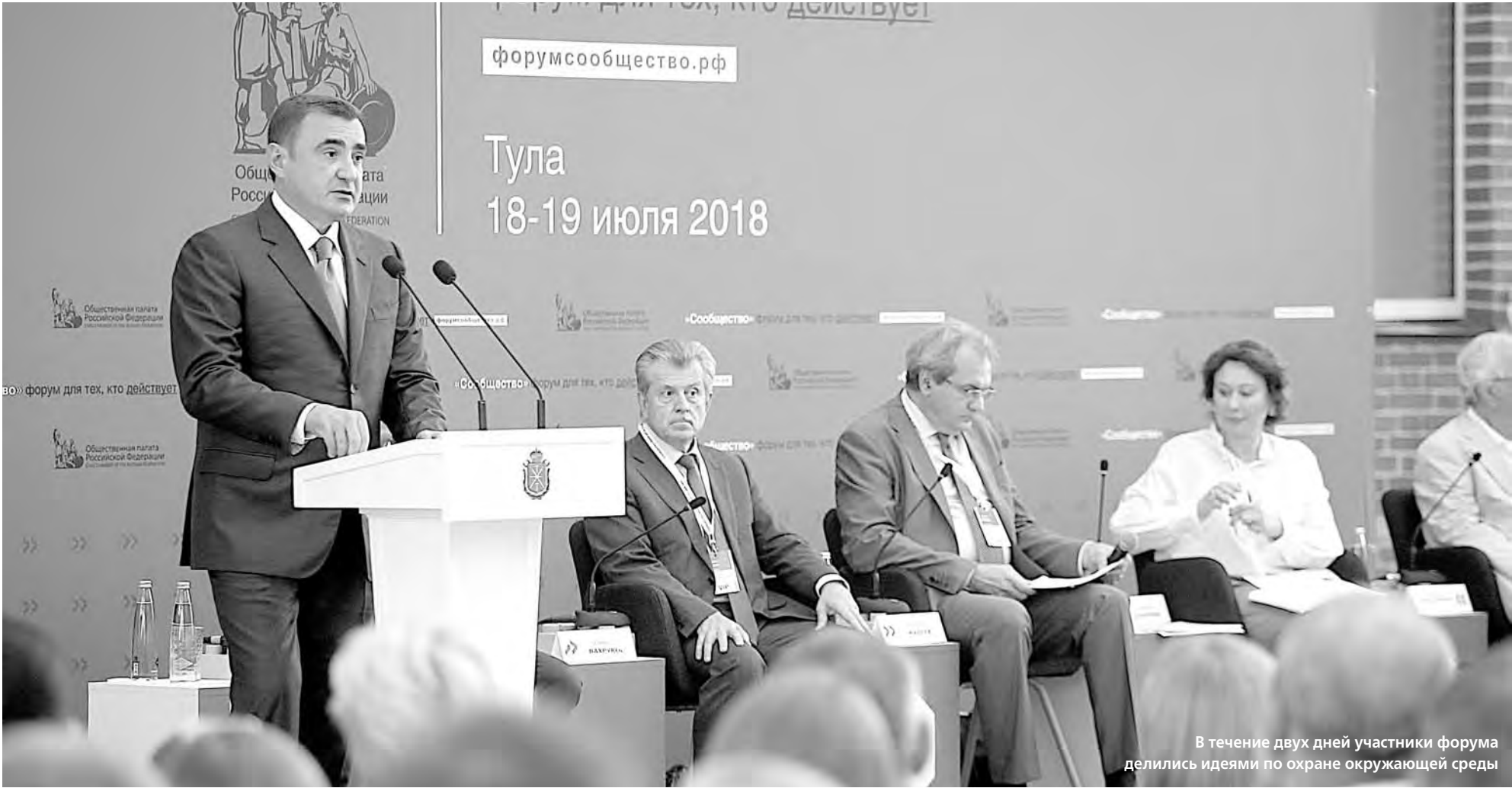
В течение двух дней участники форума делились идеями по охране окружающей среды