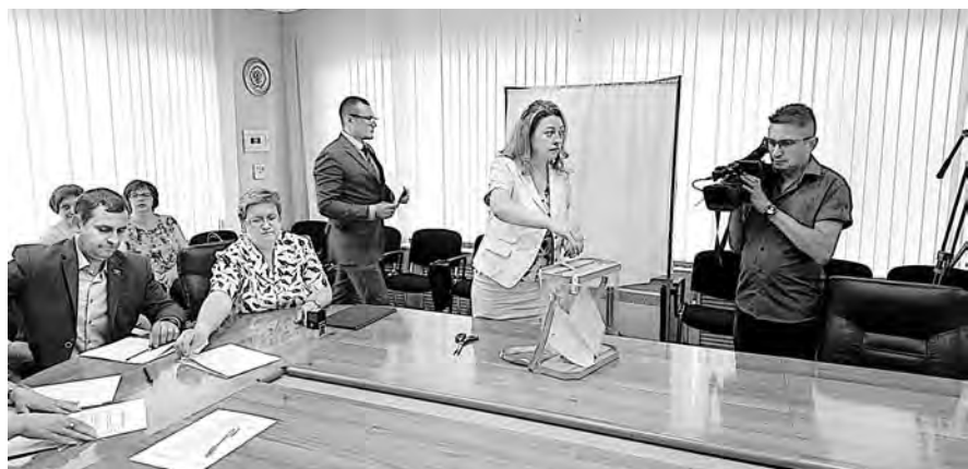
На выборах зампреда облизбиркома все по-настоящему: от кабинки и опечатанной урны для голосования до счетной комиссии