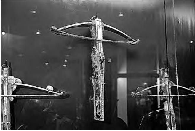
Парадное оружие было символом власти и богатства, оно являлось неотъемлемой частью праздничной придворной культуры того времени

Здесь показаны образцы парадного европейского оружейного искусства пери-