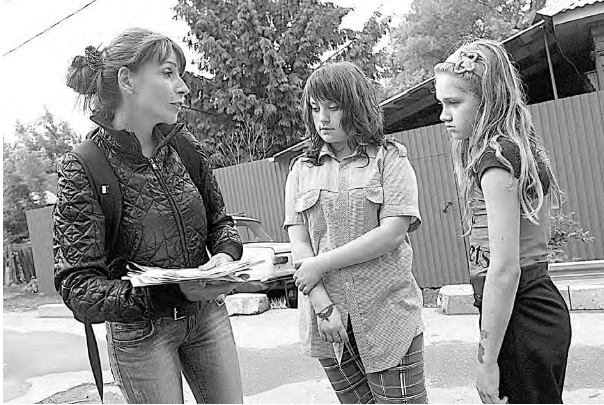
Раздача листовок — один из аспектов работы поисковых отрядов

Также центр проводит обучение в рамках реализации гранта из бюд-