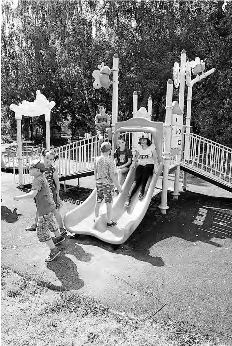
Лето, солнце, общение

– Организаторы и волонтеры говорят, что ожидали увидеть на смене «Цифровой мир» угрюмых и нелюдимых программистов. А приехали веселые и активные ребята, любящие спорт и активный отдых. Участники форума – это большая дружная семья. Мы помогаем друг другу, делимся опытом, много общаемся. Каждый день расписан по минутам. Хочешь учиться – иди на лекцию, хочешь творить – на мастер-класс, заниматься спортом – пожалуйста, да еще и с тренером. Больше всего нравится, что, какой бы важной персоной ни был спикер, общение проходит на равных, уважительно, но в то же время без барьеров и границ. Это здорово!