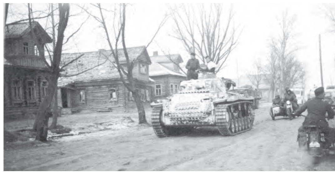
На оккупированной территории гитлеровцы опирались на старост и их помощников из числа местных жителей