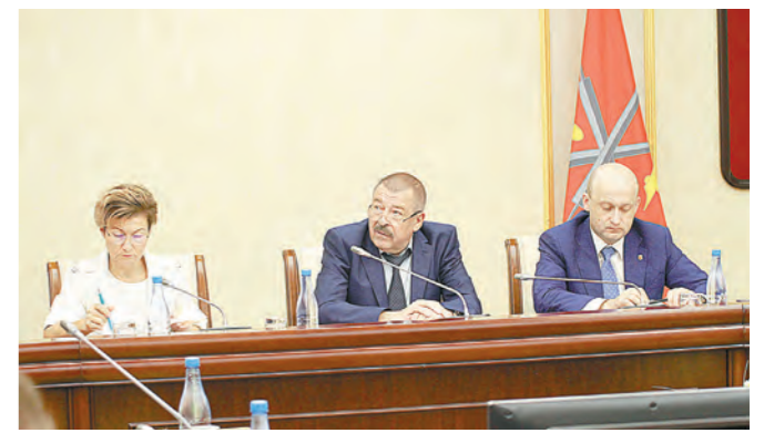
Участников межведомственной комиссии интересовало, за счет каких поступлений погашаются долги перед рабочими на КЗЛМК