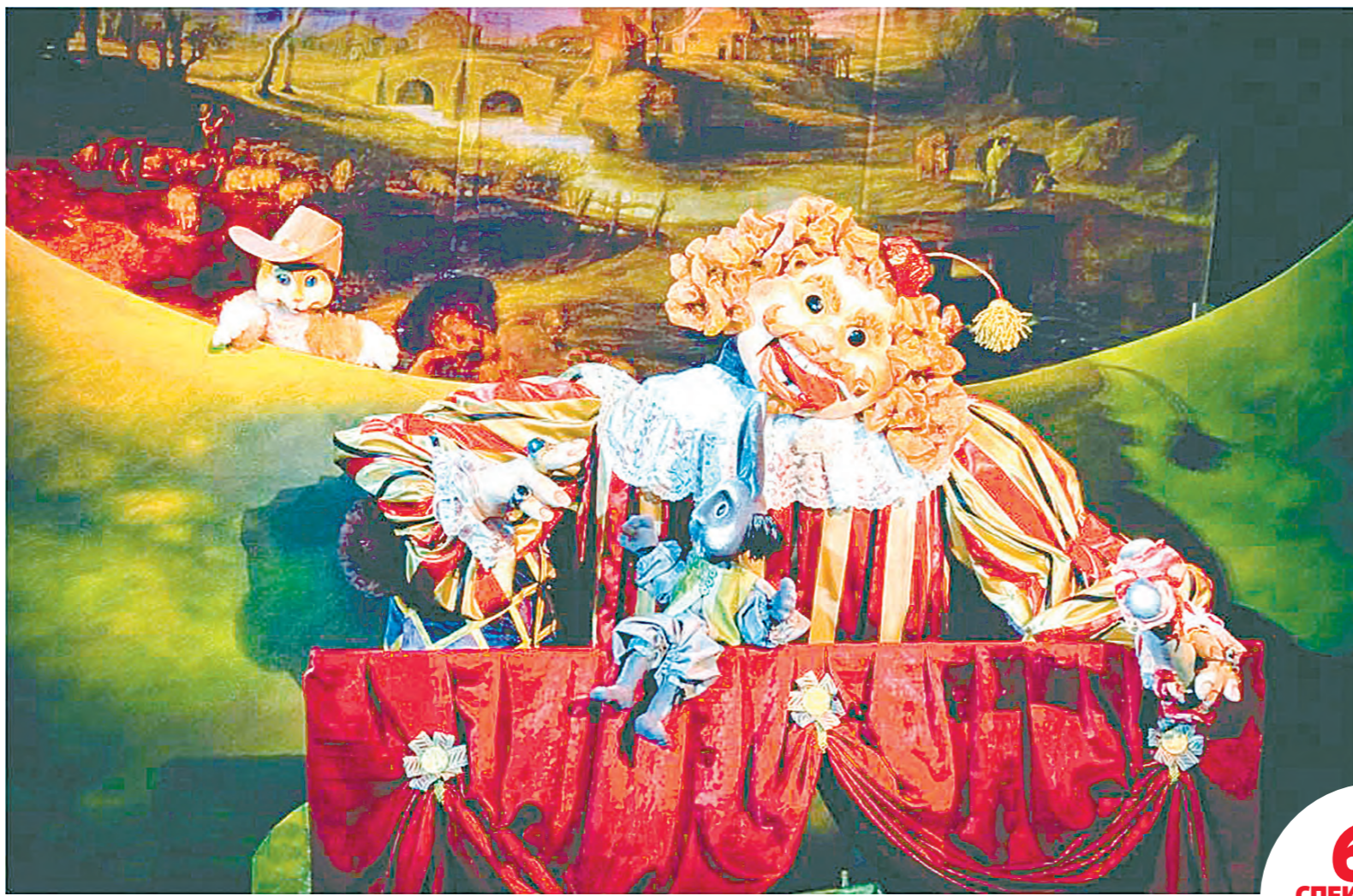
Все персонажи – Маркиз, Король, Принцесса – тоже с хвостами и ушками, такая вот кошачья история