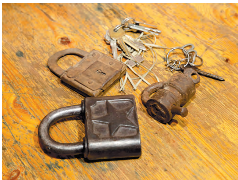
Часть экспонатов музейщикам принесли жители Тулы

Так называемый тульский, или винтовой, замок – пожалуй, самая старая разновидность из того, что у нас в стране производилось. Винтовой он потому, что у ключа нет привычной ныне бородки – на ключ наплавилась завернутая винтом проволока. Его вворачивали в замок, и, когда он доходил до упора, дужка откидывалась.