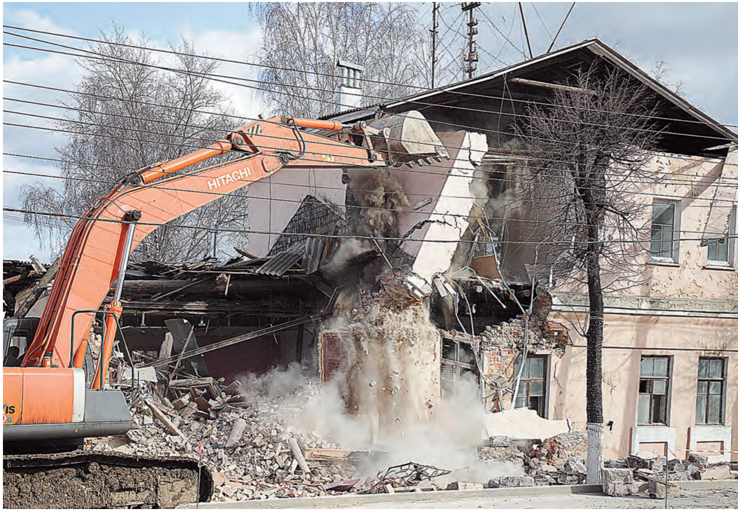
Итогом исполнения программы будет не только само расселение, но и снос аварийных домов