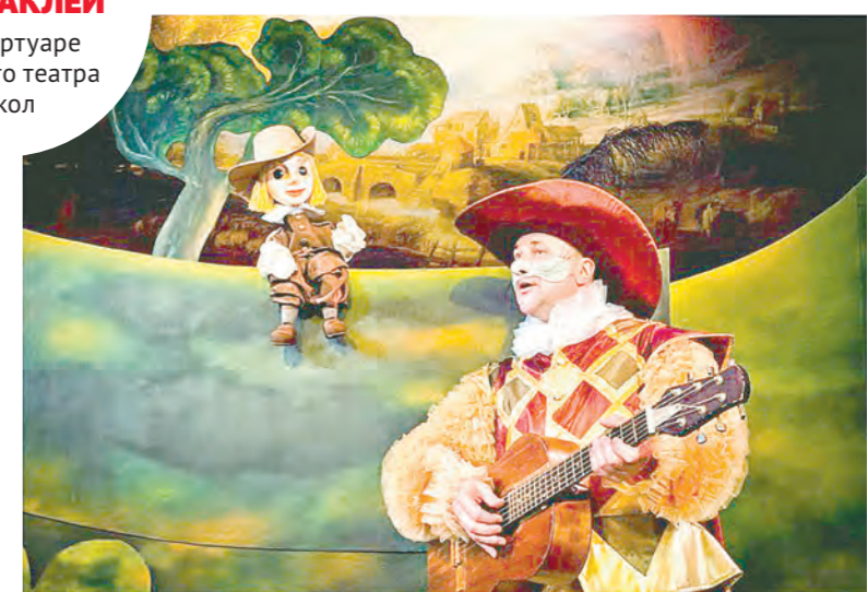
Кот в сапогах в тульском прочтении – это мюзикл

60 СПЕКТАКЛЕЙ в репертуаре Тульского театра кукол