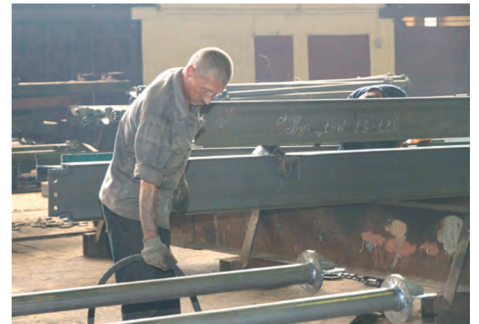
Сейчас задолженность перед заводчанами – 12,5 млн рублей