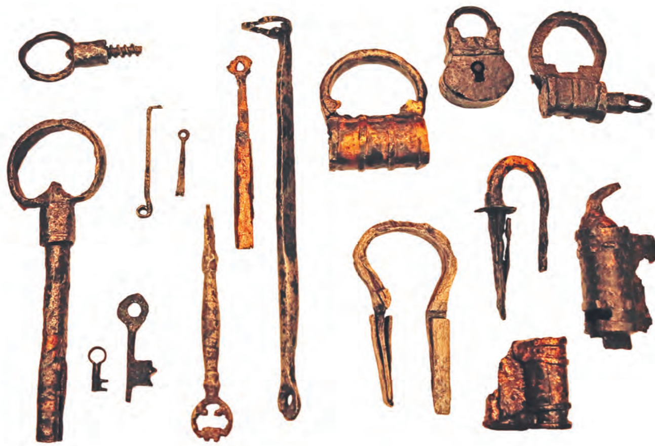
Выставка будет рассказом о замочном и скобяном производстве в разных странах мира

Всего будет представлено более 300 экспонатов. Основу экспозиции составят находки, обнаруженные на раскопках в Туле и по области, а также этнографические коллекции XIX–XX веков,