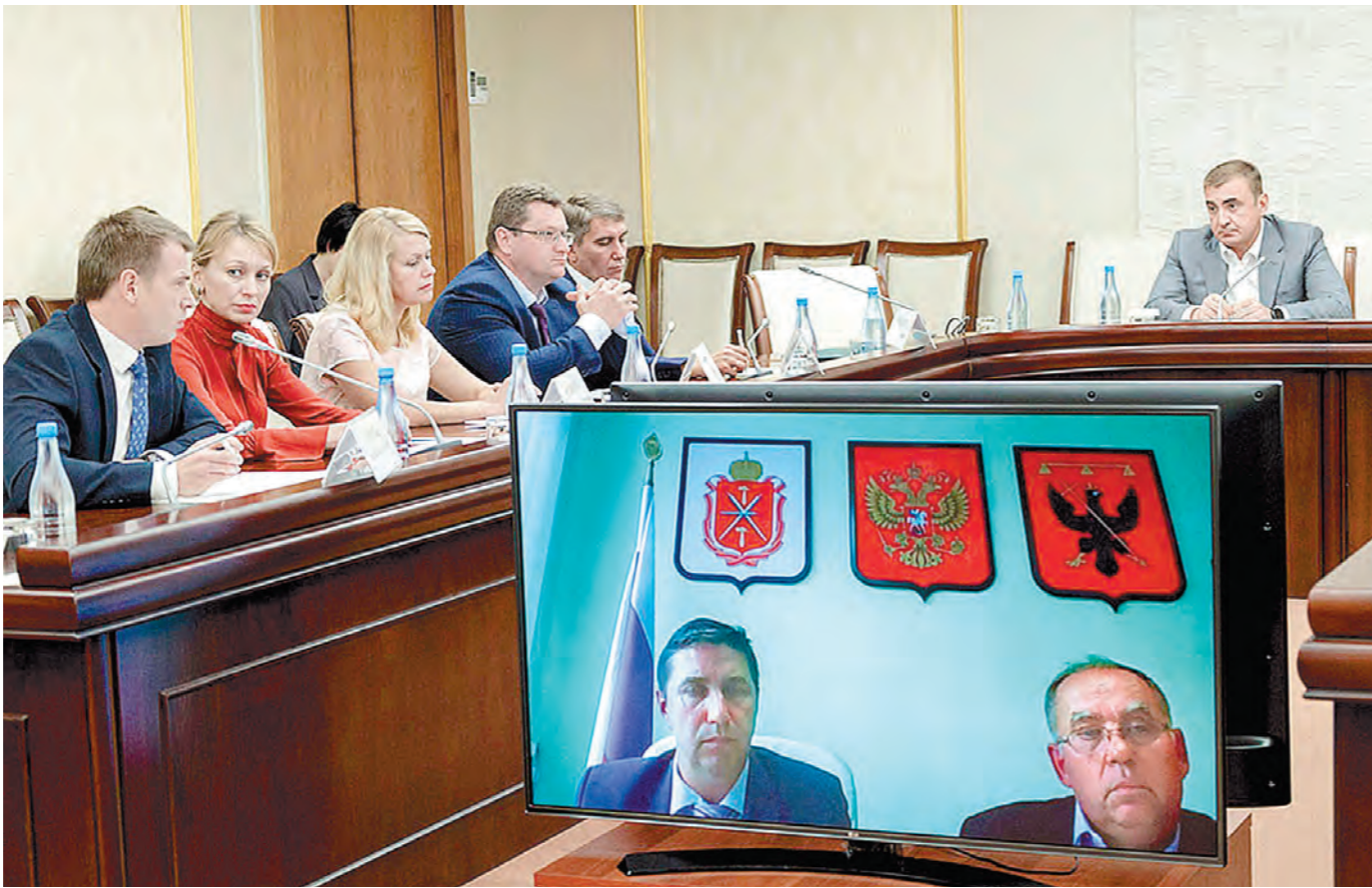
Общение с жителями отдаленных деревень проходило в режиме видеосвязи

По видеосвязи с главой региона смог пообщаться предприниматель из Одоевского района, рассказавший, что уже много лет он выра-