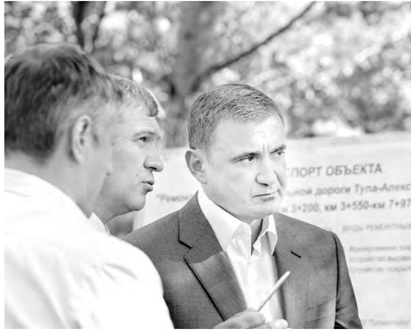
Губернатор ознакомился с ходом ремонтных работ на дороге в Обидимо

– Объем работ большой, только региональных дорог нужно отремонтировать 190 километров, – отметил губернатор. – Однако