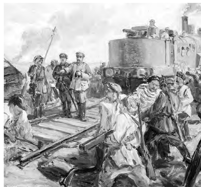
...а скоро туристам здесь будут рассказывать о приезде в Сергиевское Иосифа Сталина

– Историю станции мы воссоздаем для потомков, опираясь на раз-