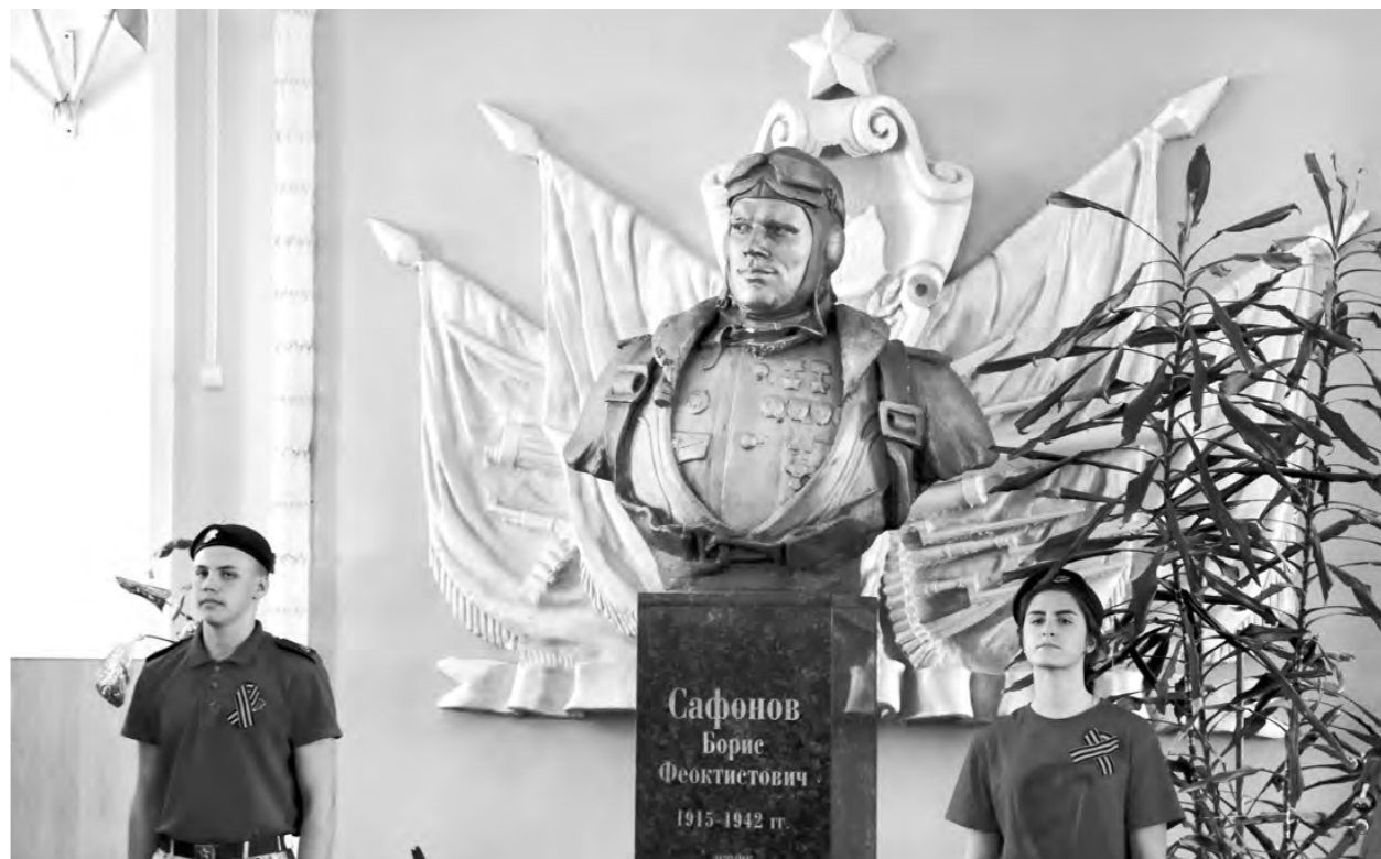
Так сейчас станция Плавск выглядит внутри...

Напомним, Иосиф Сталин прибыл в село Сергиевское в штаб Южного фронта 3 октября 1919 года, а 11-го числа отправился оттуда в Серпухов в связи с переездом штаба. Конечно,