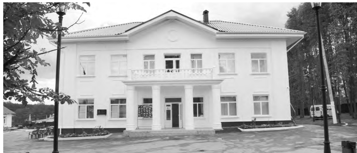
В Центре для одаренных детей к 1 сентября готовы

педагоги вложили в них очень много труда и души. У этих ребят весьма высокий интеллектуальный потенциал, они мотивированы учиться, решать трудные задачи, готовы работать в экстремальных ситуациях и способны на мозговую штурм. У них великолепные творческие возможности, у многих большие способности к изучению иностранных языков. Надеюсь, в будущем эти дети составят костяк интеллектуальной элиты Тульской области. Выбрать лучших из них будет очень сложно, на мой взгляд, практически все эти мальчики и девочки достойны того, чтобы учиться в Центре для одаренных детей. Но даже если кто-то и не поступит, я уверена, способности этих ребят помогут им реализовать себя и состояться в жизни.