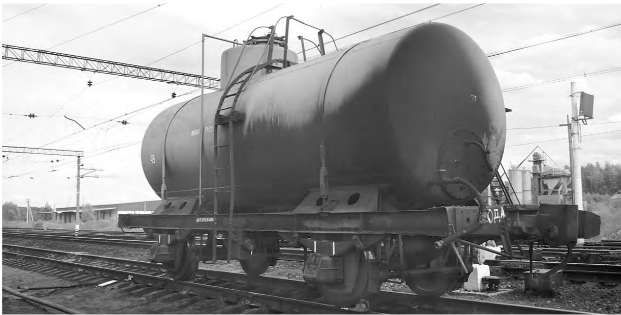
Аналогичная двухосная цистерна станет украшением железнодорожной станции

личные источники, в том числе литературные. Сейчас в нашей стране отмечают 200-летие со дня рождения писателя Ивана Тургенева. Мы в Плавске отразим одну из страниц его жизни, для чего приведем знаковое высказывание Ивана Сергеевича о селе Сергиевское, – продолжает наш собеседник. – Знаменитый литератор писал: «Я бы... каждому музыканту посоветовал съездить послушать хор сергиевских мужиков; я ему отвечаю, что он бы не раскаялся в своей поездке и, может быть, вынес бы оттуда не одну мысль и не одно замечание». Также расскажем туристам об истории предприятий – первых заводов, развивавшихся благодаря появлению в Плавске железной дороги. На станции в экспозиции под открытым небом появится маневровый тепловоз прошлого столетия и двухосная цистерна, в которой когда-то перевозили спирт.