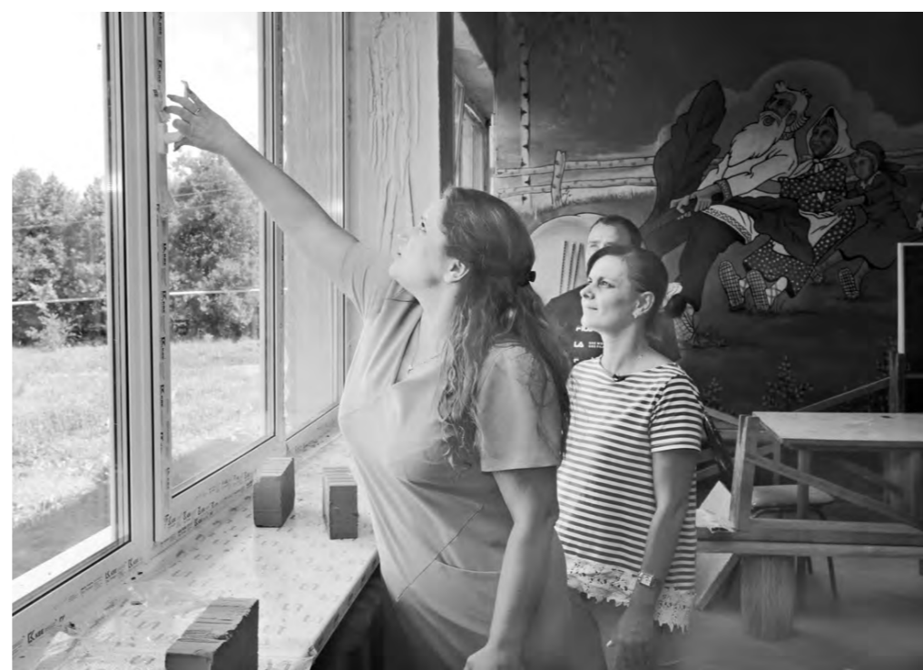
Вместо старых деревянных рам – пластиковые окна