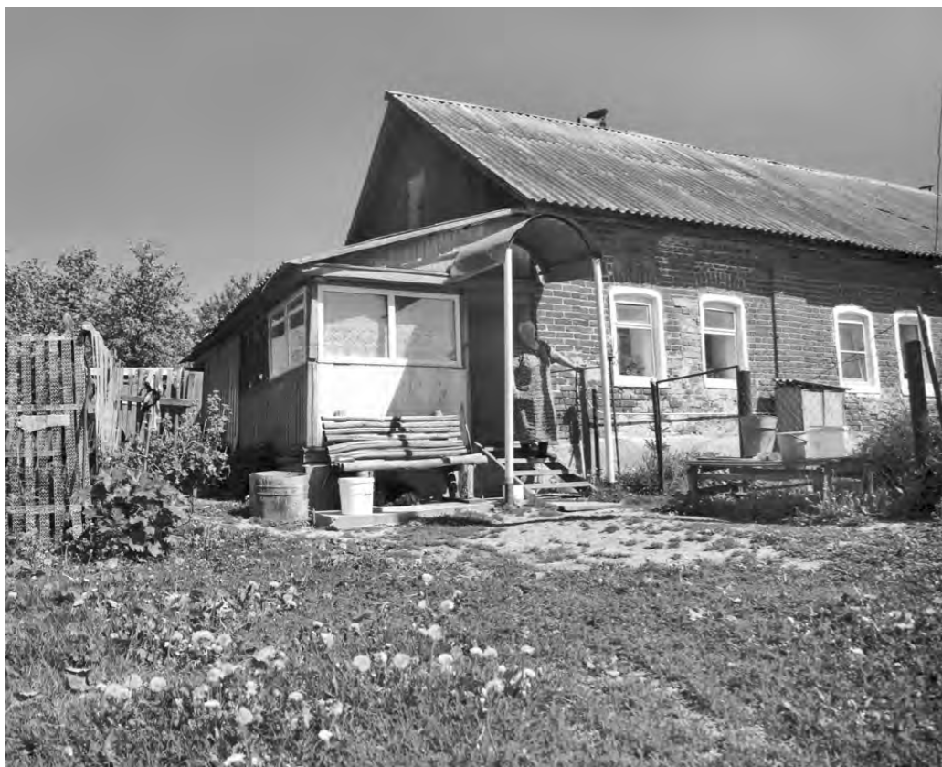
В 2016 году определили кадастровую стоимость почти 2 миллионов объектов недвижимости