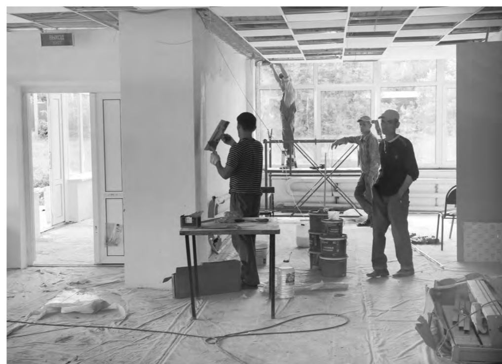
ДК преображается на глазах