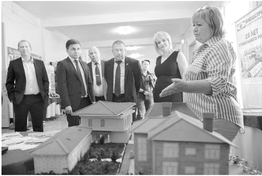
В фойе проходила выставка предприятий строительной отрасли