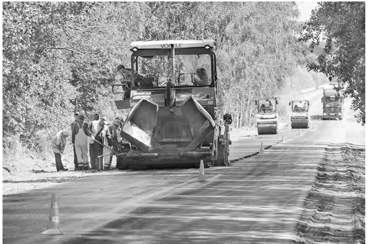
Из 37 дорог региона, где ремонт ведется в этом году, пять уже готовы к приемке