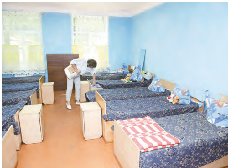
Выездная проверка инспектирует комплекс условий для безопасности и здоровья детей

ые окна, заменили полы и потолки. Появилась отдельная душевая для детей младшего возраста. Капитально отремонтировали умывальные и туалетные комнаты, а также медицин-