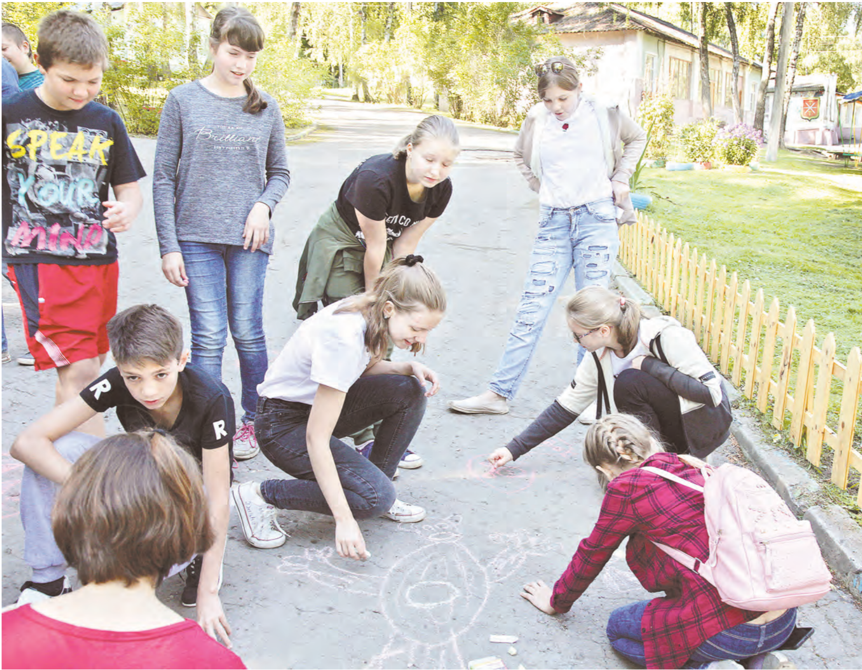
Скучать в лагере ребятам некогда – каждый день проходит несколько мероприятий

– Провели косметический ремонт во всем лагере. В каждом корпусе сделали второй пожарный эвакуационный выход, установили новые пластиковые