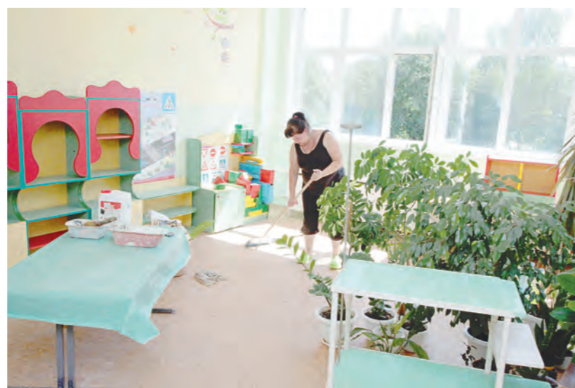
В школах и детских садах завершается подготовка к приему детей

Большое внимание уделяется здоровью детей в образовательных организациях. Одним из аспектов