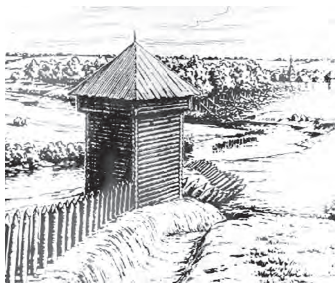
Оборонительные сооружения засечной черты