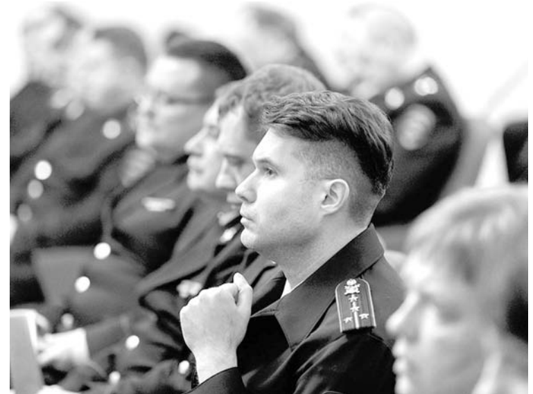
В этом году сотрудникам полиции предстоит обеспечивать безопасность при проведении выборов Президента РФ и чемпионата мира по футболу

Предстоит продолжить борьбу с мошенниками – увы, коли-