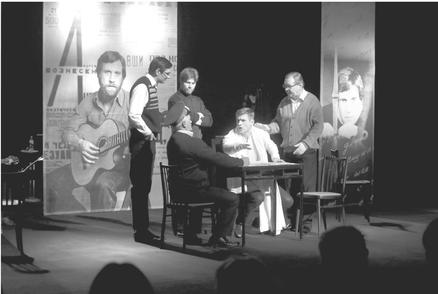
Актеры признавались: репетировали легко, премьеру тоже отыграли на одном дыхании