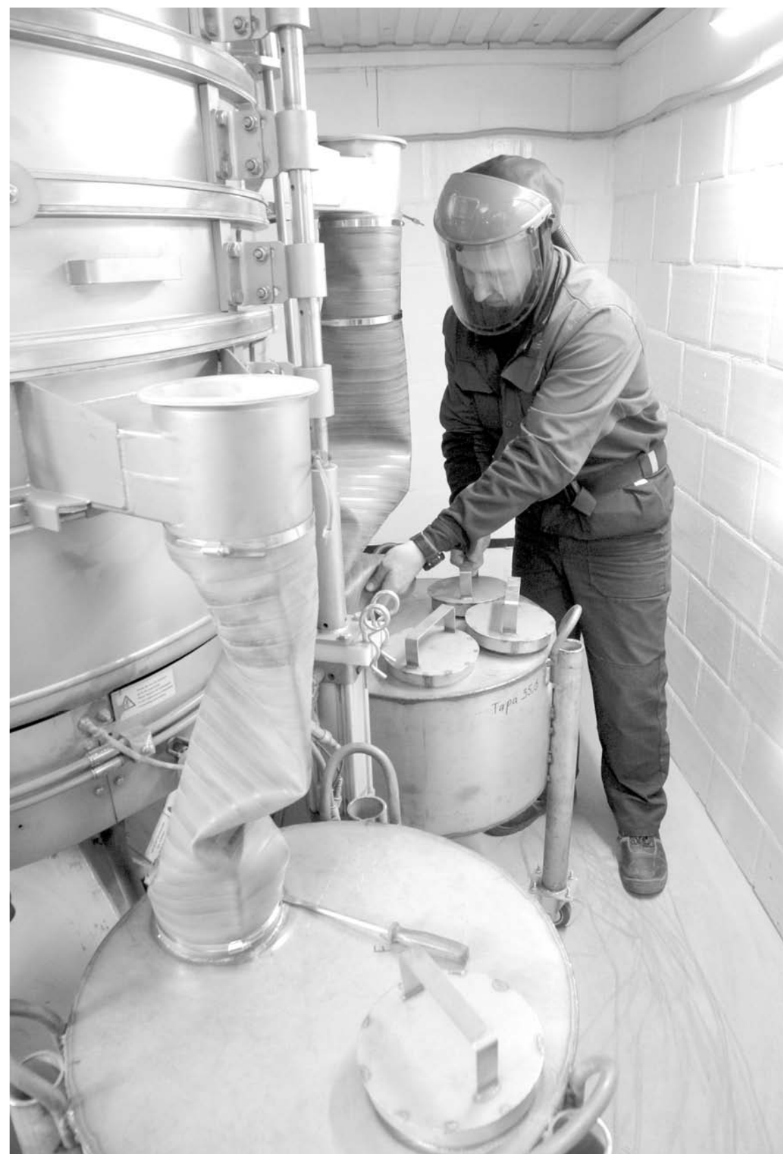
Реализация программы по повышению производительности труда уже дала свои результаты

ции таких перспективных инвестиционных проектов приходилось набирать новый персонал, то участие в программе «Повышение производительности труда и поддержка занятости» позволило кардинально изменить подход, обучая новым навыкам своих проверенных специалистов. В рамках внедрения программы «Полема» планирует в три раза увеличить производительность труда на участке изготовления распыленных (металлических) порошков. При этом численность персонала этого участка сохранится на нынешнем уровне. Часть трудящихся будут обслуживать новое производственное оборудование, вводимое в действие в 2018 году. Ранее на эти цели планировалось набрать 15 новых работников. Длительность процесса выпуска продукции сократится примерно в 3 раза – с 20 до 7 дней. Таким образом предприятие улучшит конкурентные позиции по сроку поставок. Предложенные решения по переносу лаборатории, исключению избыточных операций, минимизации времени ожидания позволят ускорить процесс с 34 часов до 28 минут. – Программа рассчитана на восемь лет – до 2025 года, – говорит министр промышленности и топливно-энергетического комплекса Тульской области Дмитрий Ломовцев. – За этот период предполагается достичь не менее тридцатипроцентного прироста производительности труда ее участников.