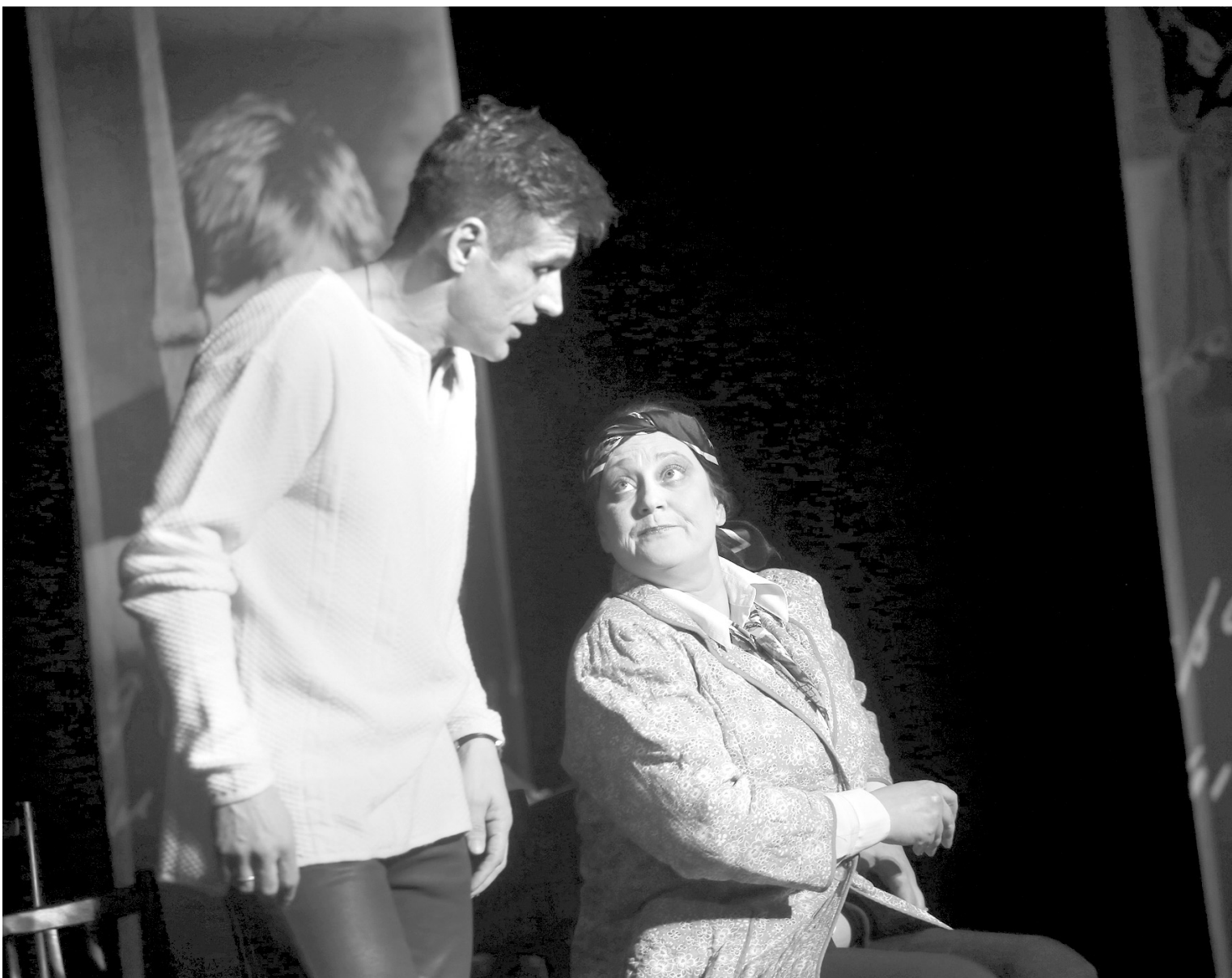
Сюжет лишен биографических подробностей – они здесь лишние

шала Жукова, а ведь большинство респондентов оказались молодые люди, родившиеся уже после смерти барда.