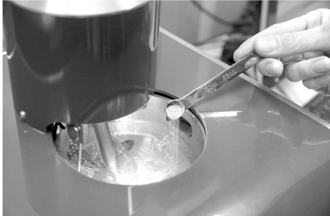
Здесь рождается продукция, востребованная нефтяниками, и авиаторами