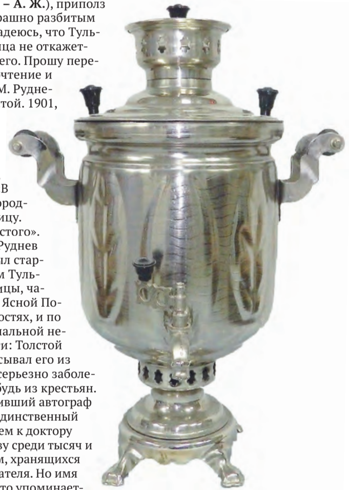
Тульский самовар 70–80-х годов, выпущенный на заводе «Штамп»