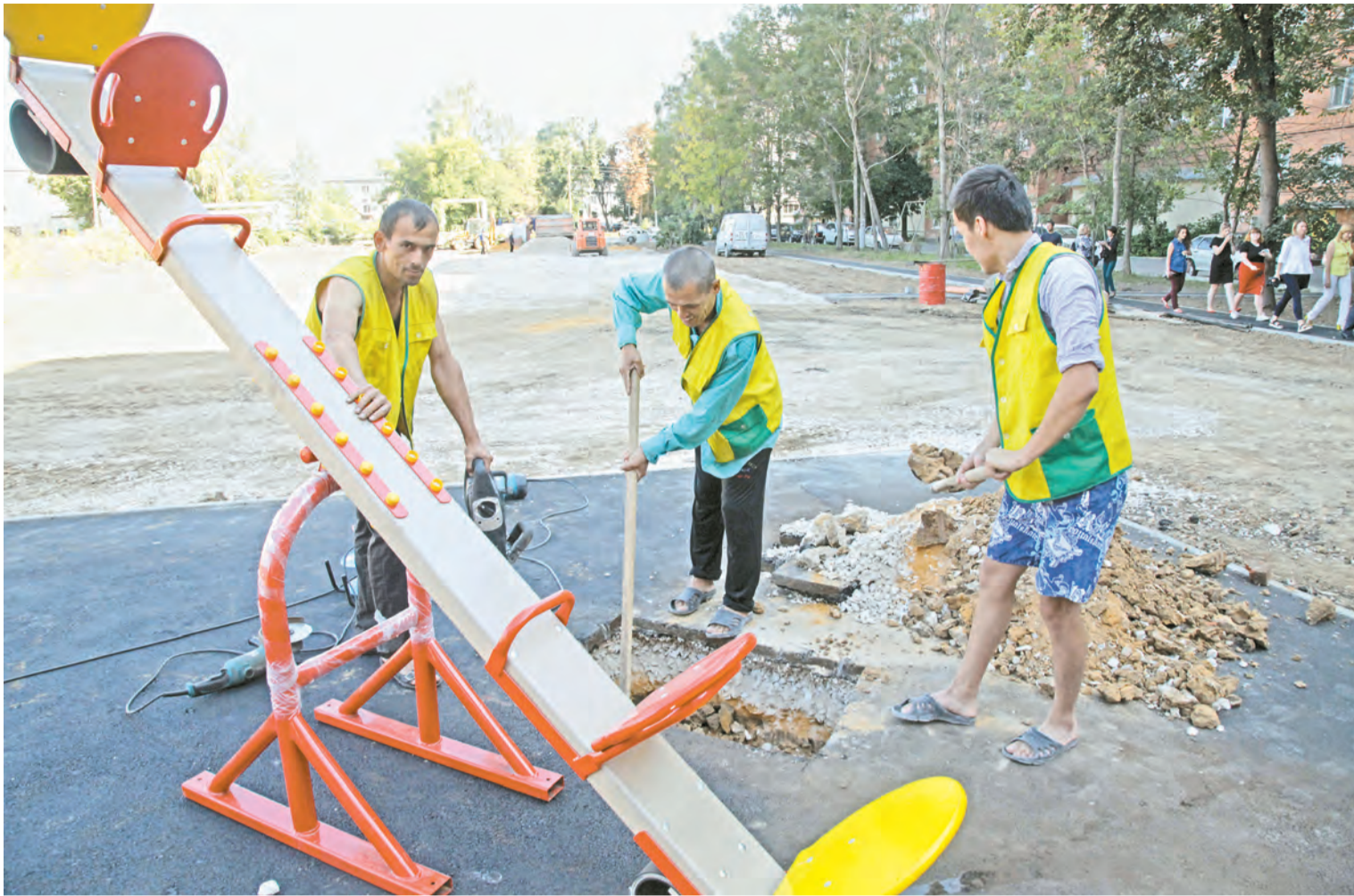
Новые качели наверняка порадуют маленьких жителей