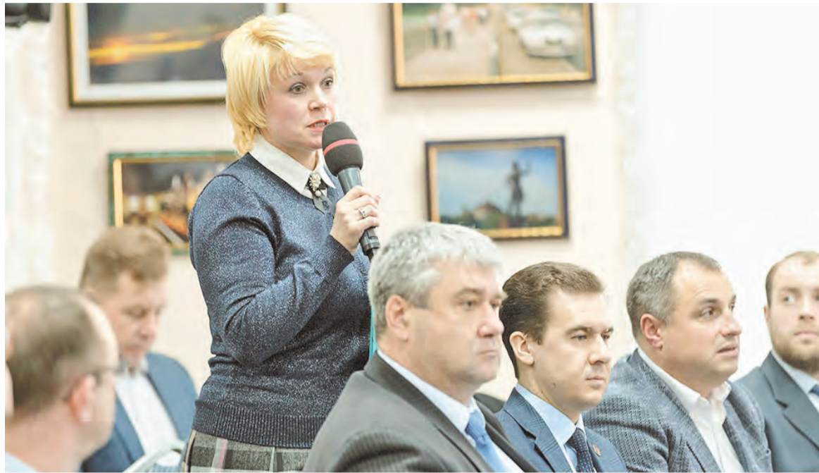
Общественники выходят со своими инициативами, направленными на повышение эффективности работы органов власти

Свои предложения по профильному нацпроекту формиру-