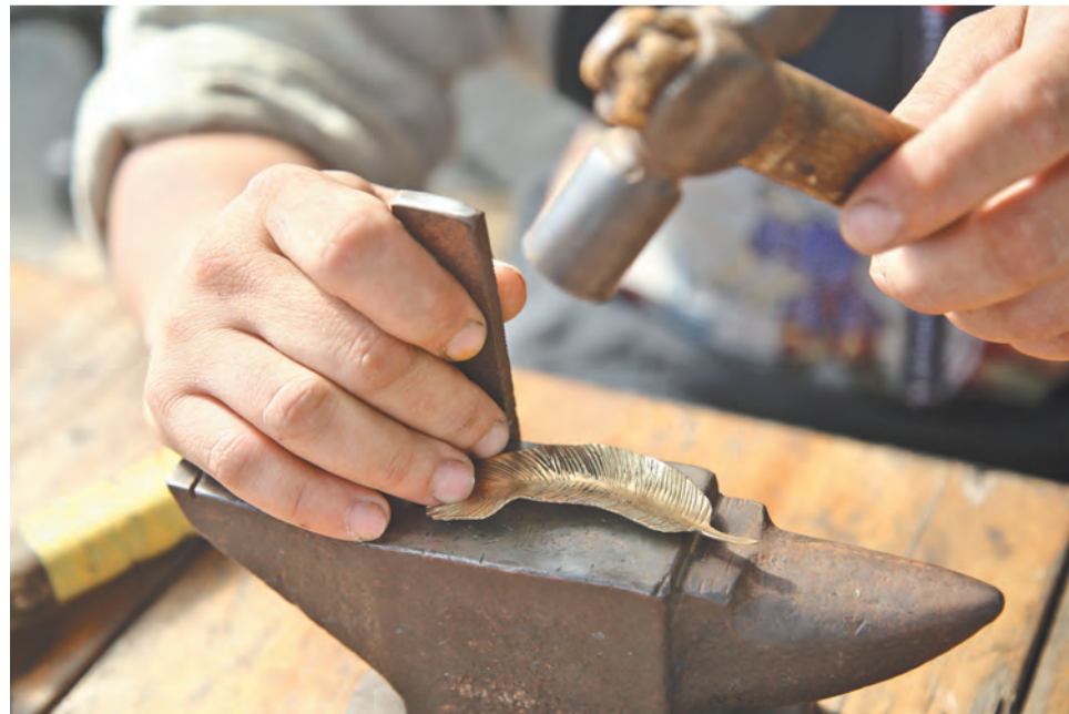
Работа чеканщика требует внимания, сосредоточенности и – души

Этот опыт надо передавать другим, мы считаем, что необходимо рассказы-