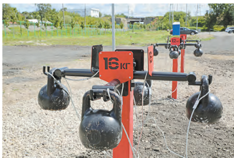
Площадка для кроссфита построена по многочисленным просьбам туляков