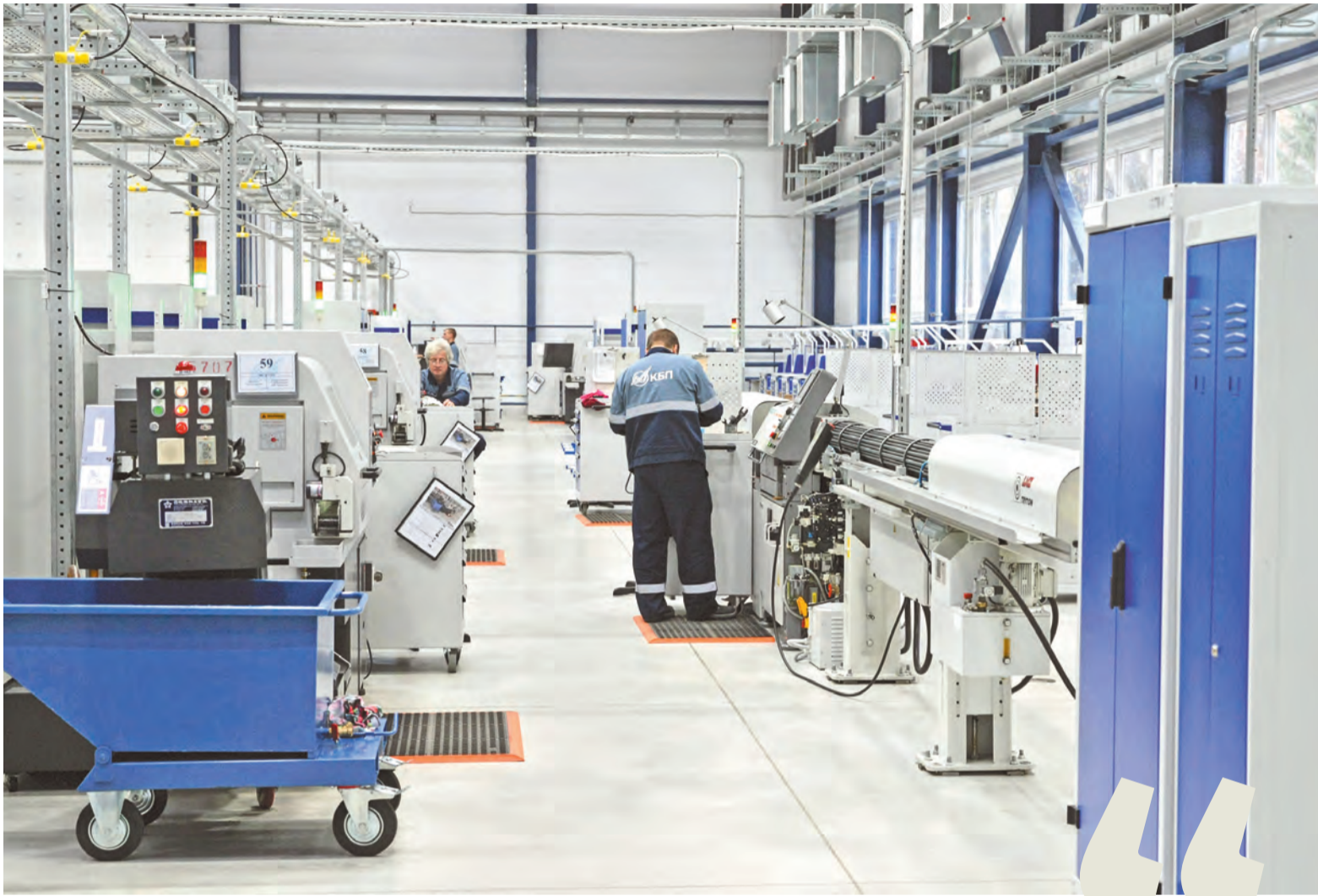
Наставник заинтересован в скорейшем вовлечении стажеров в производственные и тематические процессы на предприятии