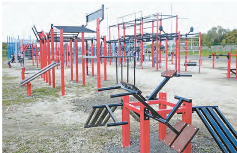
Оборудование для кроссфита рассчитано на взрослых спортсменов

мечу, что занятия эти будут проводиться бесплатно. Здесь смогут заниматься до пятидесяти человек в час, и мы планируем мониторить ситуацию, чтобы сделать выводы о целесообразности установки подобных спортивных объектов в других районах Тулы.