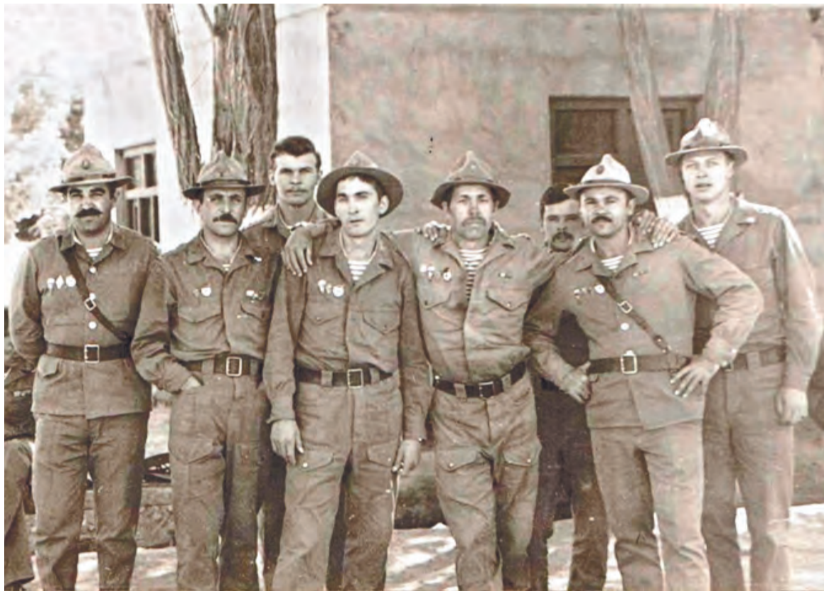
Около четырех тысяч туляков прошли Афганскую войну

В 1979 году СССР ввел войска в Афганистан, под Тулой погиб известный тележурналист, а по всей стране жаловались на дефицит самоваров.