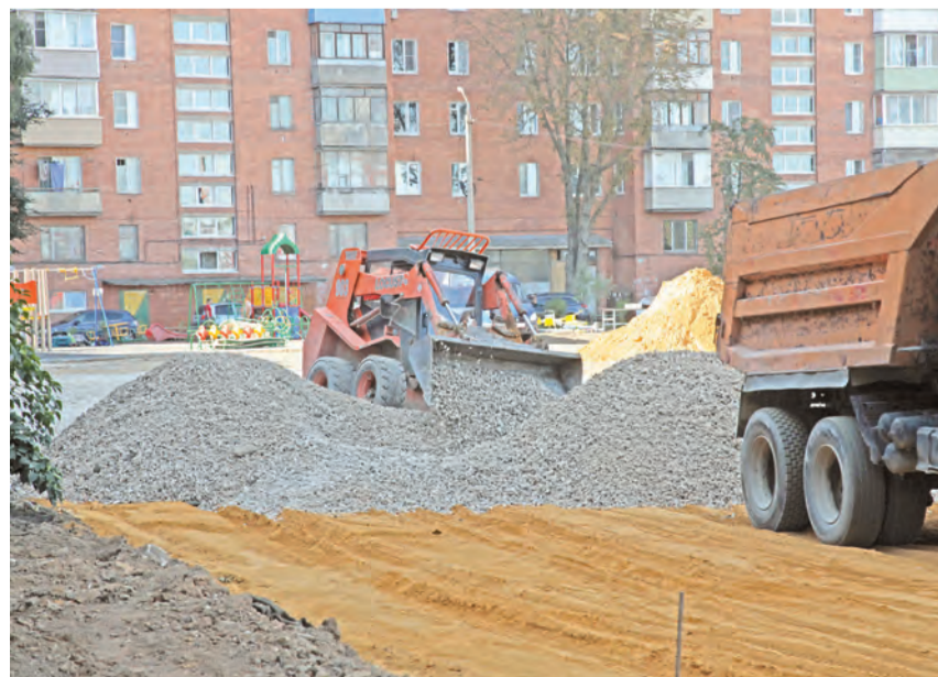
В центре обустраивают парковку площадью 1800 квадратных метров

На пустыре, что недалеко от дома, скоро начнется строительство детского сада. Сейчас здесь подводят коммуникации. После того как межевание территории под детский садик было завершено, осталось большое пространство в центре двора. Жители почти год добивались, чтобы его присоединили к дому и здесь поя-