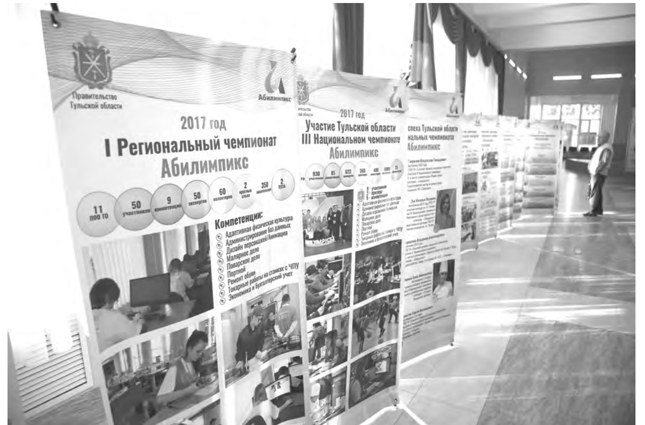
Выставка в холле ДК «Туламашзавода» рассказывает об истории чемпионата в нашем регионе