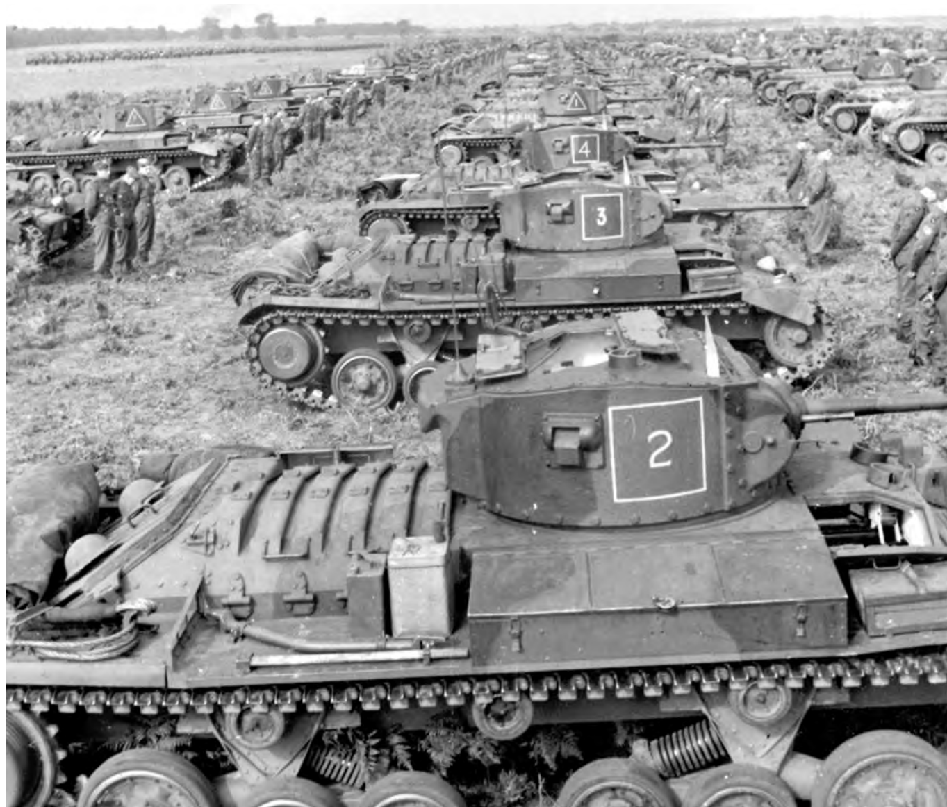
Так выглядели танки «Валентайн» – один из них и сейчас может лежать в водоеме недалеко от Тулы