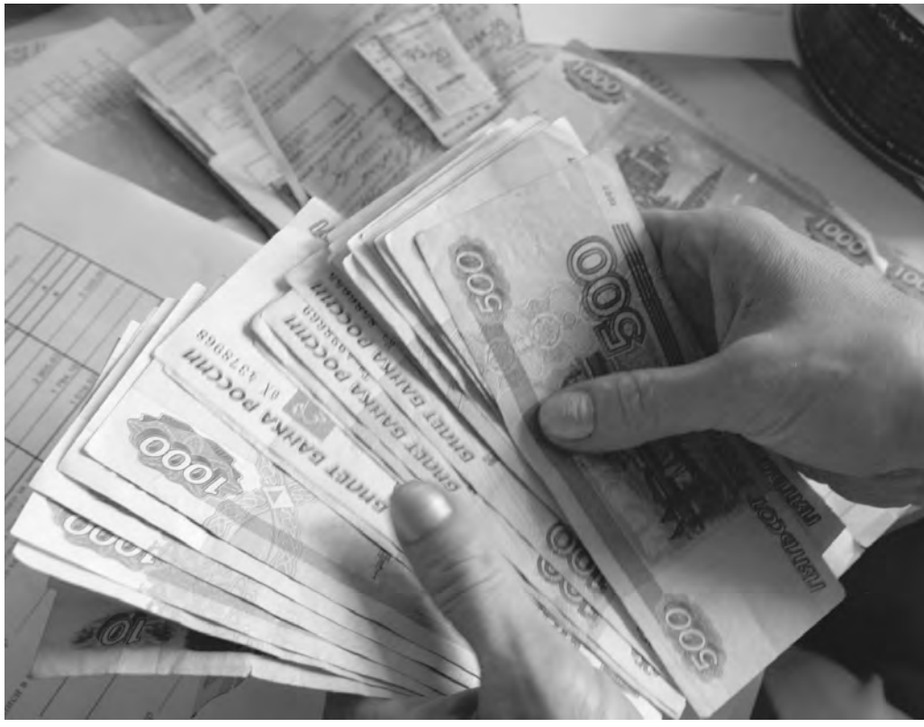
Погашение долгов по зарплате и выплата налоговых предприятиями – приоритетные вопросы для профильной комиссии областного правительства