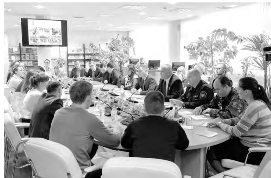
Докладчики поделились опытом реализации молодежной политики в Тульской области

В нашем регионе есть областной центр молодежи, ресурсный центр по развитию добровольчества, созданы общественный совет, военно-патриотическая «Юнармия», много лет работает молодежный парламент. А вот в Молдавии ситуация совсем иная: здесь отсутствует само понятие «молодежная политика». Об этом рассказали представители делегации страны, которые посетили Тулу для знакомства с опытом региона в сфере работы с молодежью.