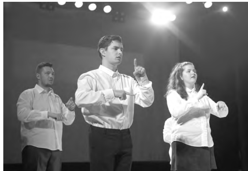
Понять друг друга всегда можно – было бы желание

А на базе Института повышения квалификации и профессиональной переподготовки работников образования Тульской области прошла Всероссийская научно-практическая конференция «Обеспечение доступности профессионального образования для инвалидов и лиц с ограниченными возможностями здоровья и профессионализм».