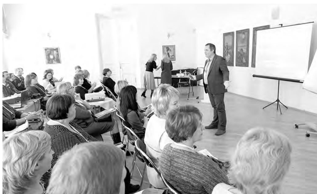
Сессии, мастер-классы и презентации проектов длились весь день