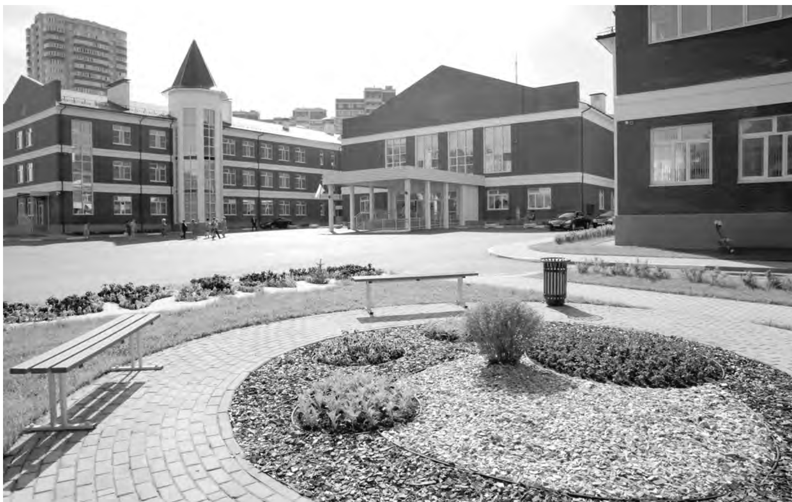
В Туле планируется возвести еще шесть детских садов и две школы

– Работы выполнены на 98 процентов. К концу подходит укладка гимнастического паркета в основном и разминочном залах. Благоустройство на прилегающей к спортивному сооружению территории также выполнено. Осталось