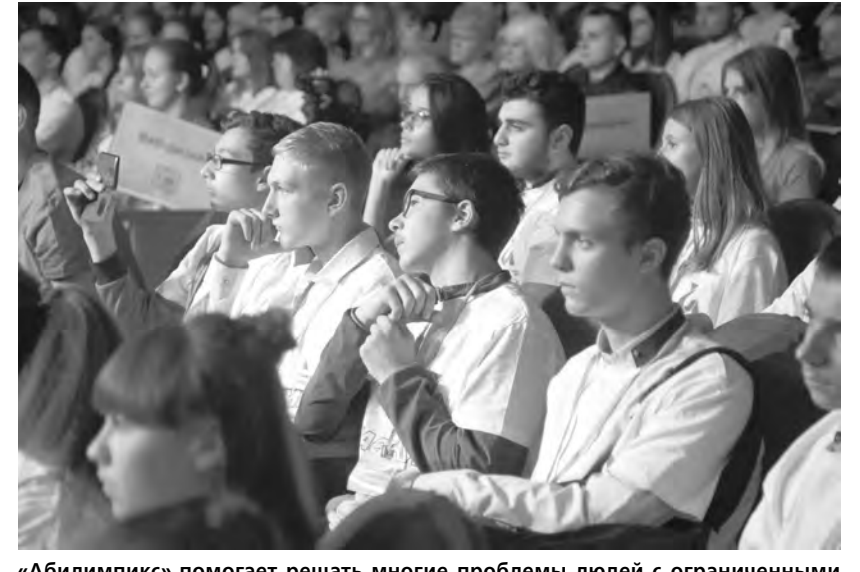
«Абилимпикс» помогает решать многие проблемы людей с ограниченными возможностями здоровья