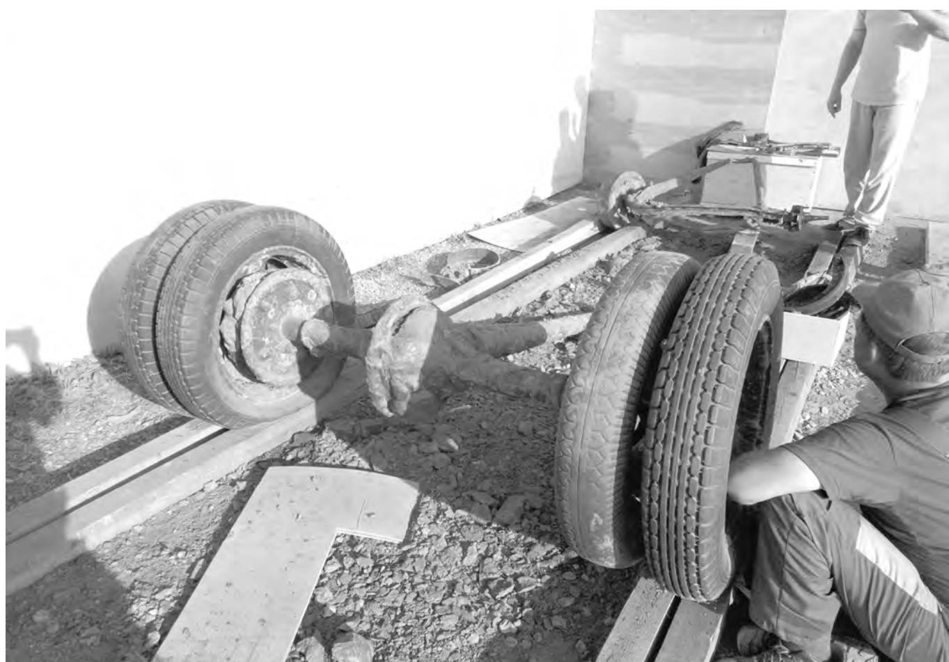
Найденную полуторку разобрали на части, чтобы отстранировать все детали

ющие гибель советской или германской техники в Шатском водохранилище во время Великой Отечественной войны. Трудимся много, но безрезультатно: большая заиленность.