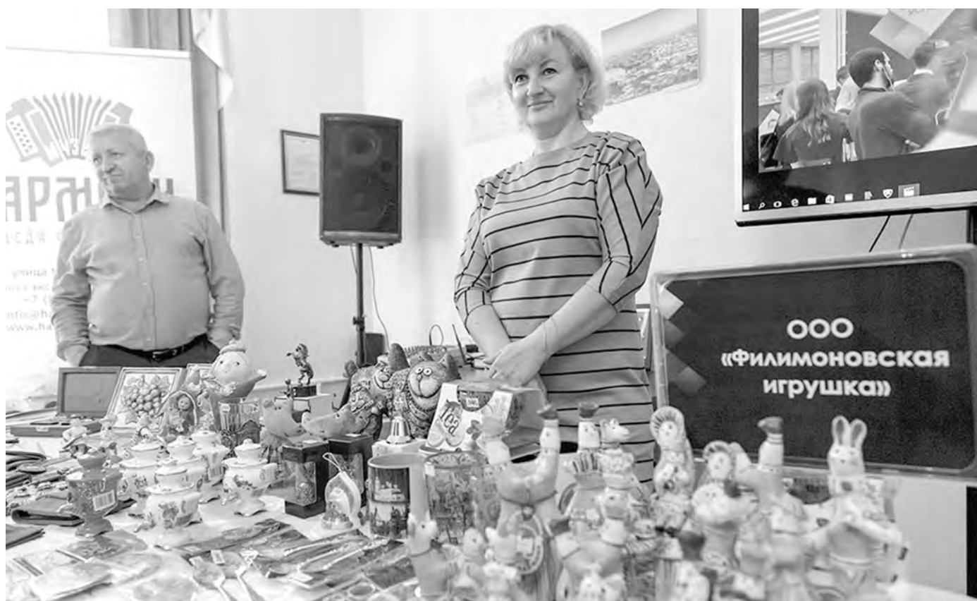
Одну из выставок посвятили предприятиям, которые выбрали традиционную для региона стезю