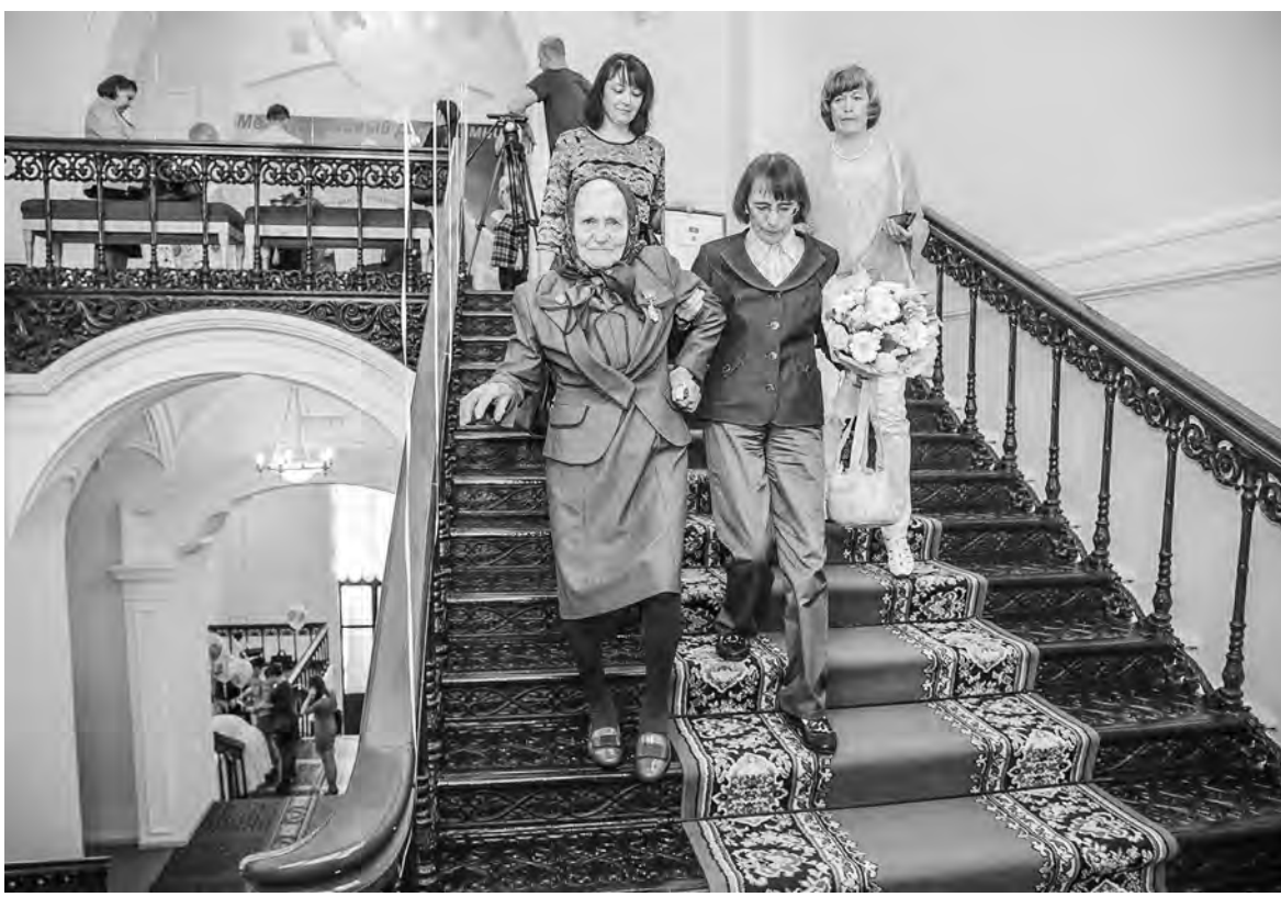
Награды удостоиваются как молодые мамы, так и почтенного возраста