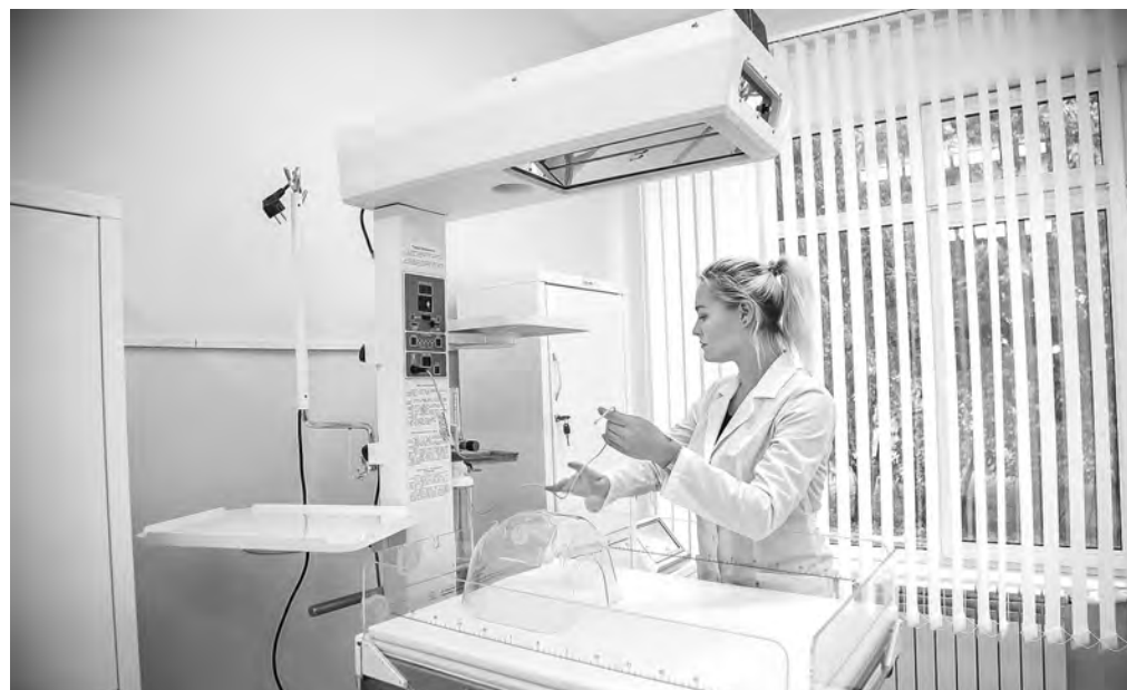
Сельские ФАПы оснащены самой современной медицинской аппаратурой