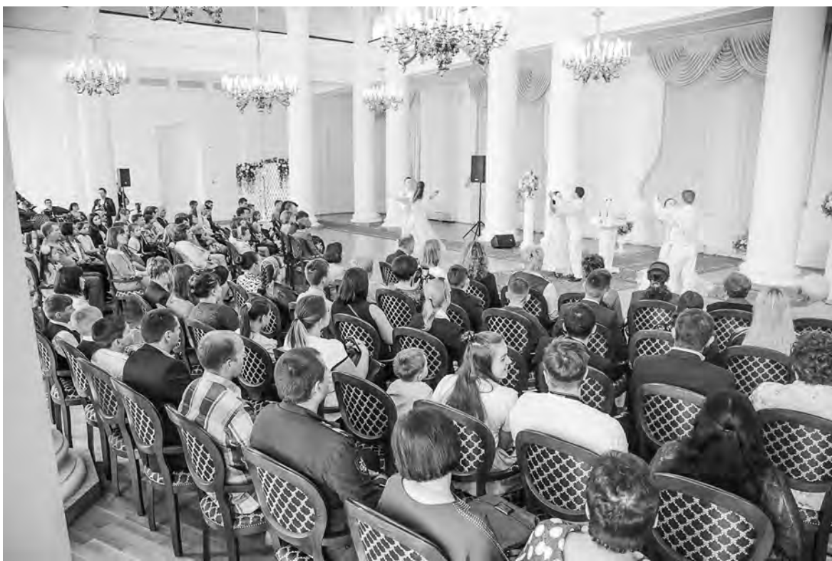
Награждение всегда проходит в торжественной обстановке и сопровождается концертом

Старший сын окончил авиационный техникум, он кандидат в мастера спорта по легкой атлетике и имеет второй разряд по боксу. А работает водителем автобуса. Второй сын – медбрат в операционном блоке Тульской областной клинической больницы. Дочь – студентка Рязанского медицинского университета, будет педиатром. Младшие дети пока школьники.