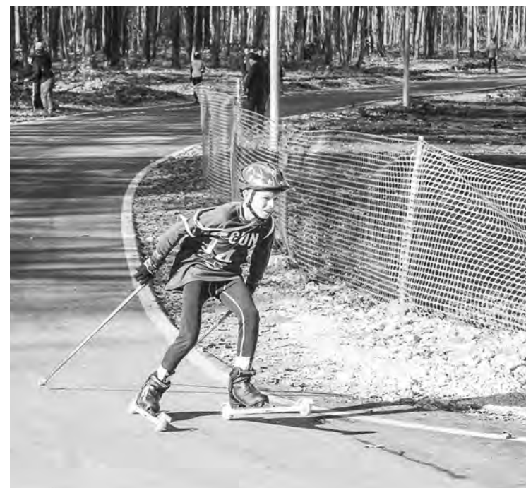
Здесь будут заниматься и профессионалы, и любители