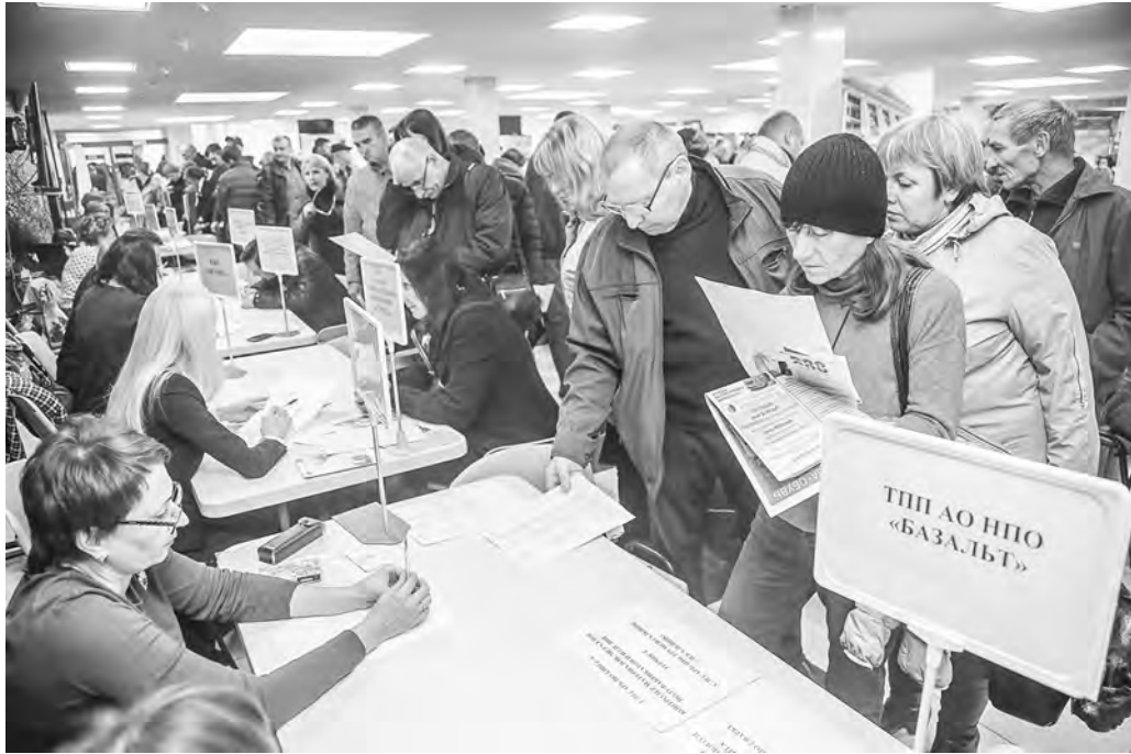
Крупные промышленные предприятия Тулы ищут специалистов

В АО «Тульский трикотаж» требуются опытные швеи. В социальном-реабилитационном центре для несовершеннолетних № 1 нужны повар с зарплатком