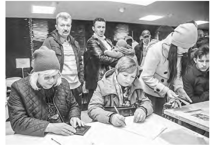
Многие тут же заполняли анкеты для приема на работу

Оборудовали здесь и специальный стенд для граждан предпенсионного возраста. Специалисты рассказывали всем желающим о возможностях переобучения, которое начнется в январе 2019 года, об изменении специального