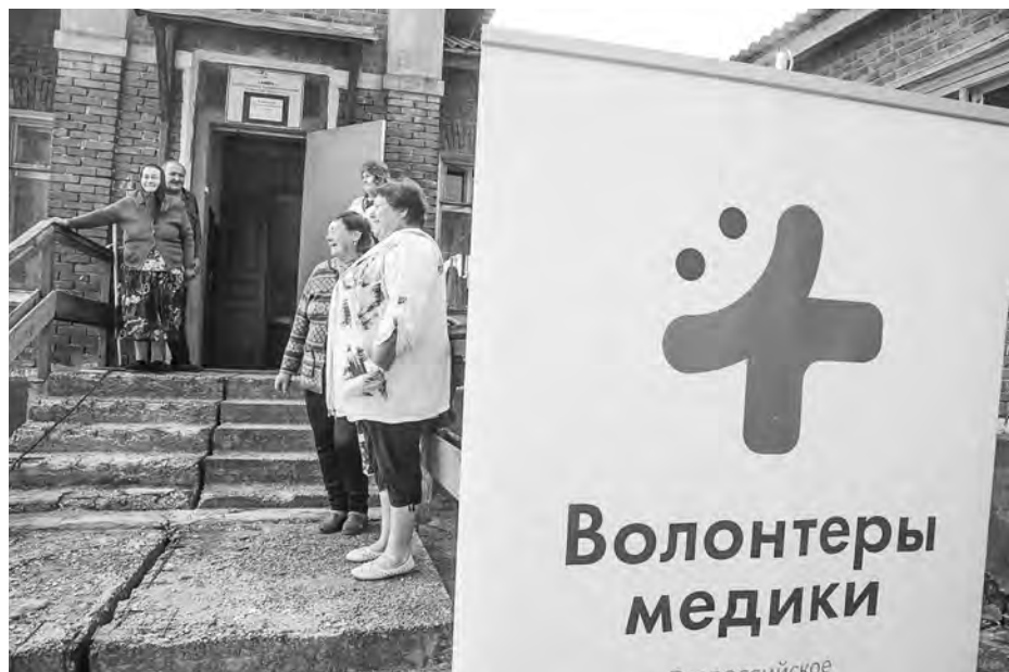
Пятнадцать волонтеров участвуют в акции «#ДоброВСело»