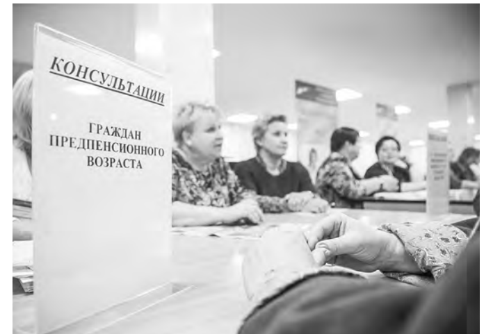
Граждане предпенсионного возраста могли узнать о своих перспективах и возможностях

стажа, дающего право на досрочную пенсию, об изменении условий досрочного выхода на пенсию, о гарантиях для граждан предпенсионного возраста.