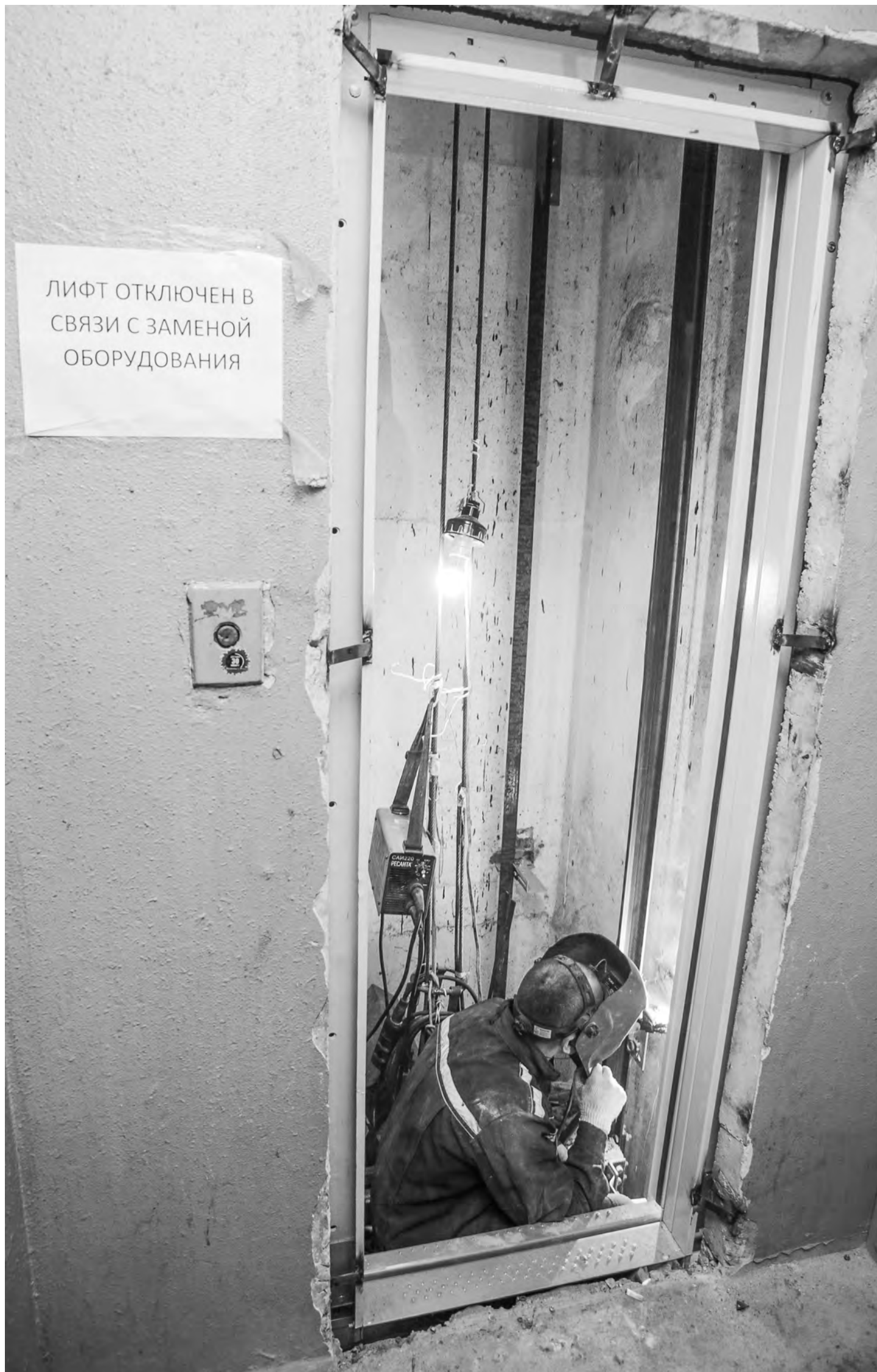
В этом году в Туле и Новомосковске заменят более сотни лифтов, отслуживших четверть века