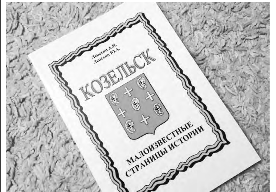
Книга Александра и Юрия Лепехиных издана в подмосковном Чехове тиражом 300 экземпляров