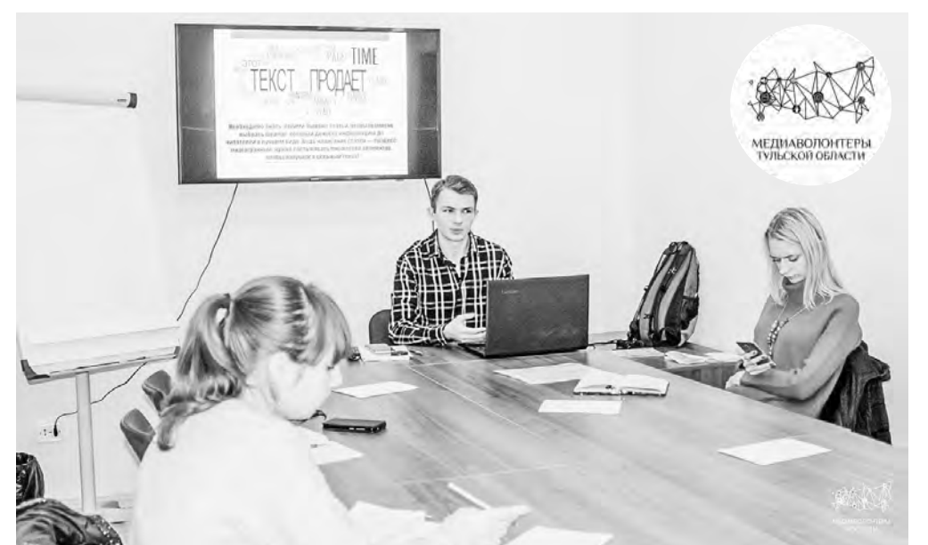
Медиаволонтеры стараются учиться каждую свободную минуту

входят в тульскую команду информационных добровольцев