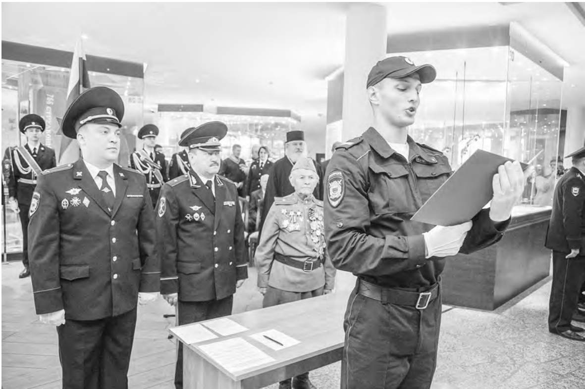
25 молодых сотрудников патрульно-постовой службы присягнули на верность закону