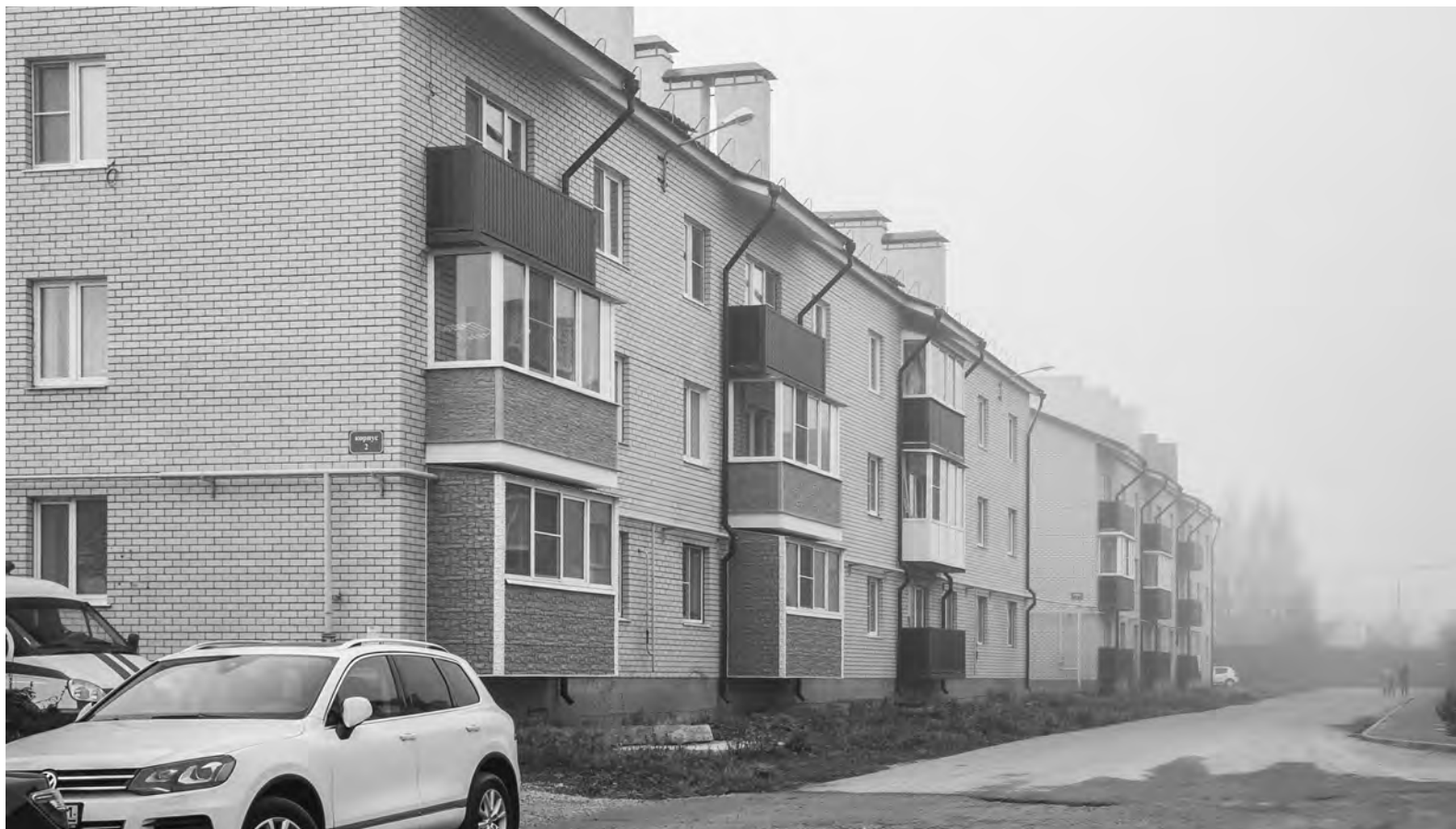
Из аварийного жилья туляки переезжают в современные новостройки

Ждем продолжения В минувшую среду хозяйка новой квартиры принимала гостей: тулячку навещал губернатор ре-