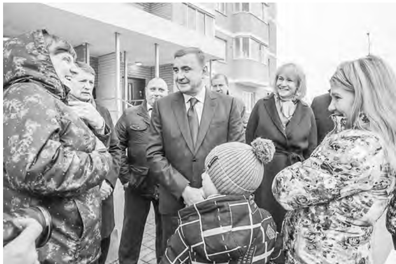
В ходе рабочей поездки Алексей Дюмин побывал в новом доме на улице Генерала Маргелова, где дают квартиры переселенцам из аварийного жилья

гиона Алексей Дюмин. Он осмотрел помещение, пообщался с жителями. И поделился хорошей новостью – на федеральном уровне принято решение продолжить программу переселения из аварийного жилья. А это значит, что у других тульских семей появится шанс получить благоустроенное жилье.