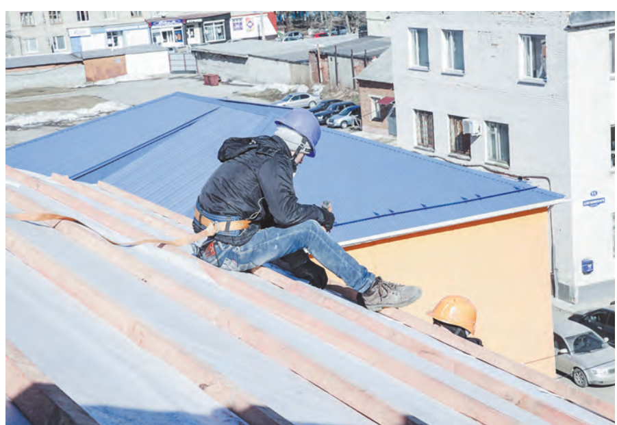
В Новомосковске благоустройство территорий, ремонт коммунальной инфраструктуры, строительство социальных объектов ведутся по различным программам

– Не надо быть специалистом в дорожной или строительной сфере, чтобы понять необходимость расторжения контракта, если подрядчик не выходит на работу. Это касается всех глав администраций, – отметил губернатор.