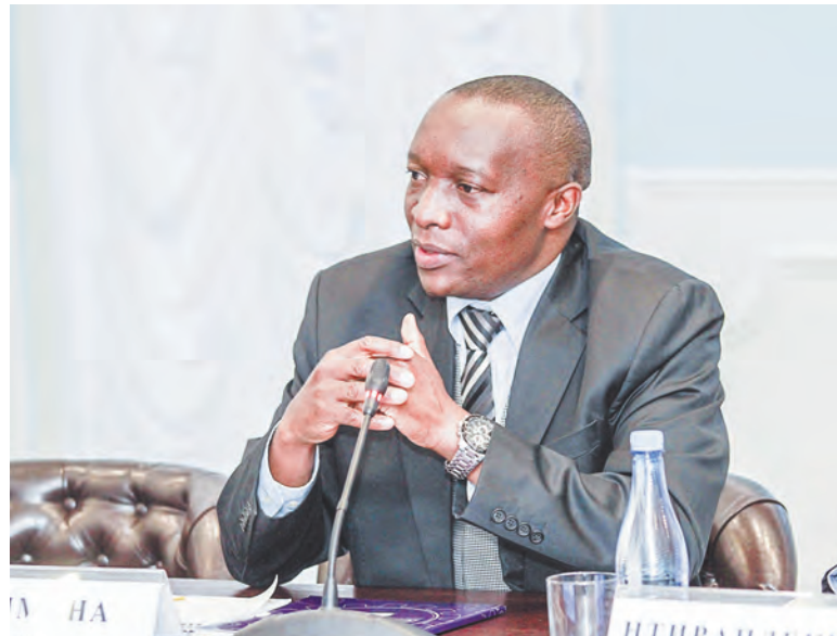
Эдуард Бизимана: мы посетили два тульских предприятия, сфера деятельности которых очень интересуют Бурунди

Григорий Лаврухин представил послу инвестиционный, промышленный, культурный, социальный потенциал Тульской области. Эдуард Бизимана, в свою очередь, отметил, что некоторые российские предприятия уже размещаются на территории Бурунди и их представители могут дать совет коллегам, как нужно работать в этой африканской стране. Так, Республика Бурунди наладила выгодные отношения с Республикой Мордовией. Соглашение о сотрудни-