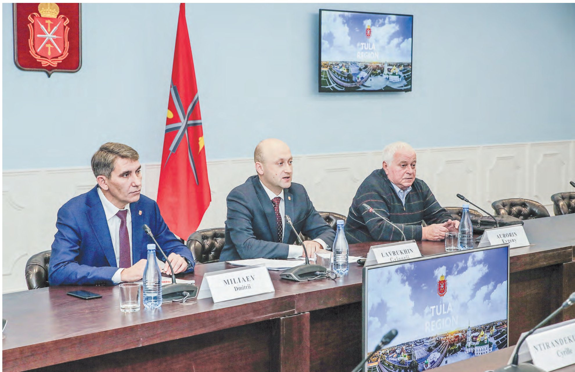
В ходе встречи с Чрезвычайным и Полномочным Послом Республики Бурунди в РФ тульская делегация представила богатый потенциал нашего региона