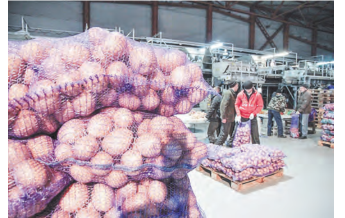
Продукция тульских сельхозтоваропроизводителей пользуется спросом и в других регионах, вот только порой приходится сталкиваться с трудностями при ее реализации

На встрече местных сельхозтоваропроизводителей и представителей торговых сетей, проходившей в Туле в рамках Всероссийского форума для предпринимателей «Территория бизнеса – территория жизни», речь шла о том, с какими трудностями сталкиваются аграрии при сбыте продукции, и о новых направлениях в работе сетевых магазинов.