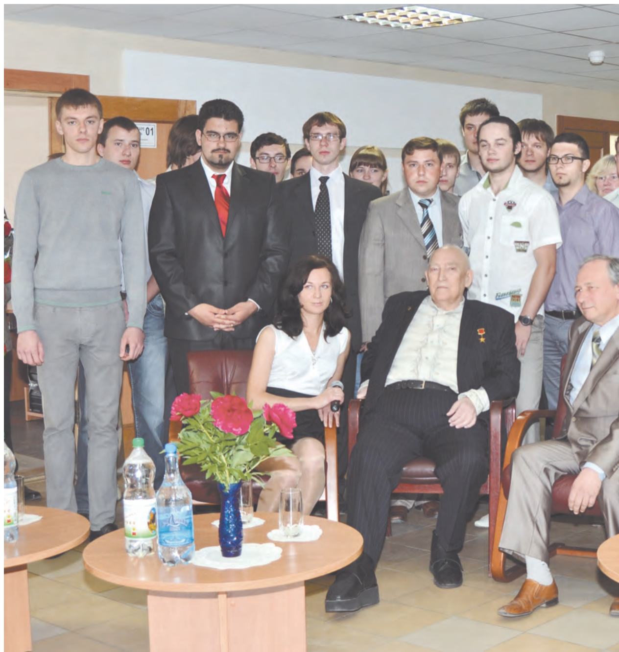
Студенты кафедры «Проектирование автоматизированных комплексов» – вместе с ее основателем, академиком Аркадием Шипуновым