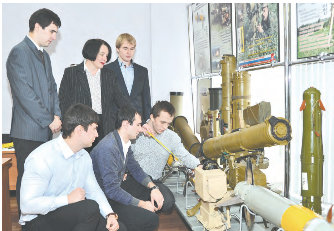
Учебный центр КБП позволяет сделать преподавание специальных дисциплин максимально приближенным к практике

Все названия курсовых и выпускных работ соответствуют реальной тематике предприятия. И это абсолютно правильно, поскольку в наше время в учебный процесс должны вписываться научные результаты. Выпускать просто специалистов с дипломами, которые не знают тематики предприятия, не соответствует задачам времени и нашей оборонной промышленности.