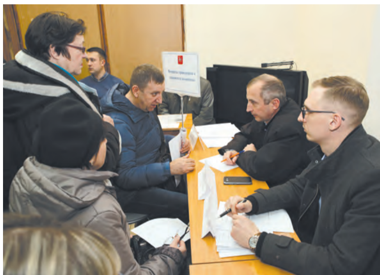
Перед началом встречи жители получали консультации специалистов

В ходе встречи с населением были отмечены наиболее активные жители территории, старшие по домам. Перед собравшимися