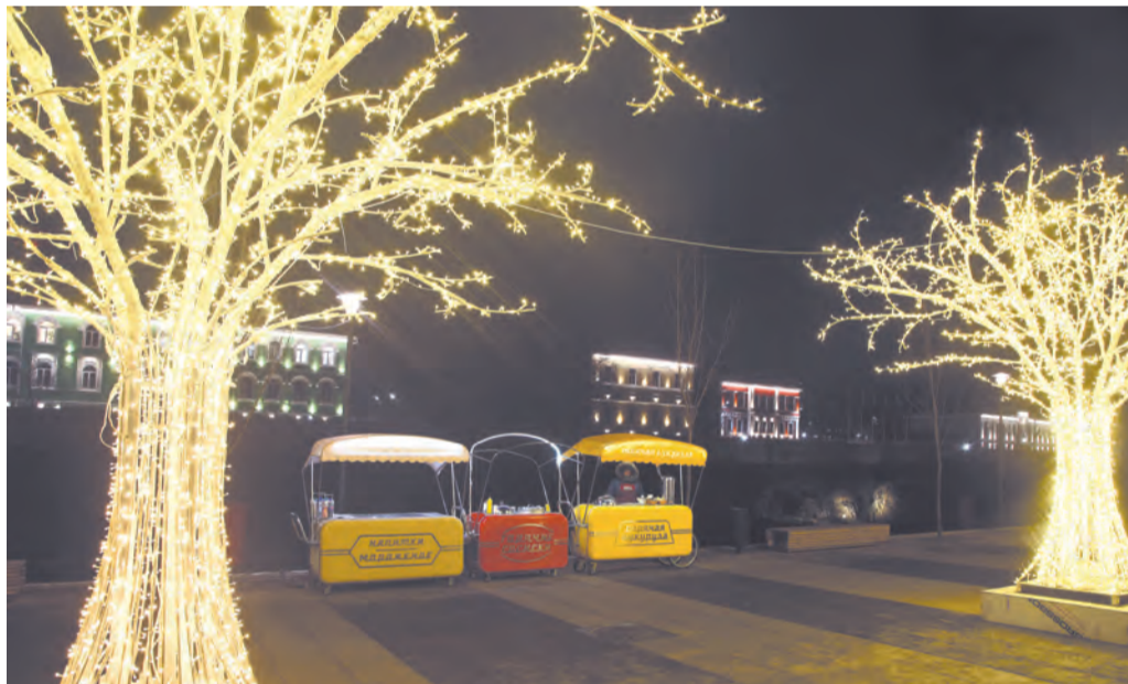
Волшебные светящиеся деревья «выросли» на улице Металлистов