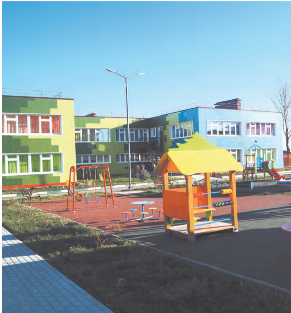
Развитие сферы образования – одна из важных статей финансирования. Этой осенью в Донском открыли новый детский сад

На данную сферу на три года предусмотрено 38,8 миллиарда рублей. Средства будут направлены на совершенствование мед-