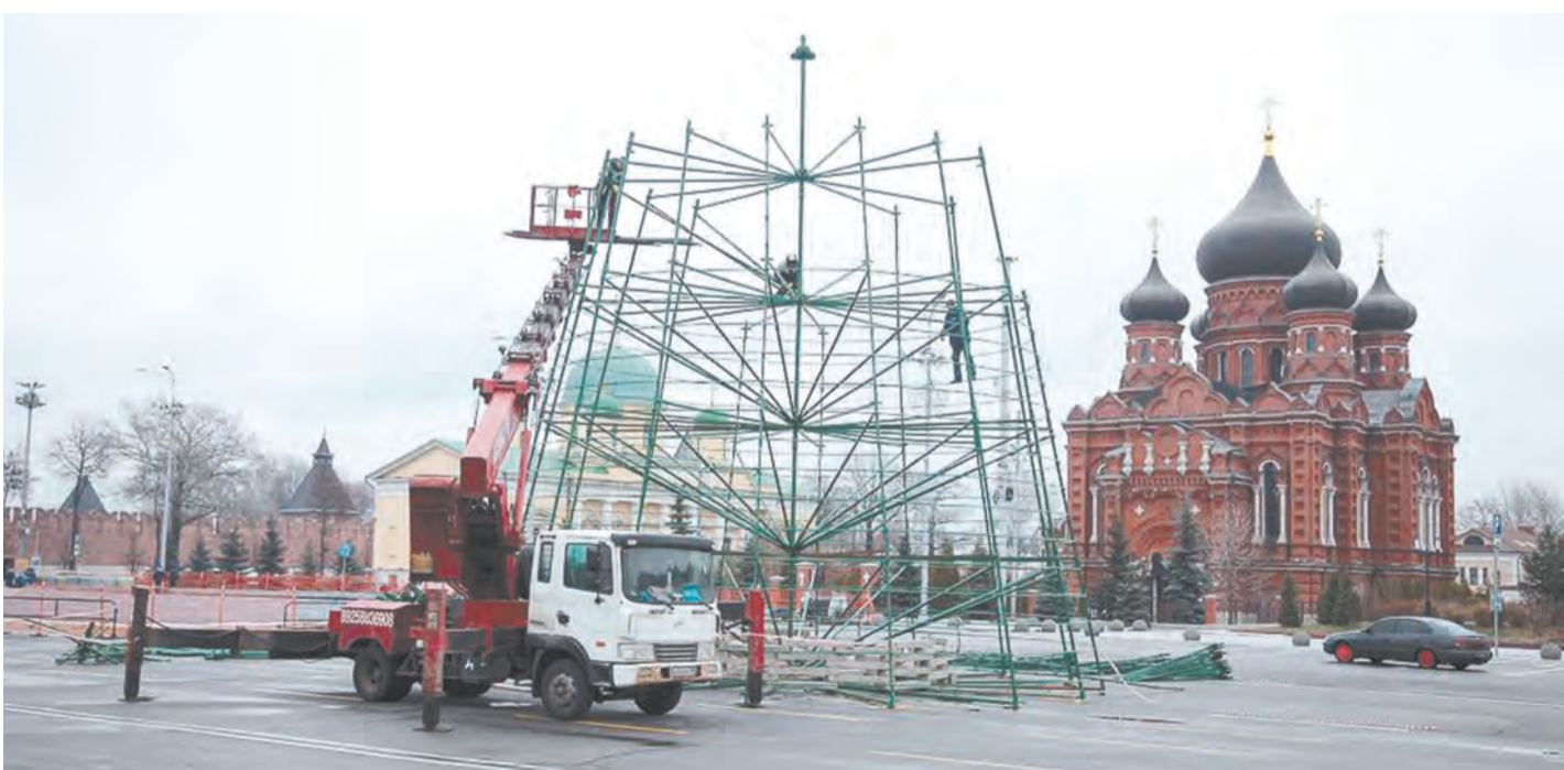
На площади Ленина начали монтировать главную елку города