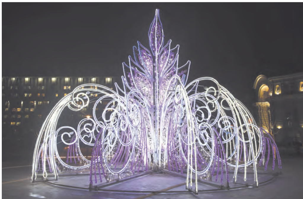
«Ледяной фонтан» на Крестовоздвиженской площади