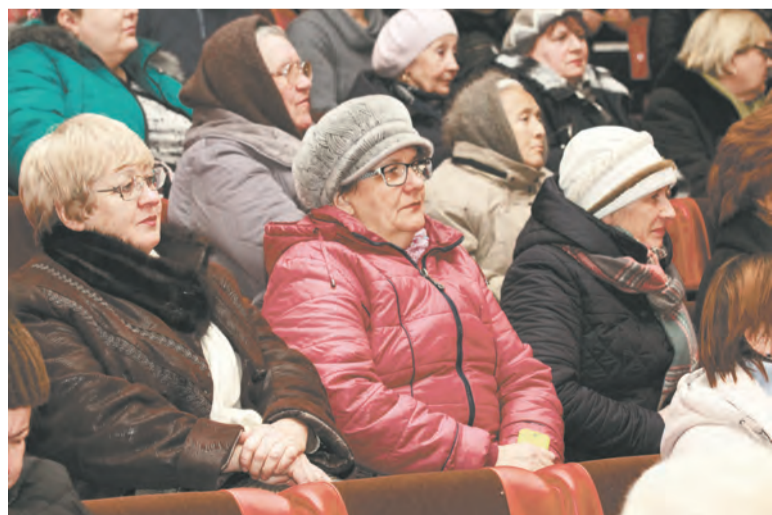
Жители знают, как эффективен прямой диалог с представителями власти

– Третий год Тульская область развивается по всенародно разработанной Программе социально-экономического развития. Как сказал губернатор Алексей Геннадьевич Дюмин, оглашая послание, наша общая цель – улучшение условий жизни граждан. Чтобы каждый житель вне зависимости от возраста мог полностью реализовать себя и быть востребованным на малой родине. Администрация Тулы и депутаты Тульской городской думы прилагают максимум усилий для решения различных вопросов. Появляются новые места отдыха, скверы, строятся детские сады и школы, идет благоустройство придомовых территорий, ремонт дорог и тротуаров. Как вы знаете, благодаря поддержке губернатора на развитие и благоустройство территорий Большой Тулы выделяются огромные средства, чего ранее не было. Это позволяет решать проблемы, копившиеся годами. Выражаю благодарность всем жителям территории Ленинский, старшим по домам, представителям ТОСов и общественникам за активную гражданскую позицию и неравнодушие, – в завершение встречи сказал градоначальник.