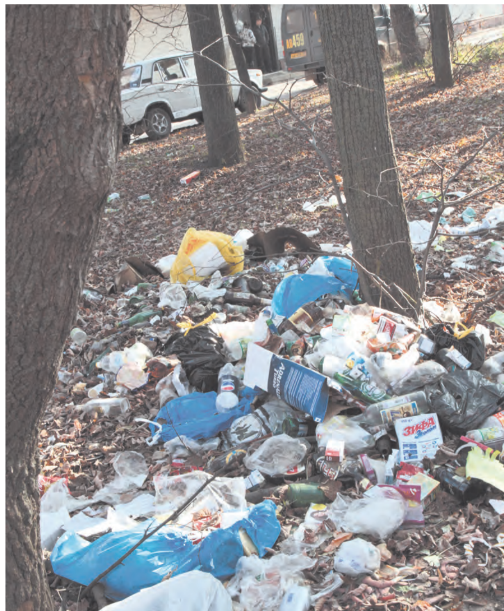
Несанкционированные свалки – одно из самых частых нарушений закона об охране окружающей среды

Наиболее важными являлись вопросы исполнения законодательства в сфере использования и охраны водных объектов, атмосферного воздуха, обеспечения сохранности объектов животного мира, водных биоресурсов, безопасного обращения с промышленными и бытовыми отходами, возмещения ущерба.