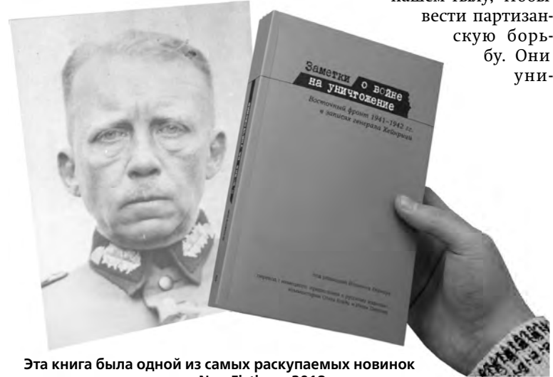
Эта книга была одной из самых раскупаемых новинок на ярмарке Non Fiction – 2018

нашем тылу, чтобы вести партизанскую борьбу. Они уни-