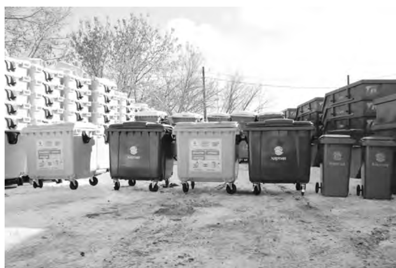
В Туле установят 500 контейнеров для раздельного сбора мусора

К примеру, есть такие требования, как обязательная дезинфекционная обработка контейнеров и мусоровозов; вывоз ТКО с мест накопления в летний период не реже раза в день; крупногабаритных отходов – не реже одно-