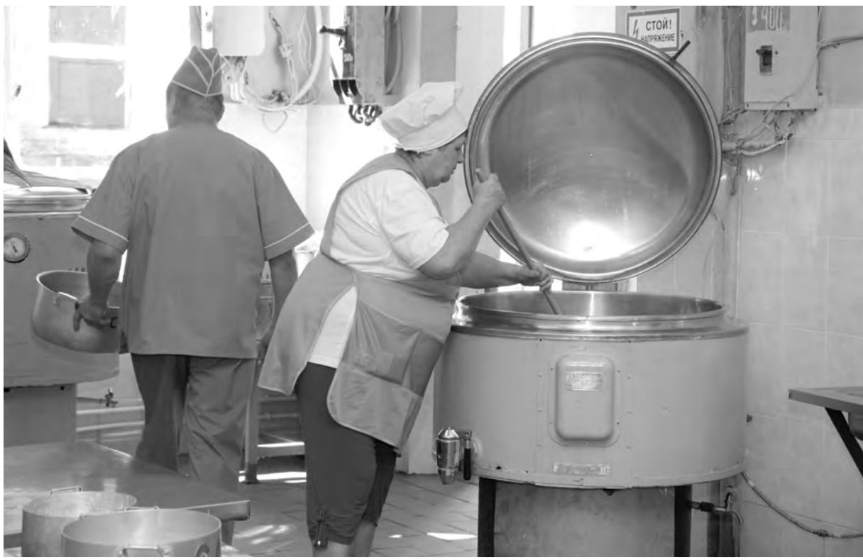
Безопасность в лагере начинается с кухни