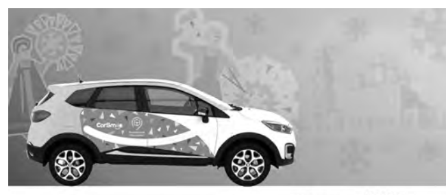
Каршеринг – это поминутный прокат автомобилей. Он уже зарекомендовал себя во многих зарубежных и российских городах