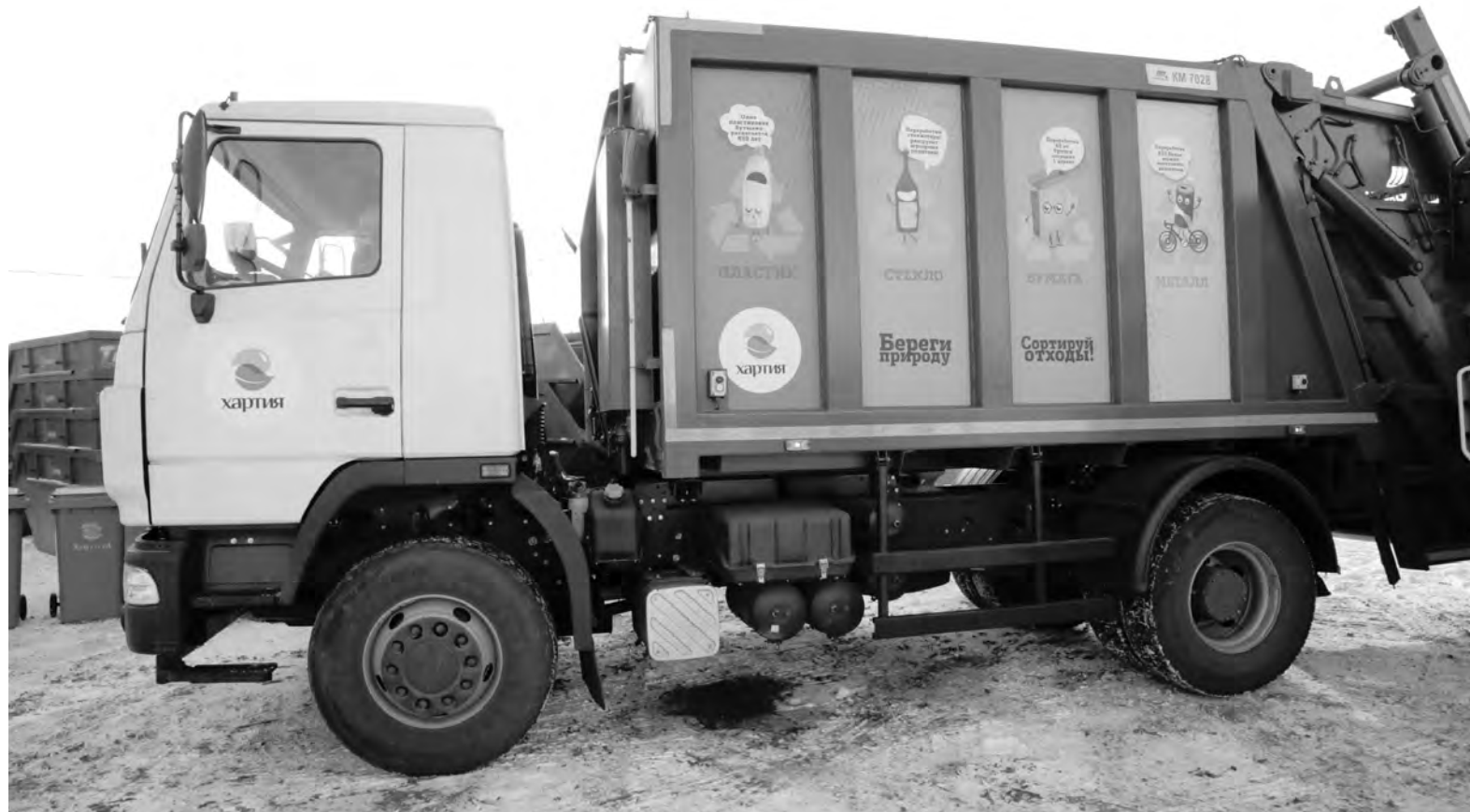
Из запланированных 72 единиц техники уже закуплено 24 мусоровоза

До недавнего времени порядок обращения с ТКО не было. Так обстояли дела не только в нашей области: мусороперевозчиков было много, работали они либо по рыночной цене, либо по ставке, установленной муниципалитетом. Деятельность по сбору и транспортировке мусора не подлежала государственному регулированию, власти устанавливали тарифы только на захоронение отходов. Отсутствие единой системы регулирования зачастую приводило к возникновению несанкционированных свалок и