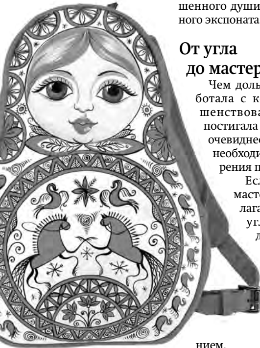
Рюкзак-матрешка из натуральной кожи с мезенской росписью