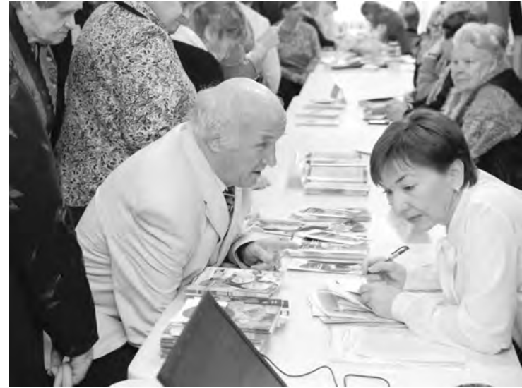
В фойе можно было получить консультации специалистов по разным вопросам

Тут же работали консультационные пункты, где можно было найти ответы на вопросы у специалистов социальной защиты, центра занятости и Пенсионного фонда.