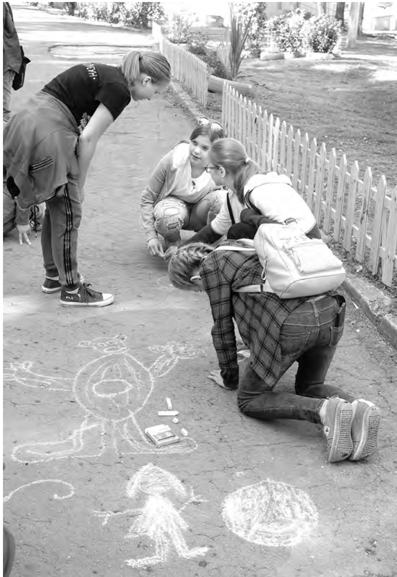
Отдых у каждого свой

В разговоре о заинтересованности местных властей в оздоровлении школьников особо отмечалось, что в лагерях и здравницах в этом году отдохнули более 95 процентов ребят из Плавского,