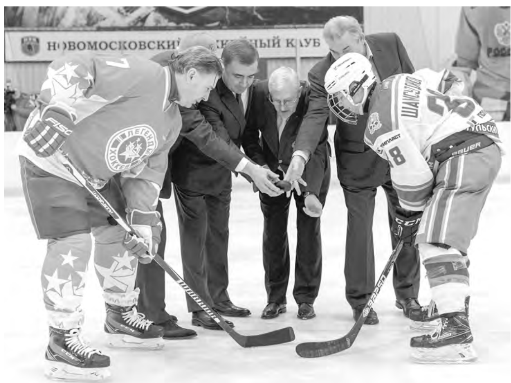
Символическое первое бросание шайбы в матче между НХК и сборной легенд отечественного хоккея