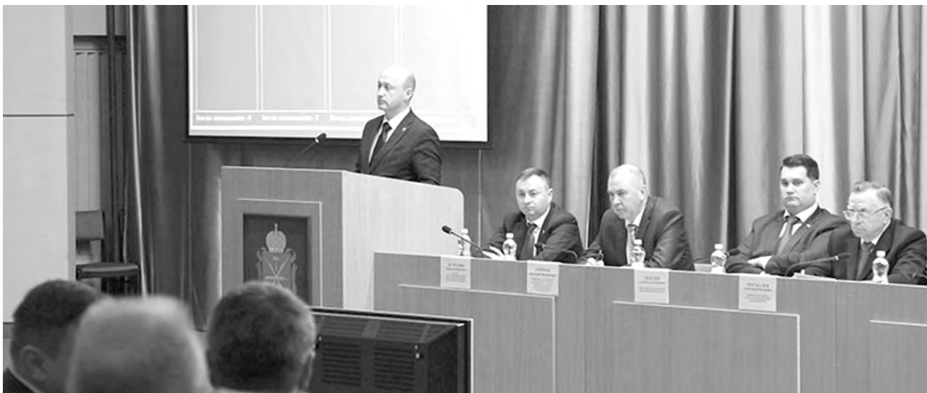
На очередном заседании депутаты рассмотрели 45 вопросов, приняли 12 региональных законов

Доходы бюджета увеличатся на 6,7 процента. Темп их роста значительно превышает темп роста расходов, который составляет 2,6 процента. Дефицит, указанный во втором уточнении, на 60 с лишним процентов ниже ранее утвержденного. Заметно снижается также предельный объем государственного долга области, – рассказал министр финансов Тульской области Владимир Юдин, представляя депутатам основные параметры региональной казны на текущий год. – Поступления средств из федерального бюджета в текущем году увеличены на 919,2 миллиона рублей. 550 миллионов со-