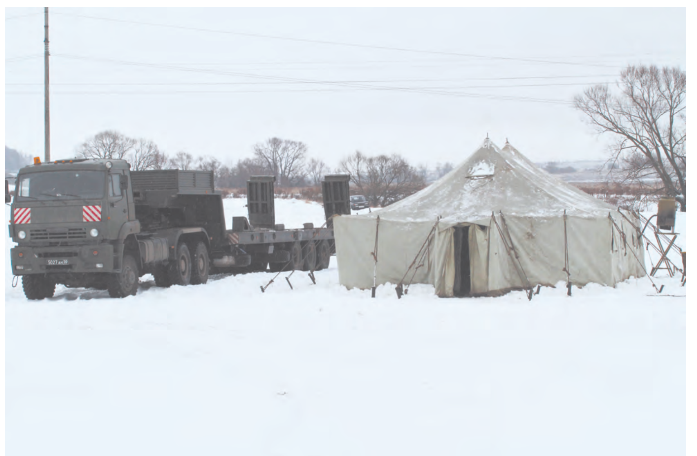
Так выглядит палаточный лагерь 462-го отдельного мостового батальона