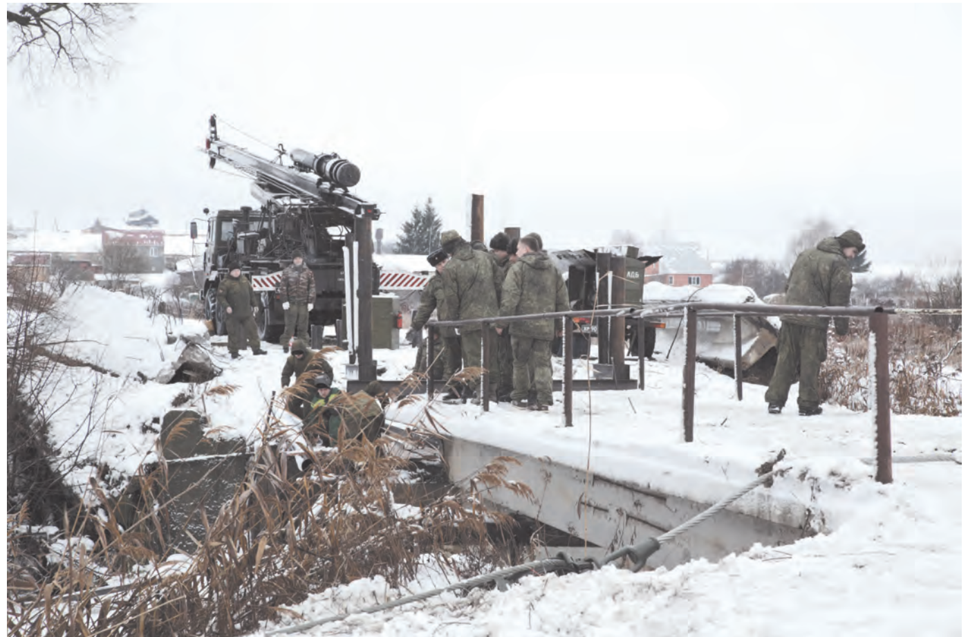
Новый мост через Шиворонь должны смонтировать до 20 декабря