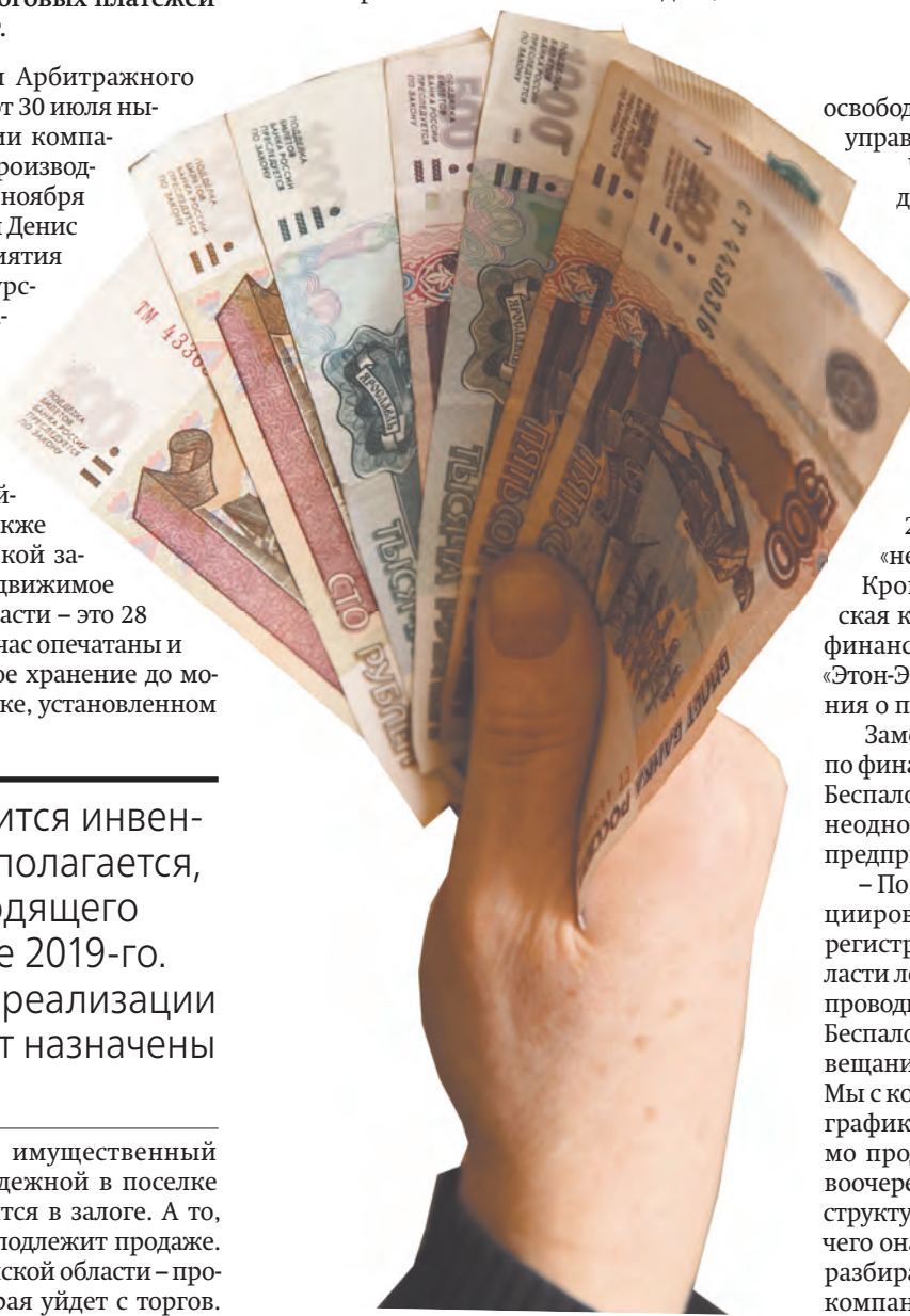
После реализации имущества работники смогут увидеть долгожданные деньги