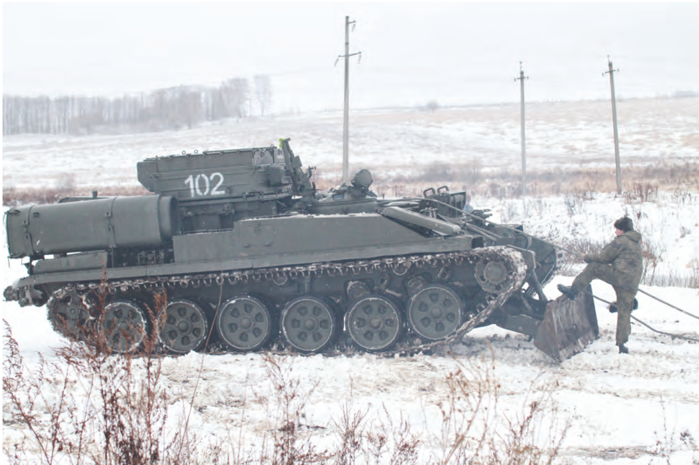
Нечасто в Тульской области можно наблюдать, как работает бронированная ремонтно-эвакуационная машина