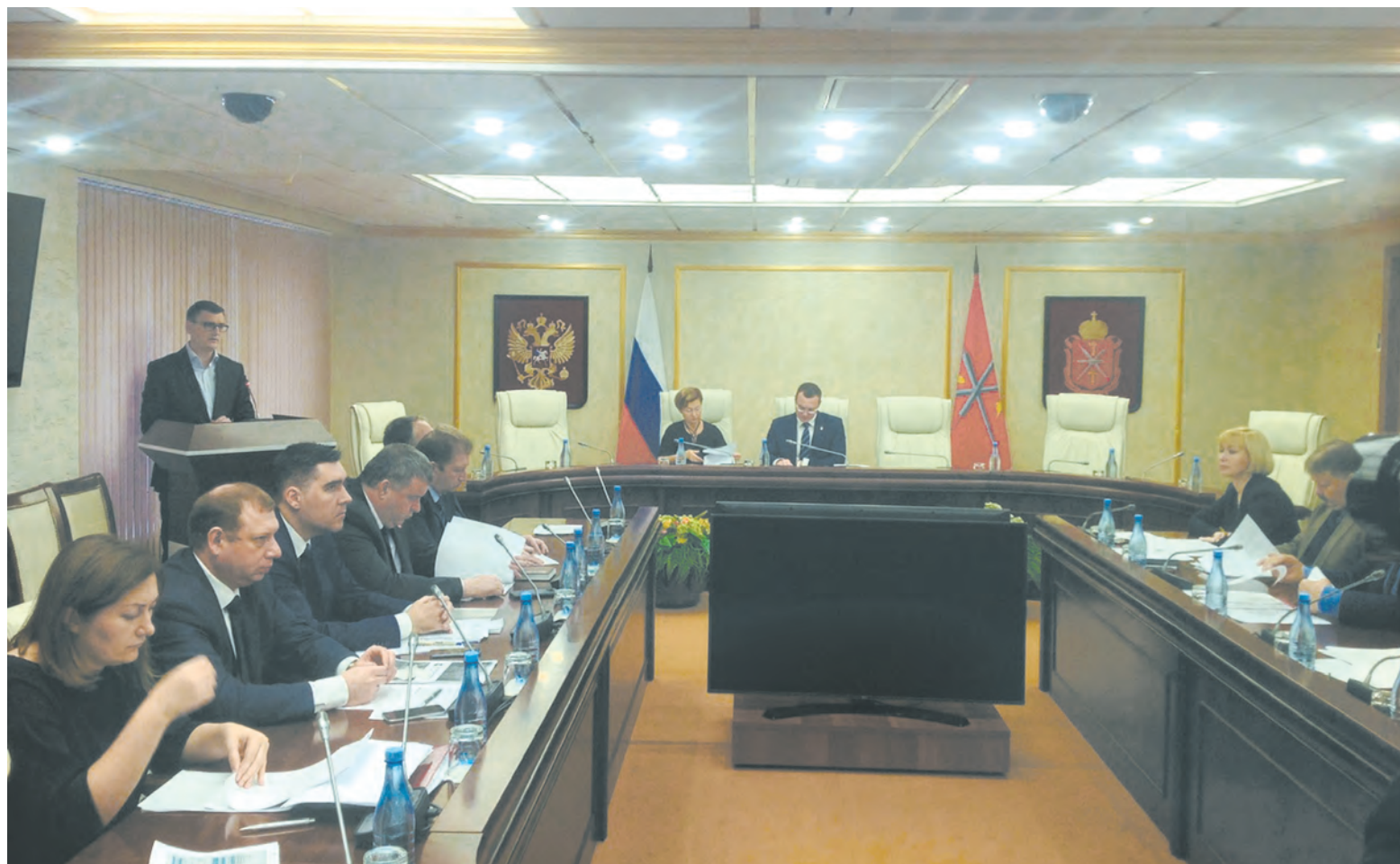
На заседании комиссии обсуждались различные пути погашения долгов по зарплате перед работниками АО «Этон-Энергетик»