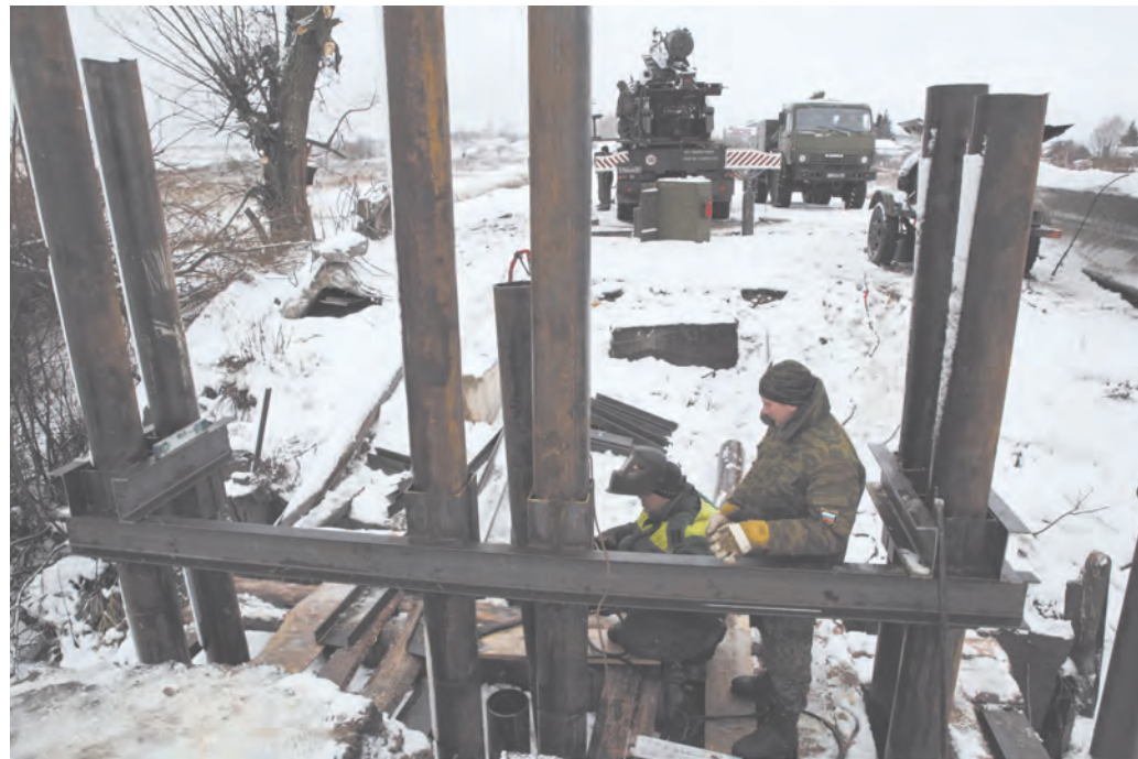
За работу берутся военные мостовики-сварщики

леемся. На объекте работают два десятка военнослужащих: и контрактники, и те, кто ушел в армию по призыву. Все призваны в батальон из разных регионов. Трудимся по графику, утвержденному заместителем командующего войсками Западного военного округа по материально-техническому обеспечению. До 20 декабря должны смонтировать новый мост.