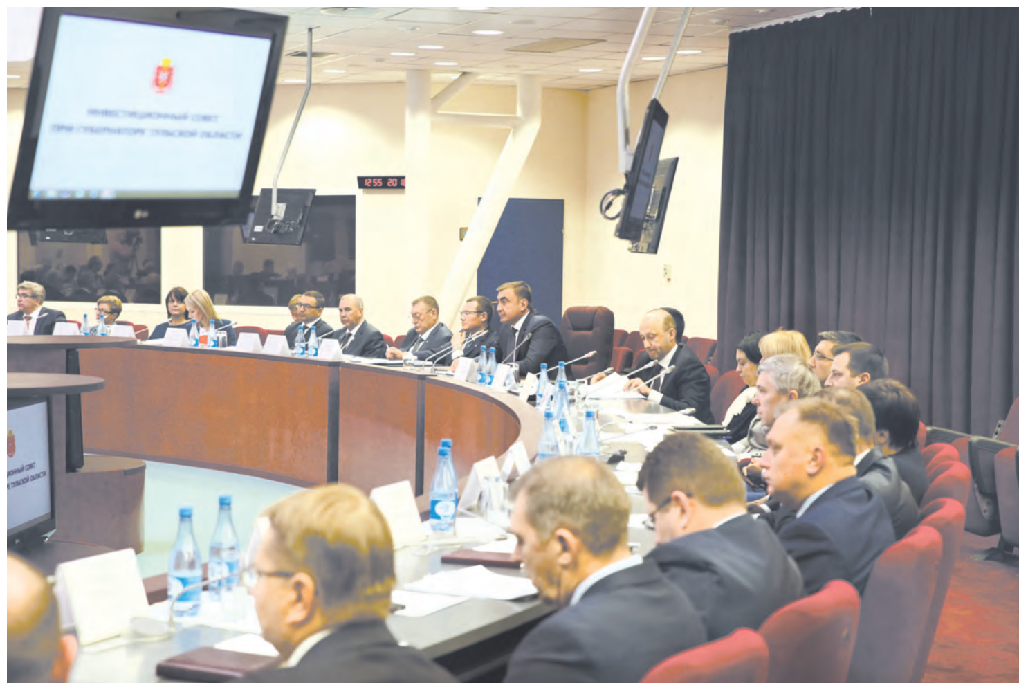
Алексей Дюмин отметил, что создание качественного кадрового потенциала невозможно без оказания поддержки подрастающему поколению

Алексей Дюмин подчеркнул, что лидирующие позиции региона в федеральном рейтинге дают дополнительную мотивацию продолжать работать на высоком уровне, но призвал не останавливаться на достигнутом. В ходе заседания он поручил министерству имущественных и земельных отношений, министерству строительства и ЖКХ, комитету по предпринимательству и потребителю рынка организовать выполнение мероприятий по целевым моделям.