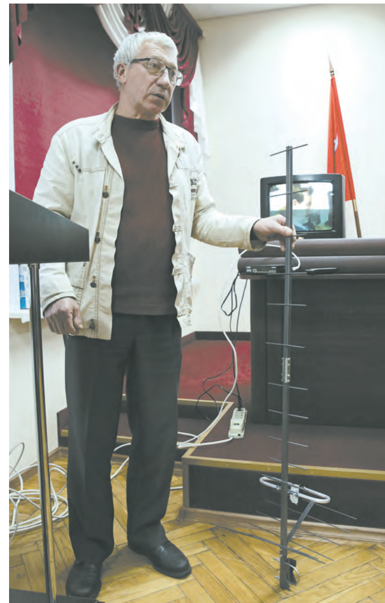
Приемные антенны бывают двух видов – комнатные и наружные (как на фото)

Если в доме больше одной цифровой приставки, то жела-