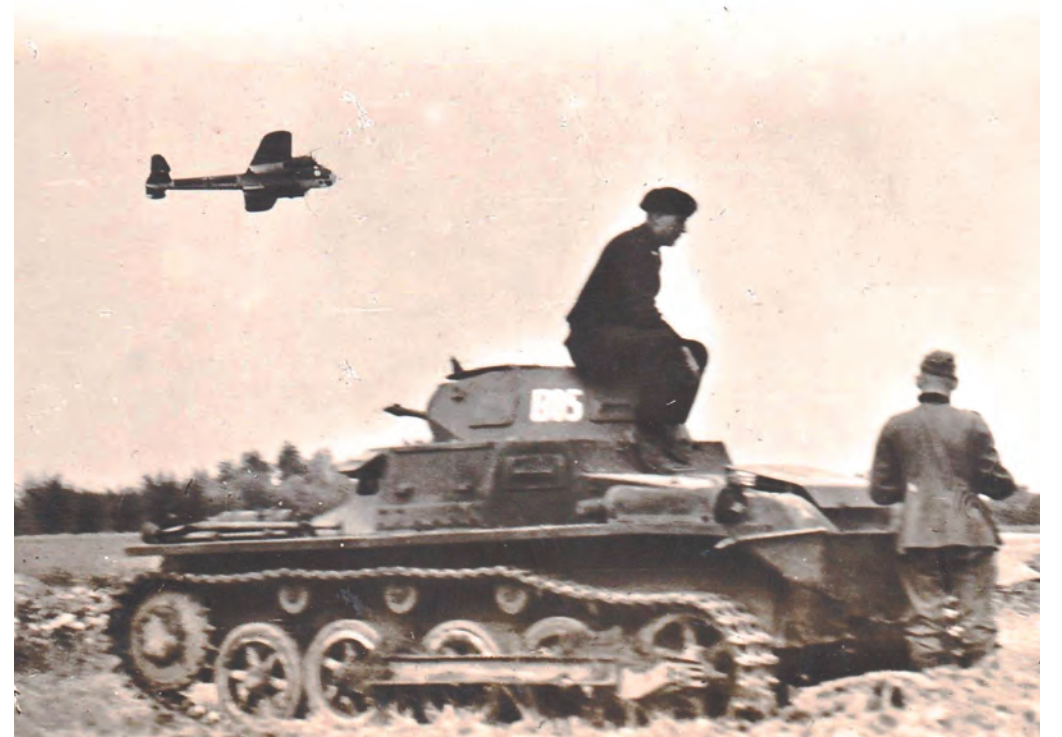
Для одного из экипажей люфтваффе полет над Щекинским районом в 1941 году стал роковым