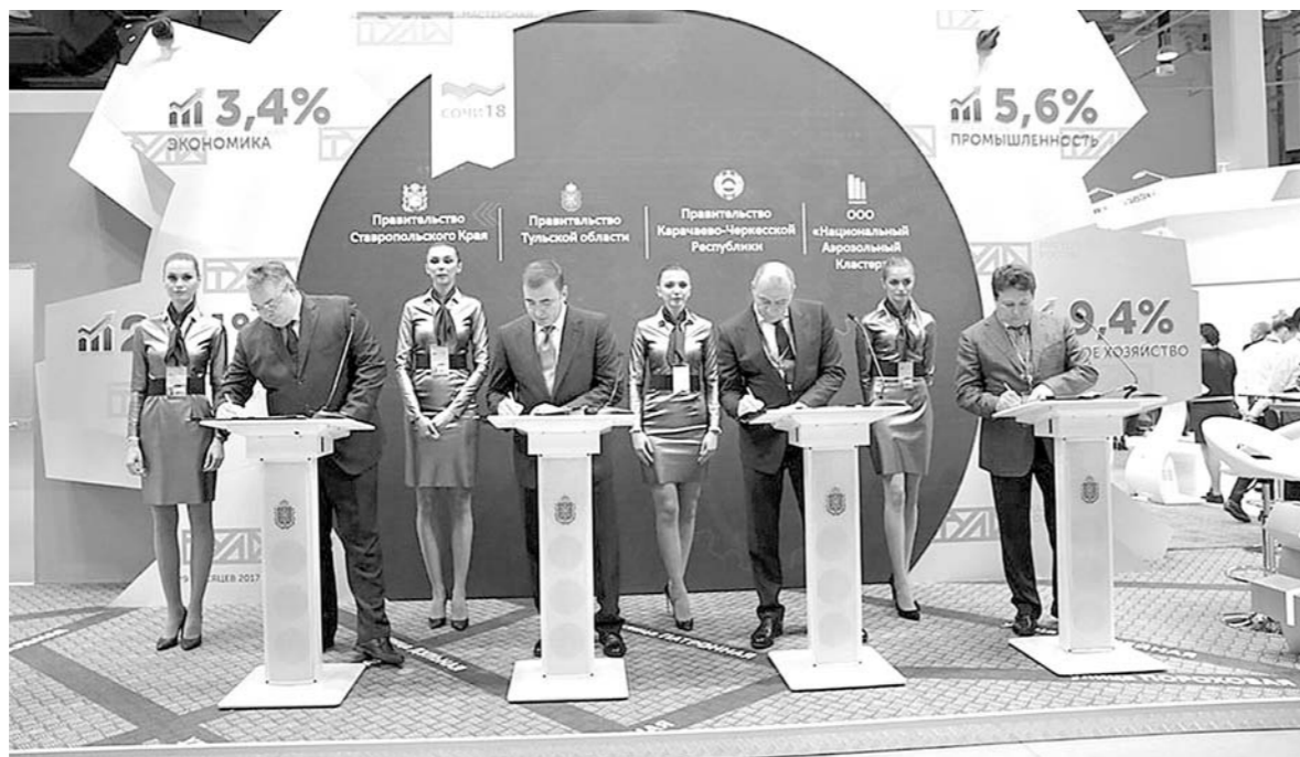
Губернатор стал участником сессии, посвященной лучшим практикам социально-экономического развития

А в еще в физкультурный комплекс переместятся секции спортивной школы по боксу, теннису, волейболу и футболу. И конечно же, в залах ФОКа станут проводить районные и областные спортивные состязания.