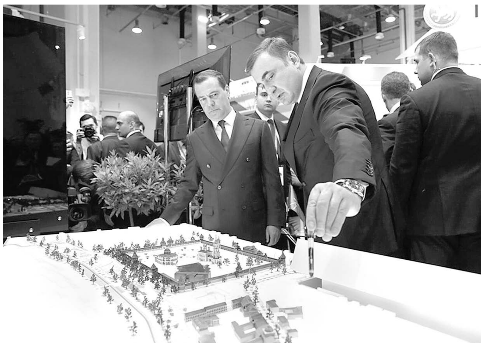
Алексей Дюмин презентует Дмитрию Медведеву проект «Тулская набережная»