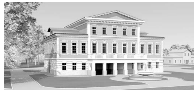
Так будет выглядеть усадьба после завершения всех восстановительных работ

На данный момент идет проверка и утверждение смет на работы по восстановлению усадьбы Мосоловых, затем состоится аукцион, а во втором квартале 2018 года начнется и само восстановление исторического объекта.