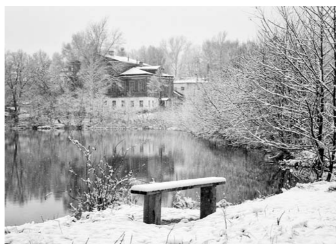
Вид на усадьбу с берега возрожденного пруда

Первый шаг по возрождению усадьбы Мосоловых был сделан в 2014 году, – рассказывает Кирилл Гузов. – К