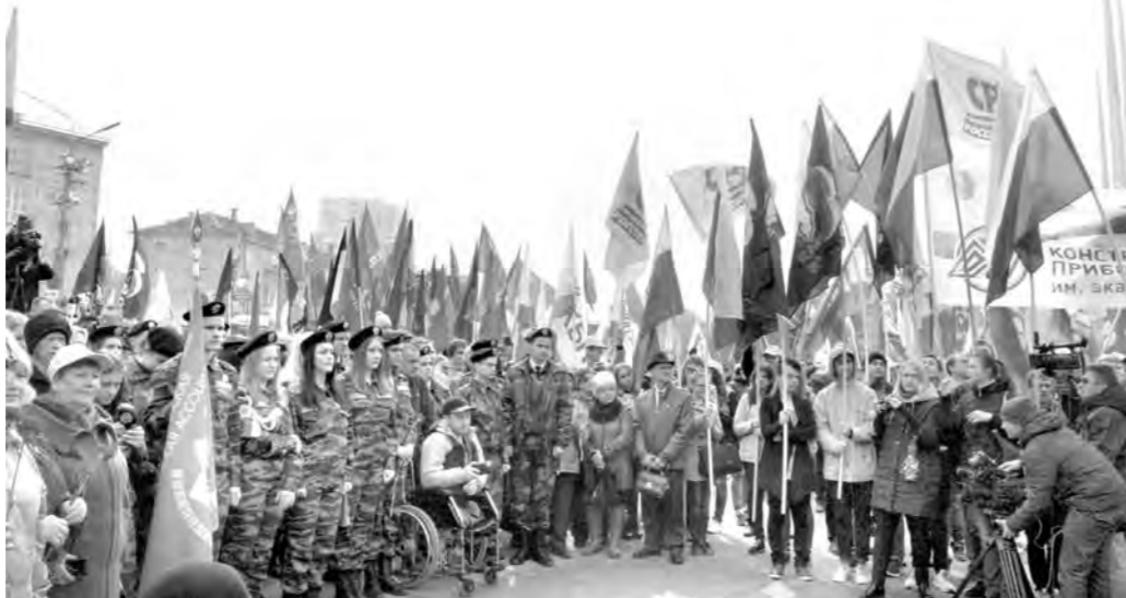
Если на старте 2017-го в регионе было зарегистрировано 57 отделений политических партий, то к финишу года осталось лишь 51

Если на начало 2017-го региональным Управлением Минюста России в Тульской области было зарегистрировано 57 отделений политических партий, то к 1 января года нынешнего их численность сократилась до 51. При этом в течение прошлого года было зарегистрировано три новых региональных отделения: «Партии Малого Бизнеса России», «Народно-патриотической партии России – Власть Народу» и «Беспартийной России». Два последние успели в том же году и ликвидироваться. Кроме того, почли в бозе региональные подразделения «Умной России», которая была зарегистрирована пять лет назад. «Партии социальной солидарности» и «Против всех», действовавших в области с 2013-го. В этом же списке оказались филиалы