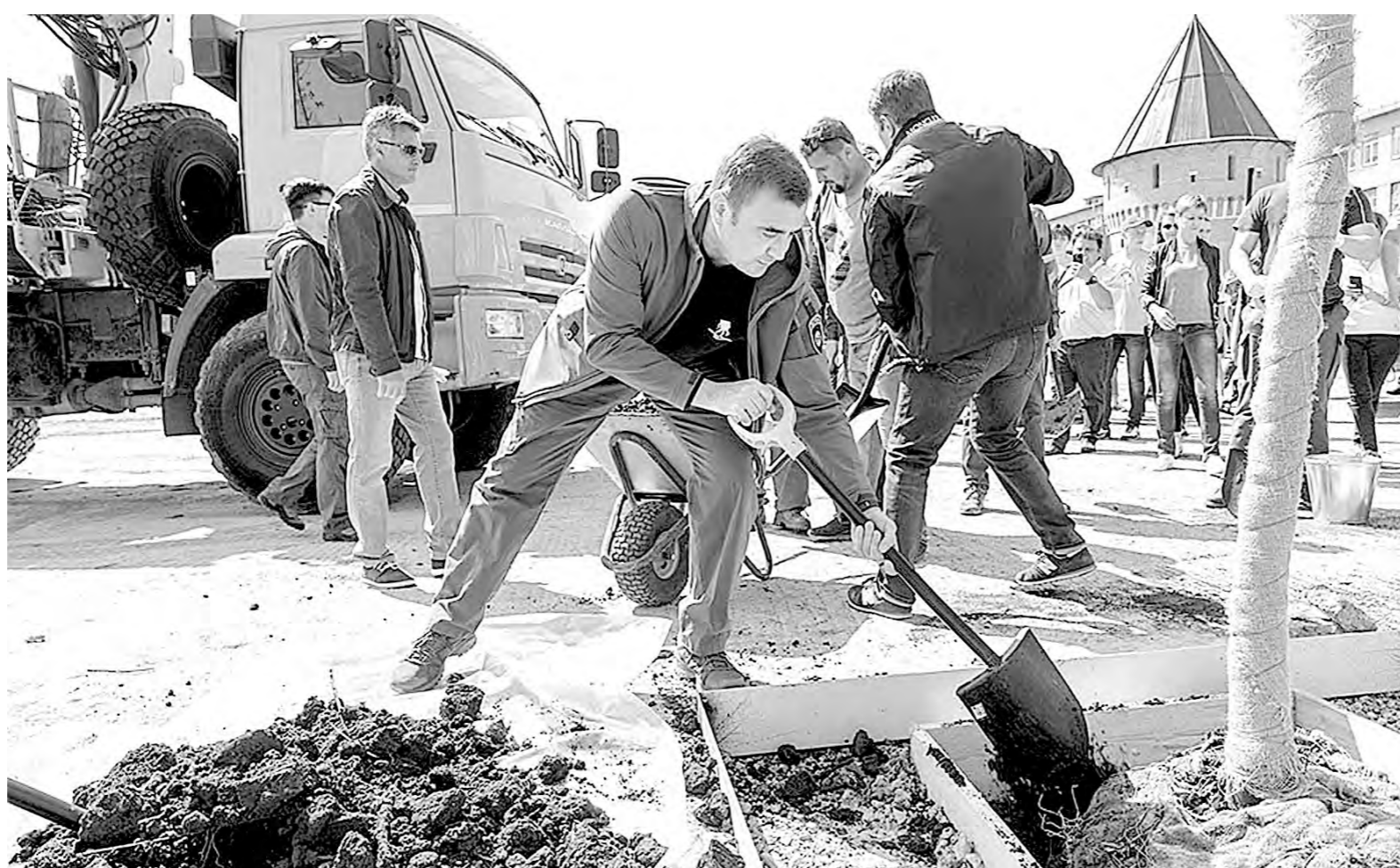
Алексей Дюмин посадил в ходе субботника несколько деревьев