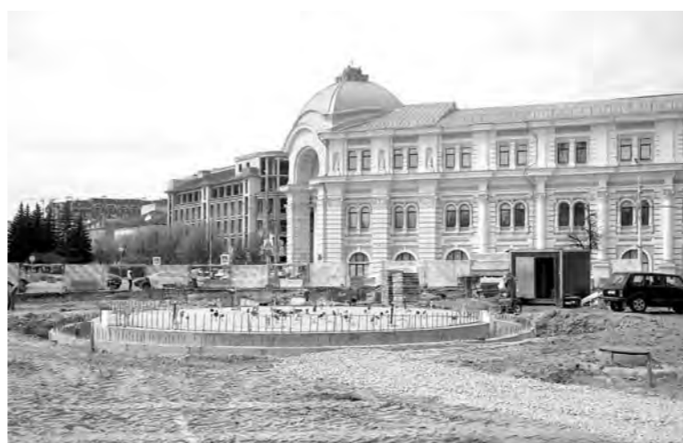
На Крестовоздвиженской площади скоро появится фонтан

Отметим, субботник прошел во всех муниципальных образованиях области. В числе работ – благоустройство мемориальных комплексов, братских воинских захоронений, памятников и обелисков воинской славы. Всего в субботнике приняли участие более 50 тысяч человек.