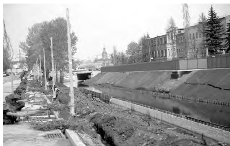
Набережная Упы обещает стать еще одним брендом Тулы