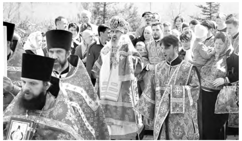
Торжество началось с крестного хода