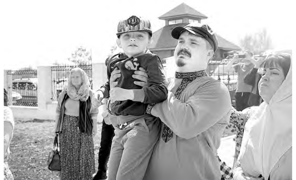
В Себино в тот день приезжали семьями