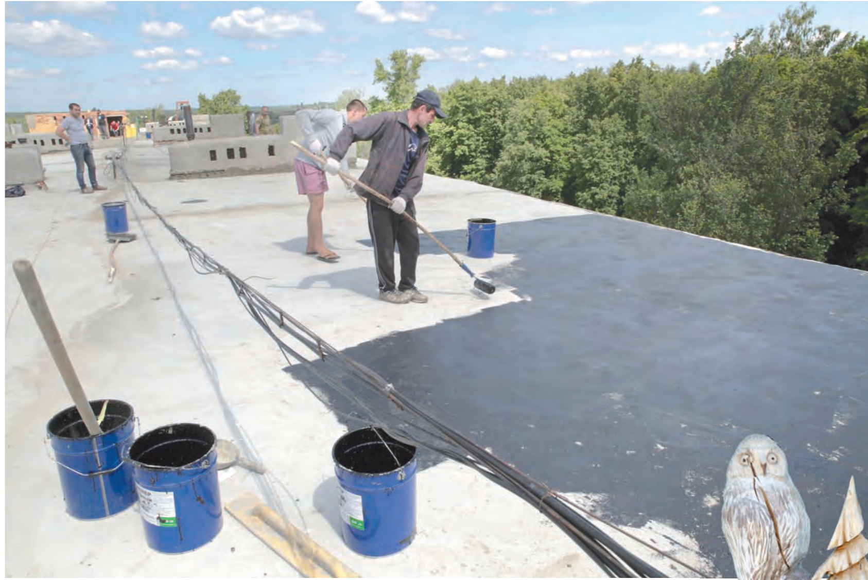
Замена кровли дома № 26 по улице Победы