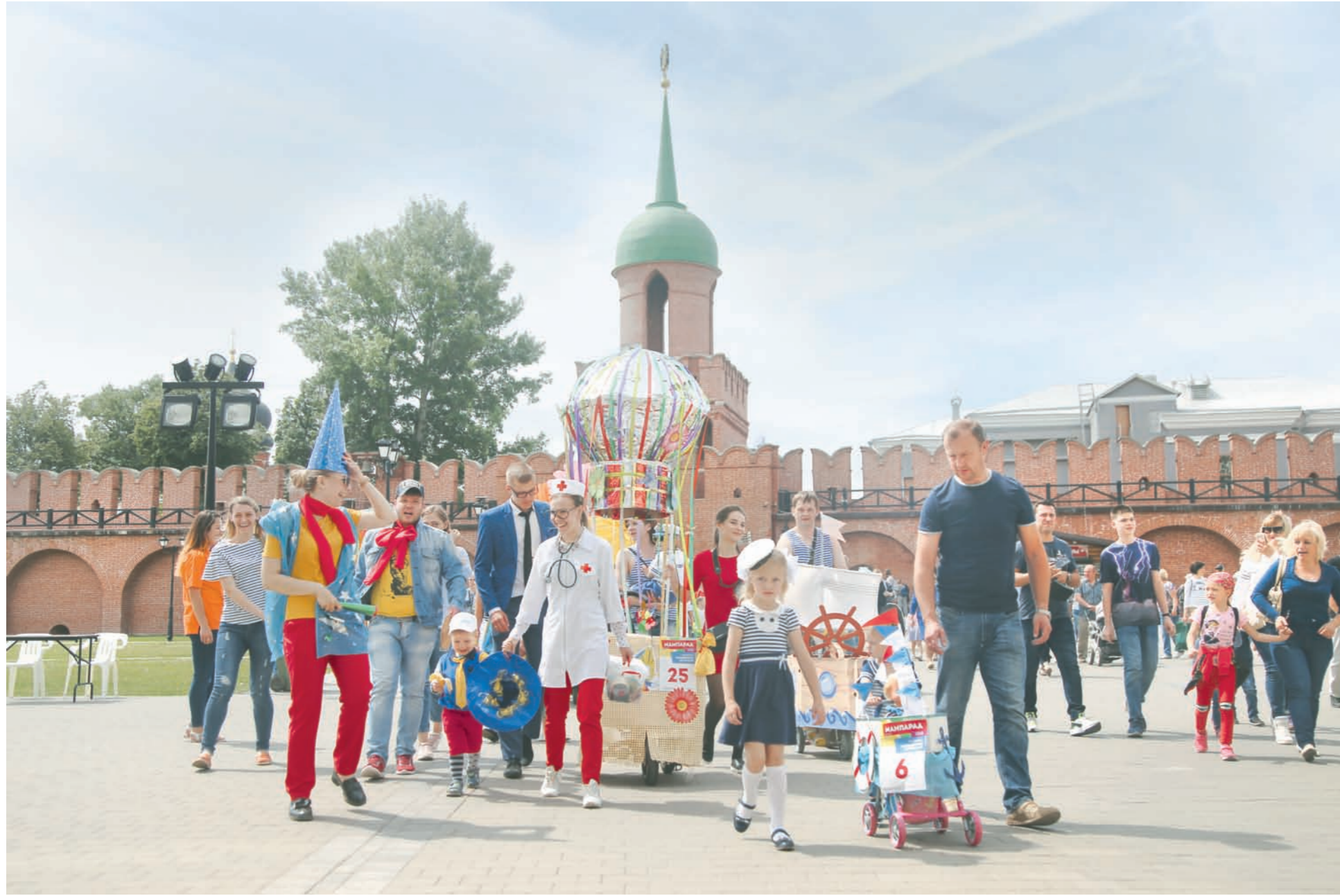
Соб. инф. Елена КУЗНЕЦОВА

Семейный праздник «МамПарад» в областной столице проходит уже девять лет, но на территории Тульского кремля – впервые.