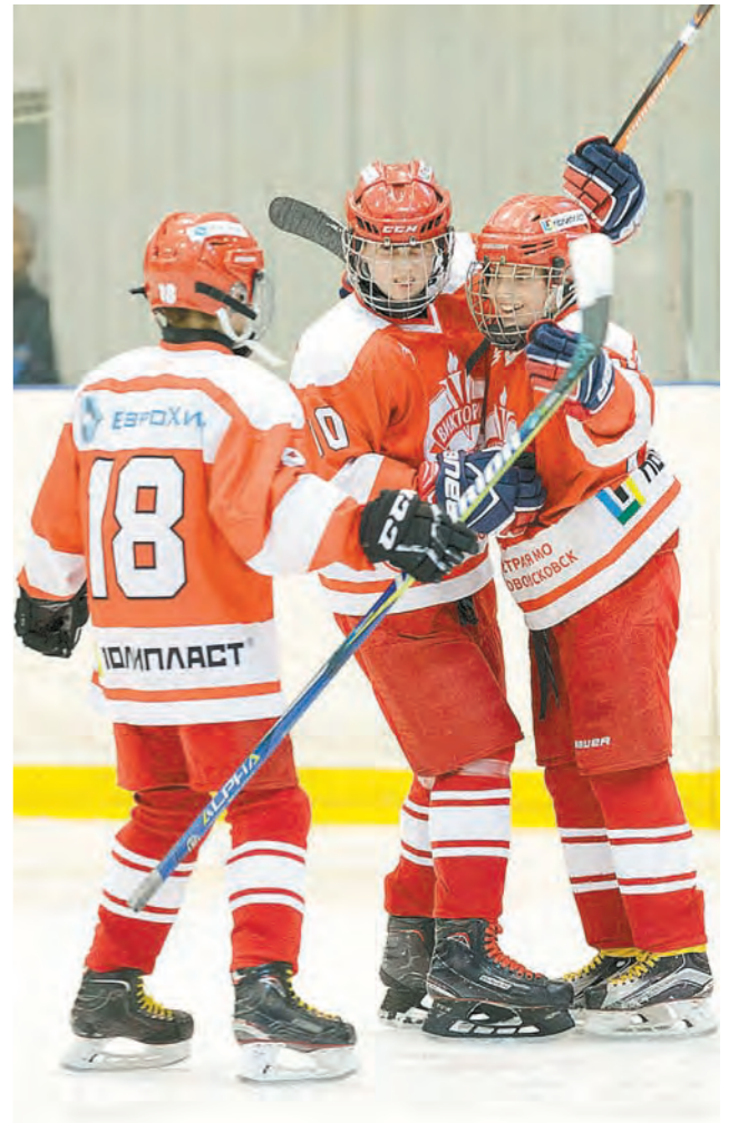
«Виктория» вернула себе Кубок «ЕвроХима»