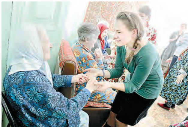
Активисты фонда «Старость в радость» работают в нашем регионе с марта 2013 года

17 ТЫСЯЧ жителей региона получают услуги соцработника на дому