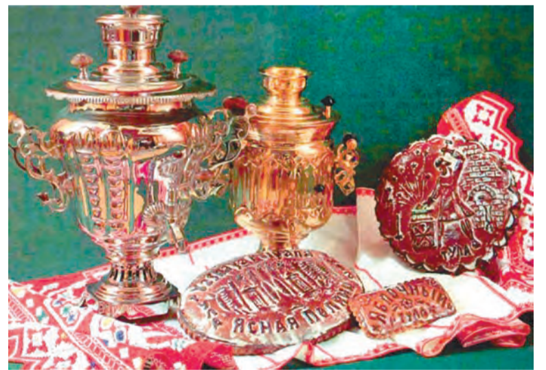
Пряников не хватало даже в Туле

Тульские дайверы погружались в Черное и Белое моря, изучали