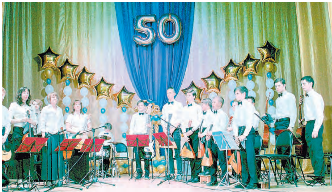
Детская школа искусств в Заокском отметила полувековой юбилей