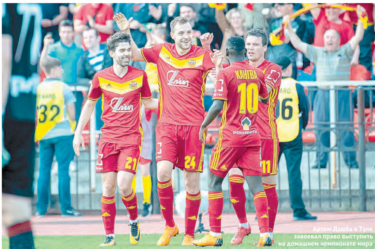
Артем Дзюба в Туле завоевал право выступить на домашнем чемпионате мира