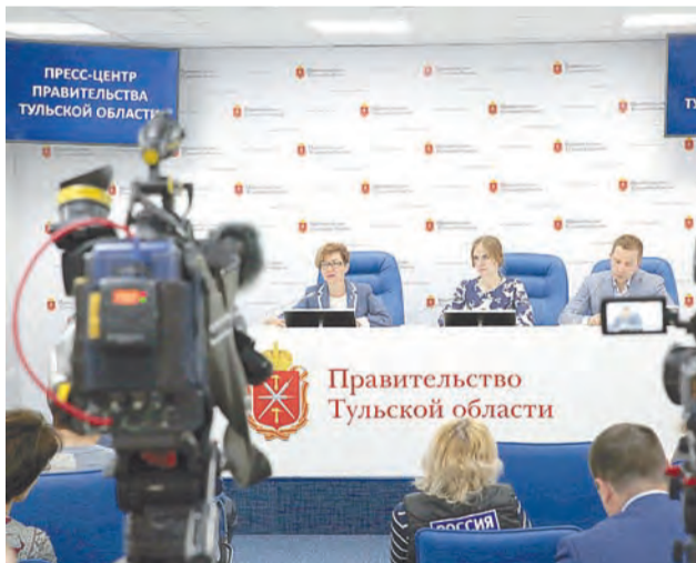
Внедрение проекта долгосрочного ухода стало темой пресс-конференции

– Результатом внедрения системы долгосрочного ухода станет улучшение условий жизни нуждающихся в нем граждан, увеличение продолжительности жизни и повышение качества жизни неизлечимых больных, – в ходе пресс-конференции, по-