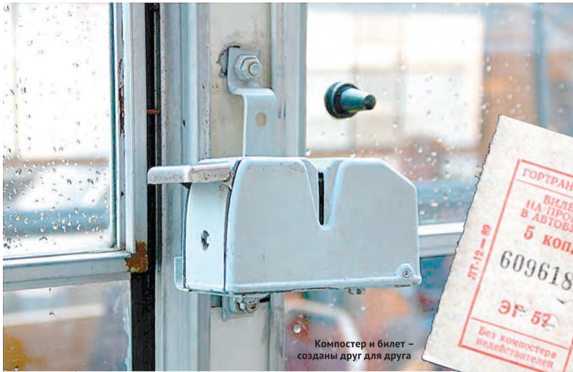
Компостер и билет – созданы друг для друга

В 1973 году в Туле десантники осуществили революционный эксперимент, в общественном транспорте стали рассчитывать на совесть пассажиров, а любителям сладкого не хватало пряников.