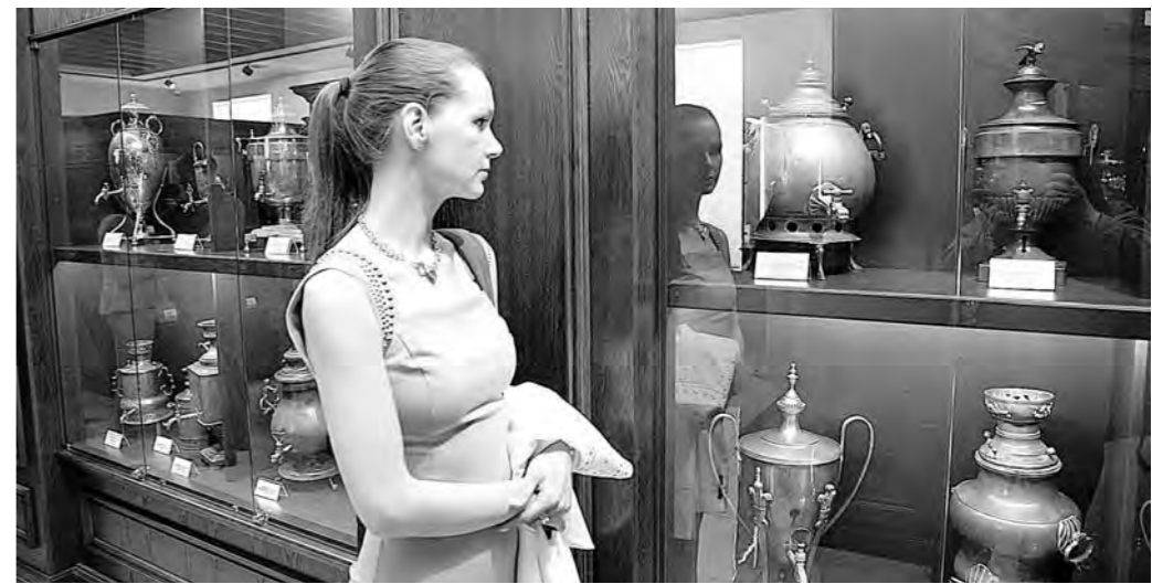
Коллекция музея самоваров и бульеток в парк-отеле «Груммант» вошла в Книгу рекордов России

Частная коллекция музея самоваров и бульеток, расположенного в парк-отеле «Груммант», месяц назад вошла в Книгу рекордов России, что подтвердил главный редактор Станислав Коненко.