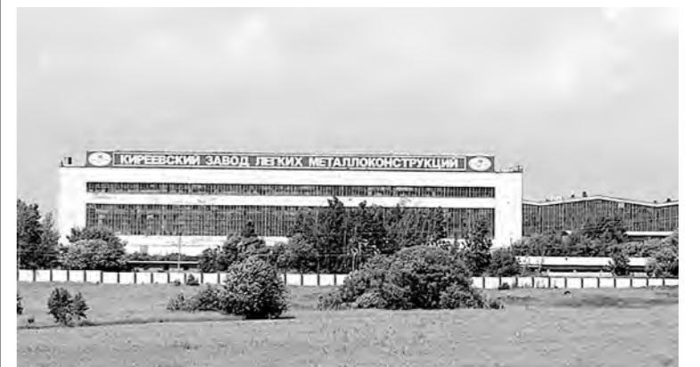
В сохранении КЗЛМК заинтересованы и областное правительство, и районная администрация