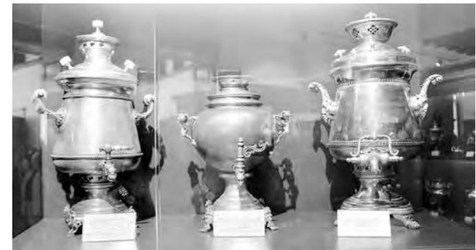
Тульские самовары удивляют разнообразием форм

Были особые русские чайные церемонии: этого напитка пили помногу, не спеша,