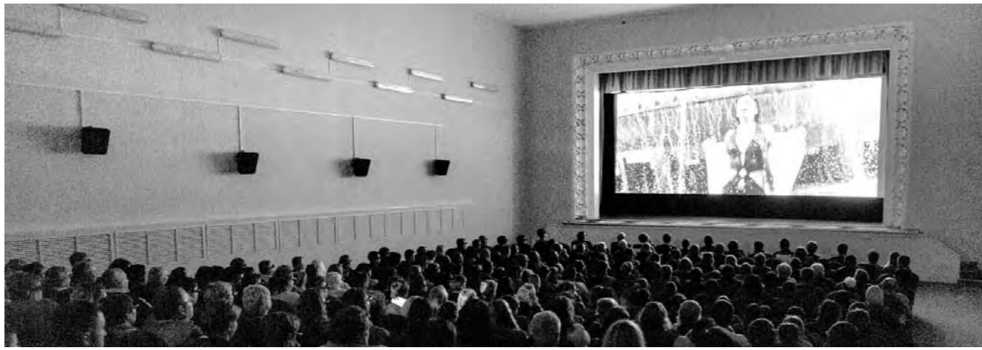
Туляки, посещающие кинотеатры и другие места с массовым пребыванием людей, должны чувствовать себя в полной безопасности