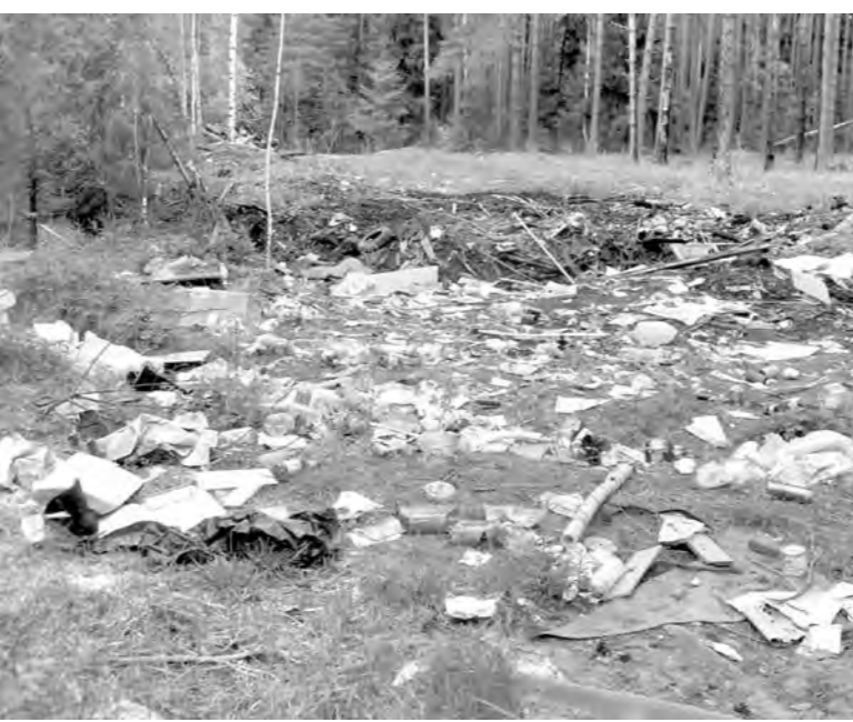
Некоторые туристы, насладившись отдыхом, оставляют после себя горы мусора