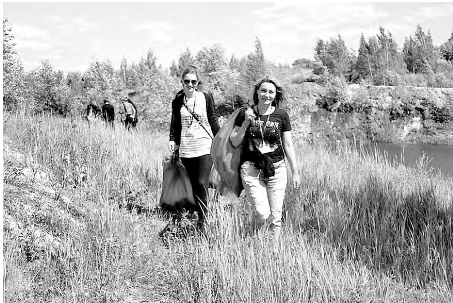
В «Чистых играх» поучаствовали более 160 жителей Тульской области

Людмила ИВАНОВА Пресс-служба правительства Тульской области и администрации Узловского района