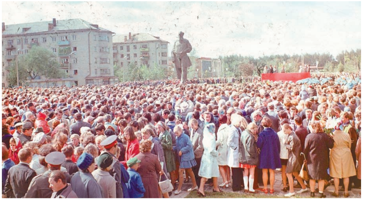
Памятник Льву Толстому открыли при огромном стечении публики