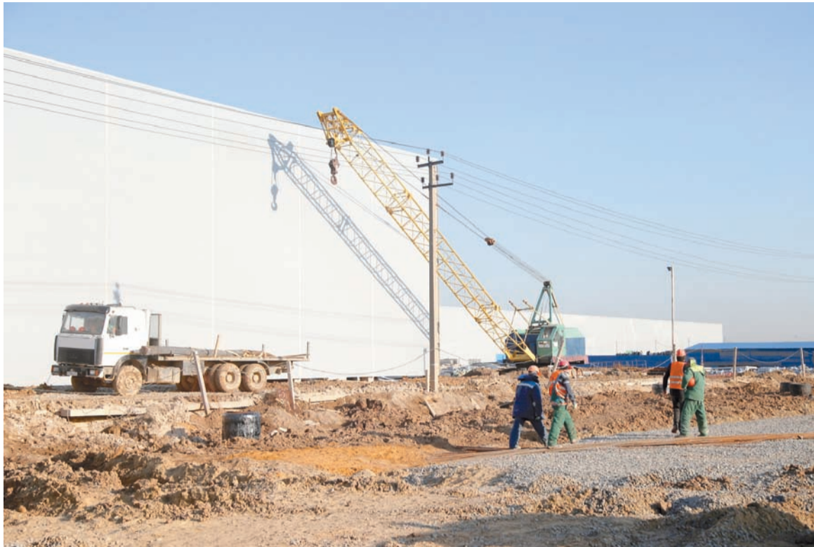
Любое грандиозное дело всегда начинается с маленьких шагов. Бизнесу их помогают сделать инвестиционные уполномоченные (на фото: строительство автозавода Great Wall)

Координирует деятельность муниципальных инвестиционных уполномоченных инвести-