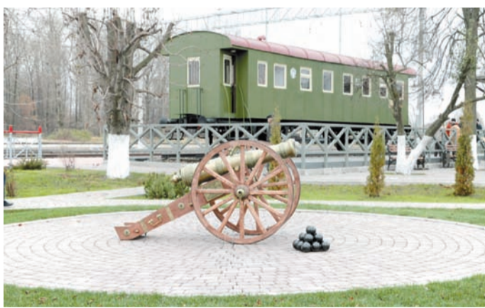
В Щекино можно погрузиться в атмосферу «Анны Карениной»

прошла в начале 2010-х, пассажиры стали принимать три станции: Березки (она осталась отправочным пунктом), Парковая и Исток Дона.