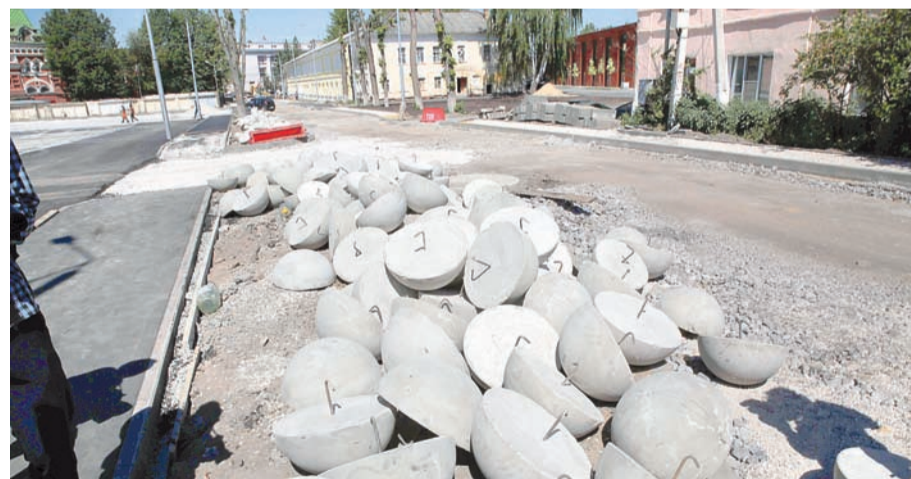
Эти «таблетки» совсем скоро станут средством безопасности на улице Благовещенской

дению в надлежащий облик прилегающей территории. К моменту открытия парковки должны быть отремонтированы фасады домов, расположенных по улицам Союзная и Благовещенская. Собственники зданий, как правило, с пониманием относятся к необходимости этих работ. Ну а тем, кто пока не спешит с обновлением, выдаются соответствующие предписания. Ведь являясь хозяином объекта культурного наследия, нужно не забывать о прямой обязанности содержать здание в надлежащем виде. Тем же юридическим лицам, которые будут игнорировать данное требование, придется заплатить штраф до 5 миллионов рублей. Ну а крайней мерой может оказаться изъятие объекта и его передача тому, кто имеет силы и желание для его восстановления.