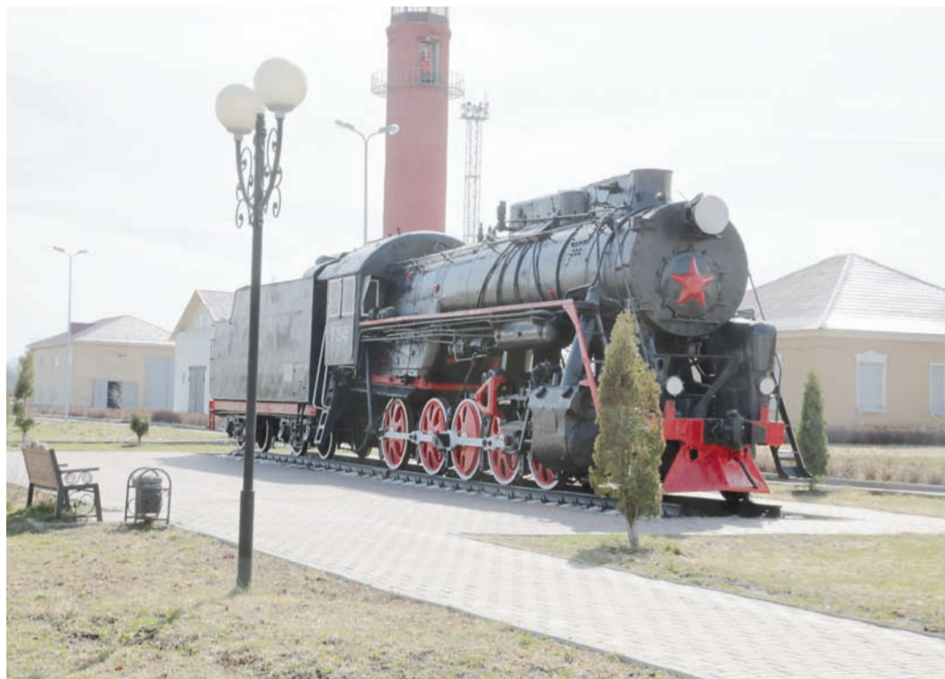
На паровоз, установленный в Вене, можно даже забраться

Один из маршрутов, которым можно отправиться отсюда, – толстовский, к станциям Козлова Засека, куда при жизни часто навещался Лев Николаевич, и Щекино, которая до 1902 года называлась Ясен-