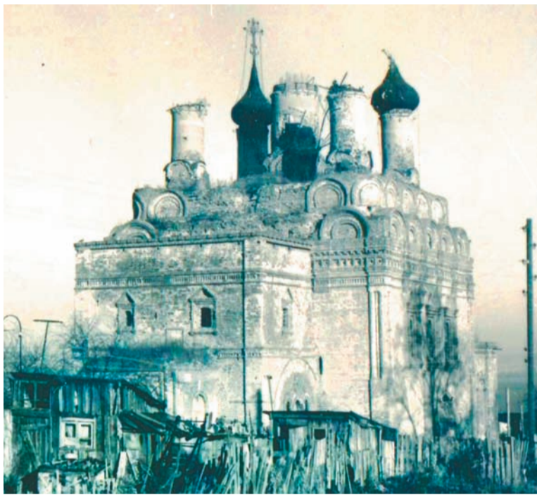
Белевский Спасо-Преображенский собор в 1973 году использовали под склад для хранения соли

поясе астероидов, которые расположены между орбитами Юпитера и Марса. Он удален от Солнца на расстояние 2897 астрономических единиц – более 433 миллиардов километров. Удостоверение о присвоении малой планеты имени Плавск хранится в районном краеведческом музее.