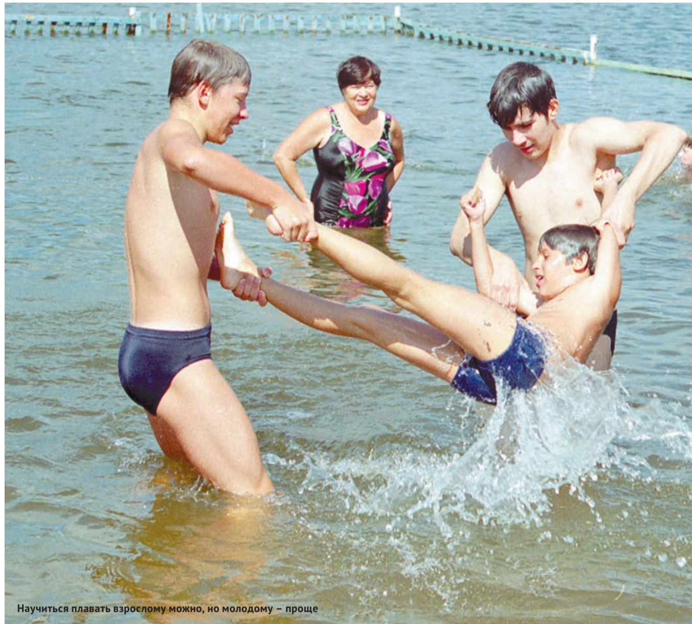
Научиться плавать взрослому можно, но молодому – проще