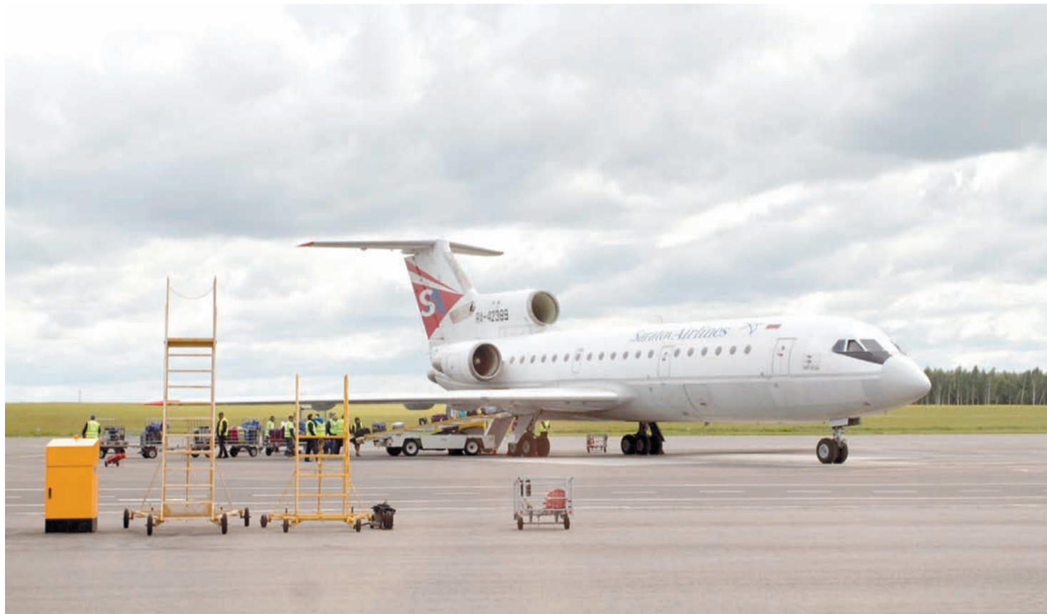
Тульская область будет сотрудничать с ПАО «Объединенная авиастроительная корпорация», которая делает ставку на развитие авиационной техники

За время форума также было подписано соглашение с ООО «Тульский завод алюминия» о строительстве в ОЭЗ «Узловая» высокотехнологичного литейно-прессового завода по переработке алюминиевых сплавов (объем инвестиций – свыше 2,6 млрд рублей, количество рабочих мест – 225). Также закреплена договоренность с ООО «Мистраль» о строительстве производ-