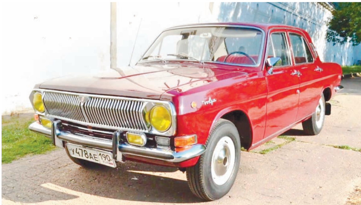
Так выглядела экспортная «Волга» – уплотнители проемов дверей этих машин изготавливали в Узловой

А что же мы получали от иностранцев? Так, по Туле стали курсировать комфортабельные автобусы «Икарус-260», полученные из Венгрии.