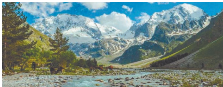
Природа Кабардино-Балкарии уникальна своим разнообразием. Ландшафтные зоны – от жарких сухих степей до страны вечных льдов – спрессованы на отрезке в полторы сотни километров