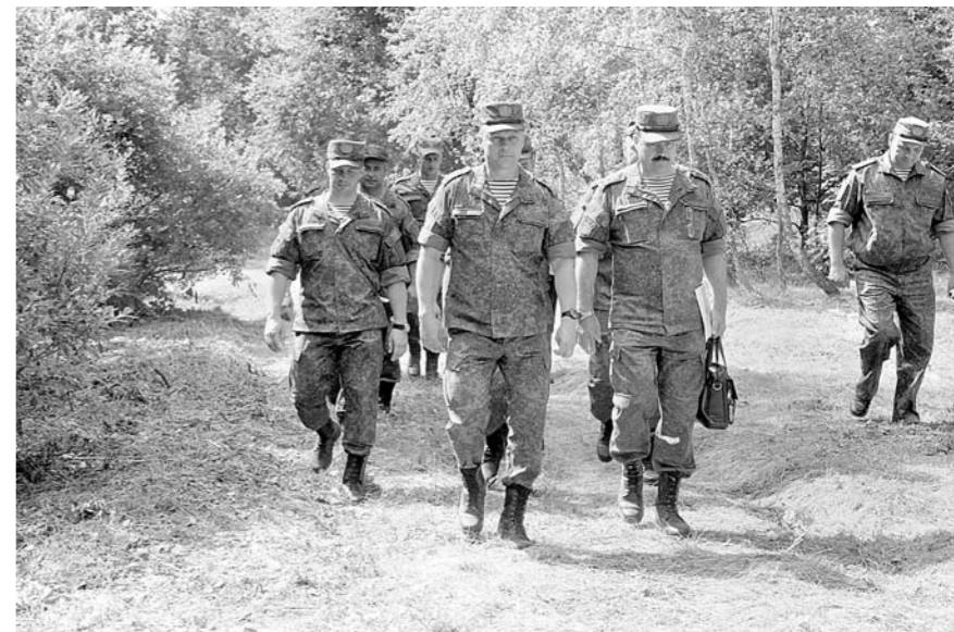
На базе 1060-го отдельного батальона материального обеспечения собрались тыловики из всех воинских частей ВДВ

Впрочем, что и где появилось в лесу – так называемом пункте сосредоточения – было понятно только военным. Столовые и полевые кухни, хлебопекарня и боевые машины, баня и места размещения личного состава были глубоко вкопаны в землю, спрятаны в ложбинах и кустарниках, а сверху затянута маскировочной сеткой. Чуть в стороне дожидались своего часа навесы из веток, землянка с укрепленными стенами, конусный шалаш, которому позавидовала бы вся ребятня советской эпохи, и несколько видов костров, предназначенных для каждого укрытия. И если бы здесь пролетал беспилотный летательный аппарат, он смог бы зафиксировать только привычный лесной ландшафт: