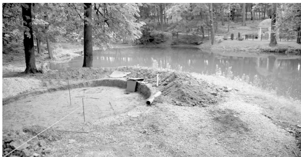
На этом месте к сентябрю появится еще одна ротонда