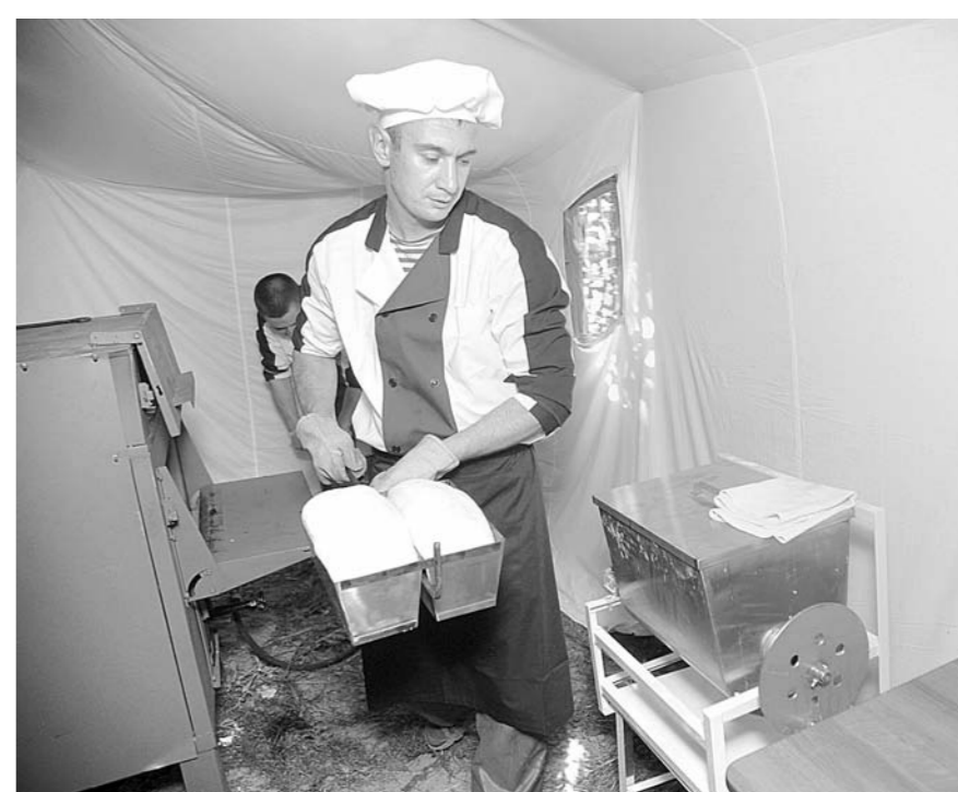
Тесто замешивается 30 минут, настаивается полтора часа и еще два часа выпекается. Из него выходит 16 буханок хлеба массой в 1,2 килограмма

массивы деревьев, ленты оврагов и одиночные кустарники.