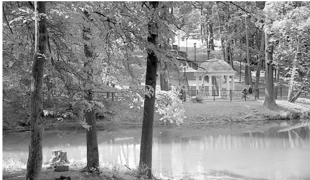
Будучи заброшенным и неухоженным местом еще пару лет назад, сегодня Платоновский парк преобразается на глазах

«Дебри», «непролазный лес», «большая мусорка» – как только не называли туляки Платоновский парк, расположенный в южной части города. Еще пару лет назад это место никак не ассоциировалось с зоной отдыха, тем более культурного. Сегодня ситуация в корне иная. Парк уже частично благоустроен, облагоустроен, здесь появились набережная, ротонды, цветы и декоративные растения. И это не конец истории. Уже к середине сентября Платоновский парк преобразится еще больше.