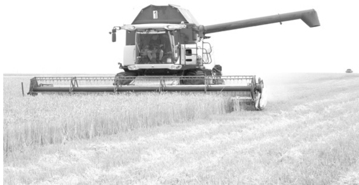
В Тульской области уже убраны первые гектары зерновых