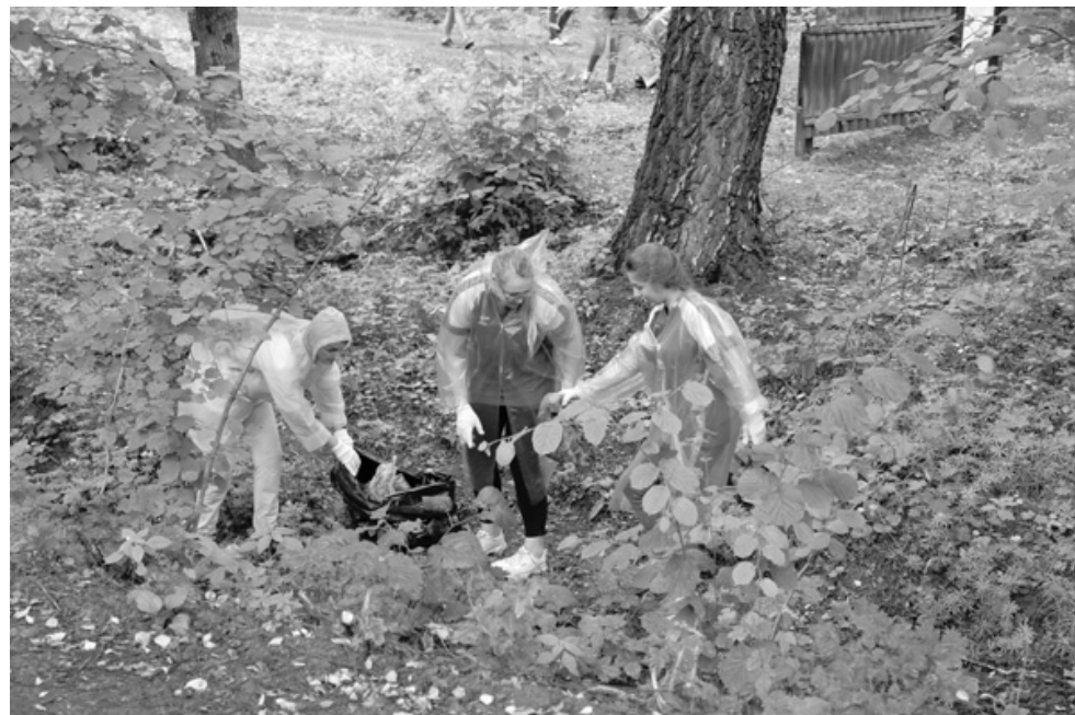
Более 100 человек приняли участие в экологическом субботнике