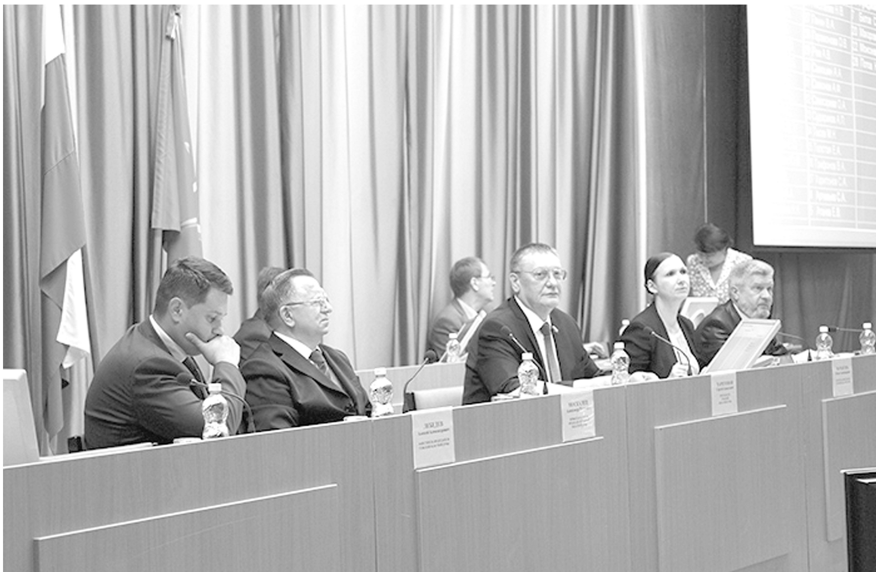
56 законов и 205 постановлений приняли депутаты Тульской областной Думы в весеннюю сессию