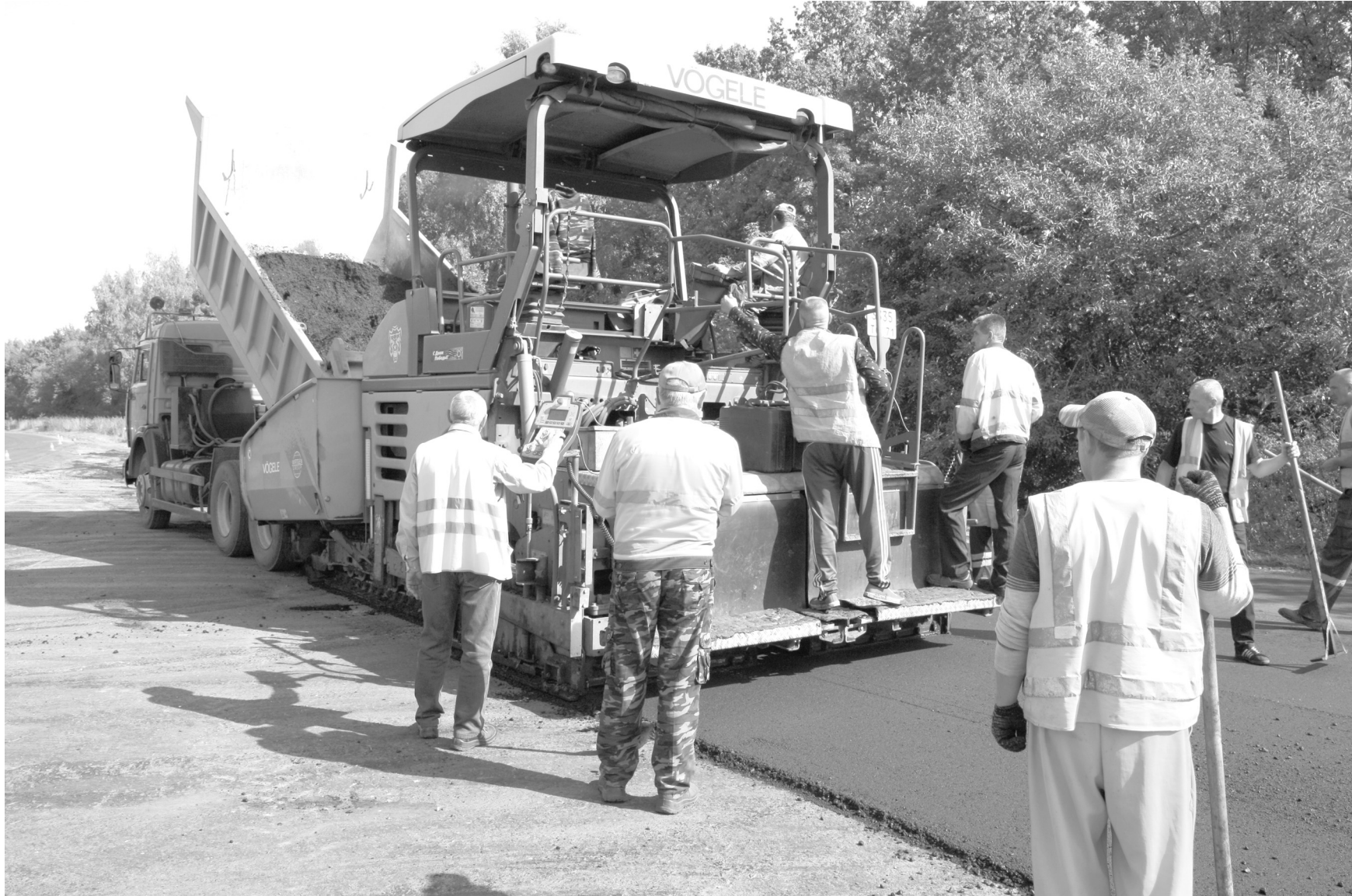
В рамках проекта «Безопасные и качественные дороги» в регионе будут отремонтированы 87 дорог

ством основания из щебня. Тем временем в поселке Заокском асфальтировали улицу Зои Космодемьянской. Также асфальтоукладчики трудились по улице Октябрьской в поселке Ханино Суворовского района.