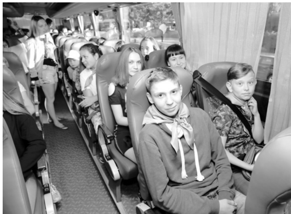
Всего этим летом в Крым отправятся 200 детей из Тульской области