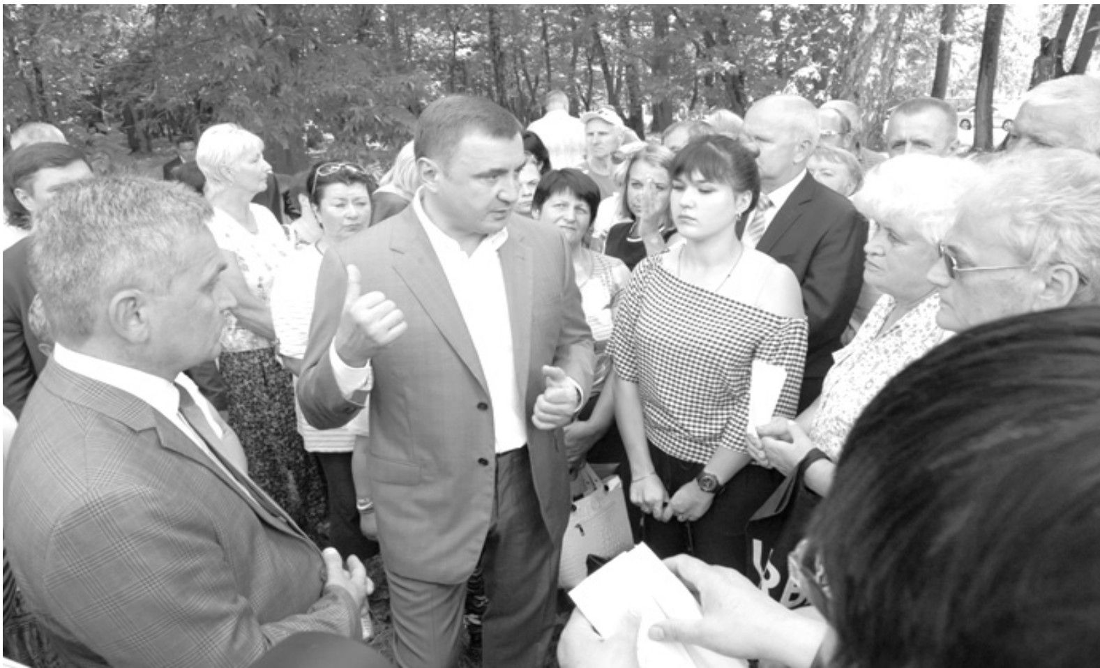
Встреча Алексея Дюмина с жителями Болохова длилась больше двух с половиной часов

– Состояние строения может оказаться настолько аварийным, что проще добавить еще 10–15 миллионов и построить новый ДК в следующем году. Может быть, он будет компактнее, пропускной