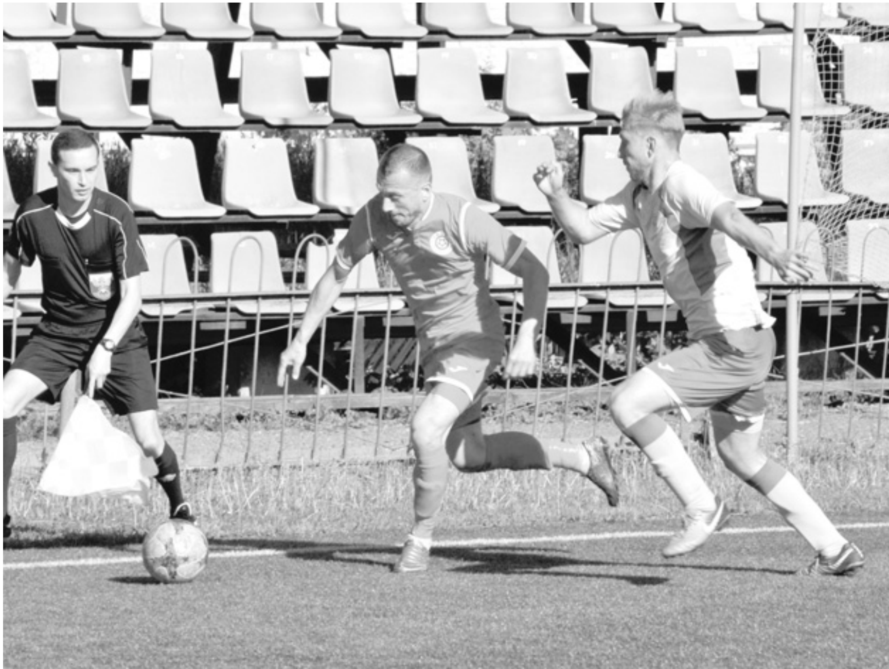
Красно-черные завершили сезон на 11-й строчке в группе «Центр»

– Оказаться в призерах первенства и в Кубке России продвигаться до того этапа, когда к нам придет команда ФНЛ или Премьер-лиги. Это, в принципе, достижимо: надо лишь пару матчей выиграть.